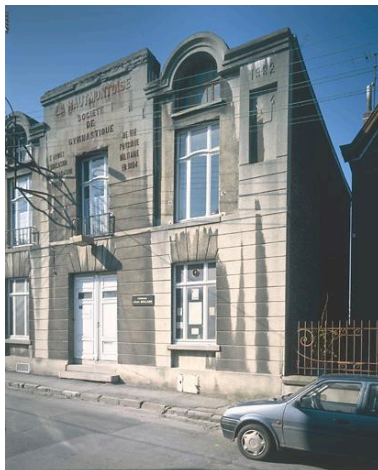
Élévation antérieure. IVR31_19935901401VA

IVR31_19925901884X