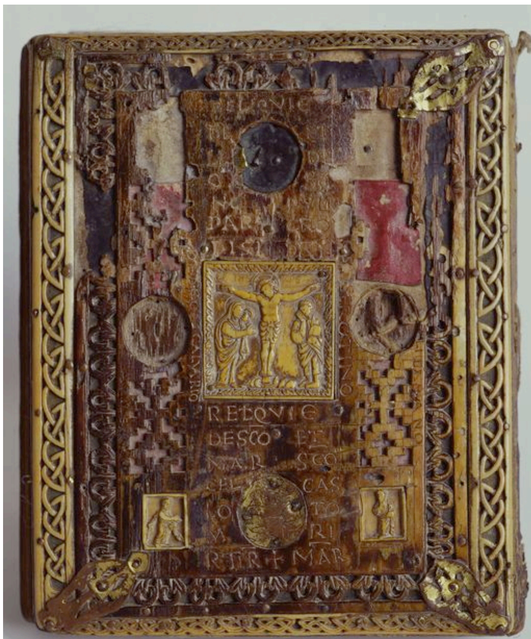
Vue du plat inférieur.