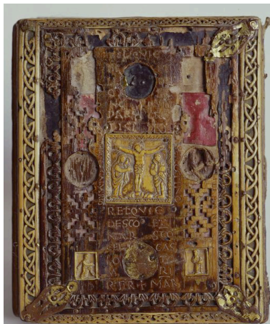
Vue du plat inférieur. IVR22_19876000331XA