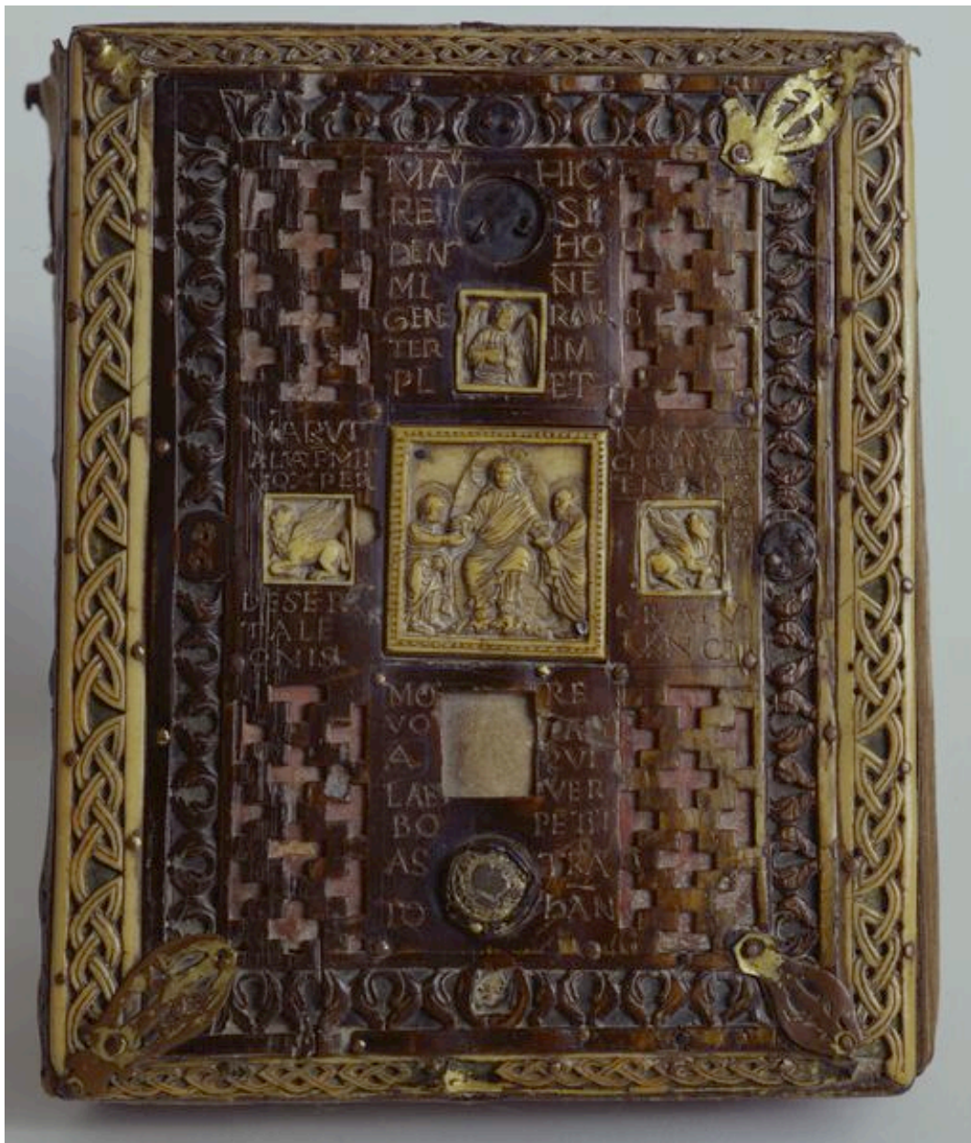
Vue du plat supérieur.