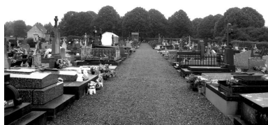
Vue de l'allée principale du cimetière communal, d'ouest en est. IVR22_19920201007Z