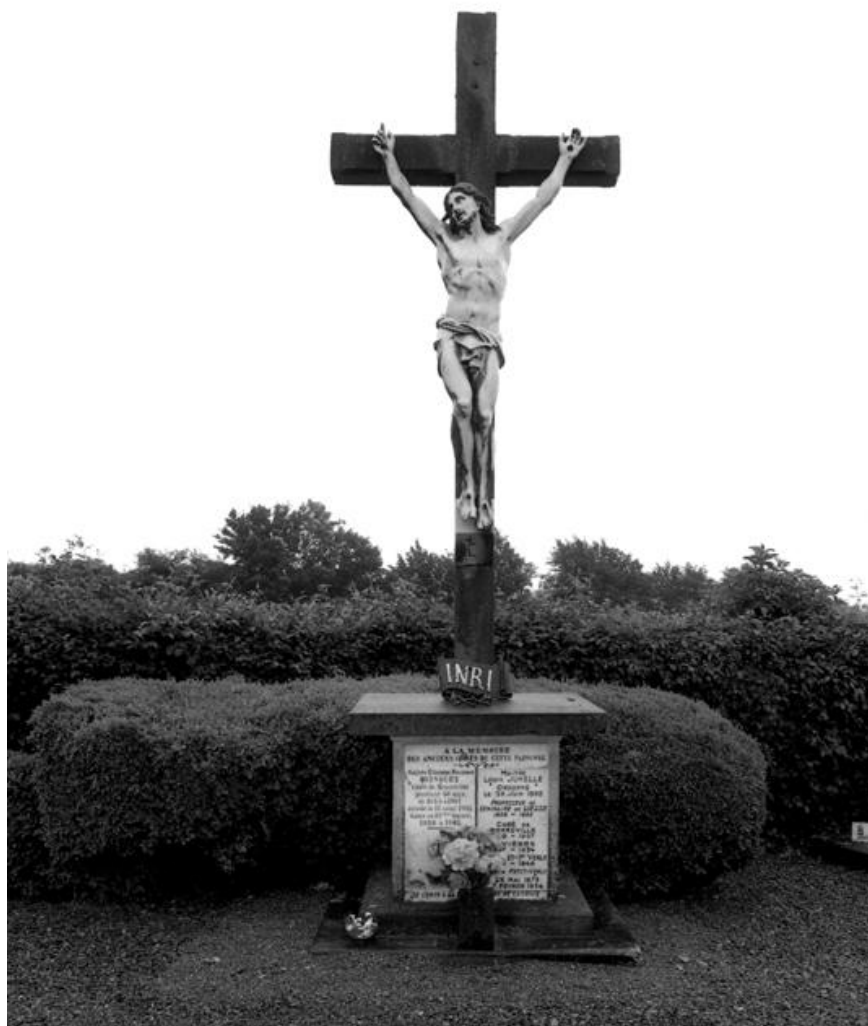
La croix du cimetière, sous laquelle sont enterrés les curés de la paroisse.