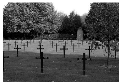
Vue de la partie du cimetière militaire où ont été regroupés 2820 soldats allemands.