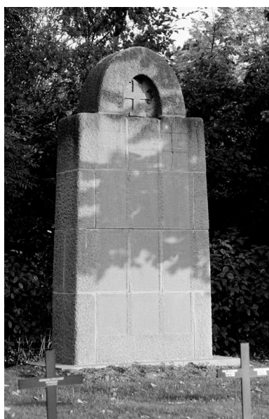
Le monument aux morts allemand.