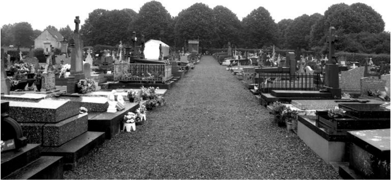
Vue de l'allée principale du cimetière communal, d'ouest en est.