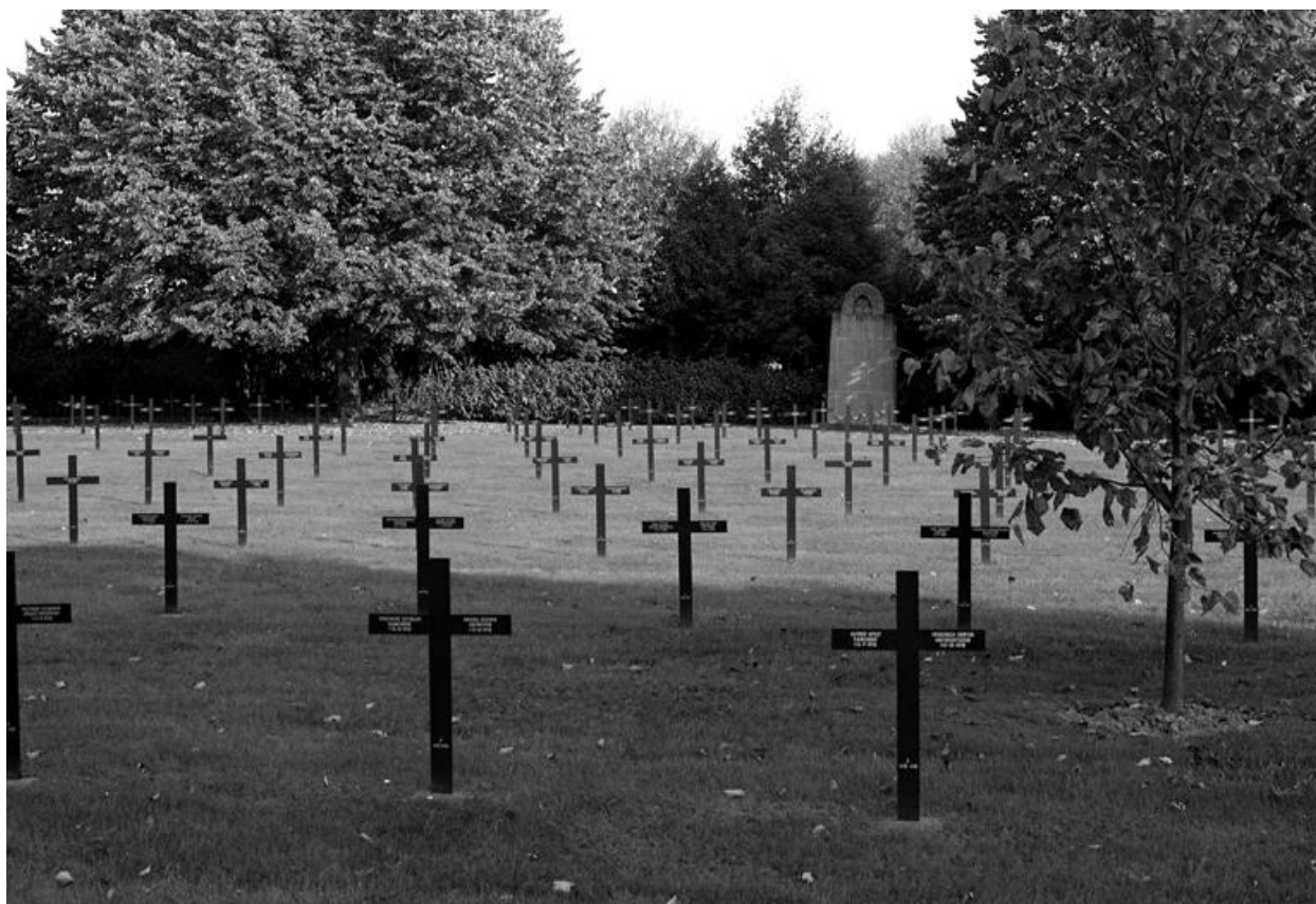
Vue de la partie du cimetière militaire où ont été regroupés 2820 soldats allemands.