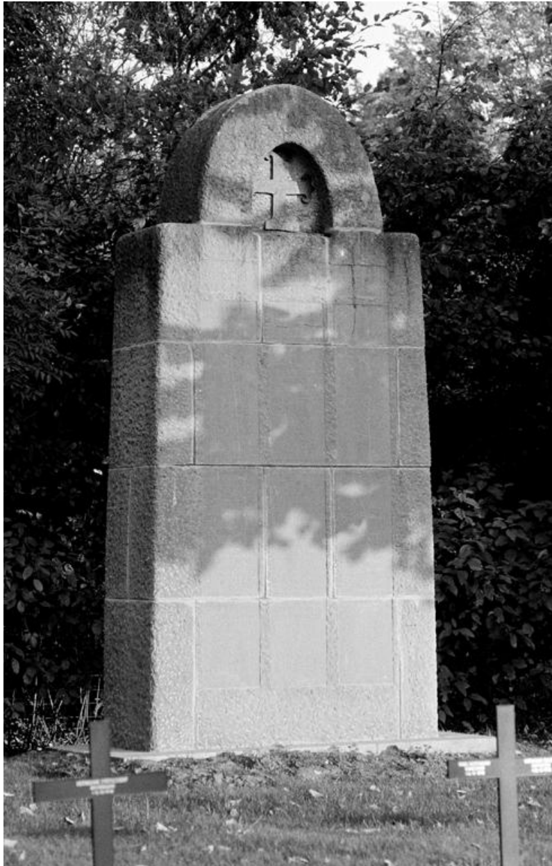
Le monument aux morts allemand.