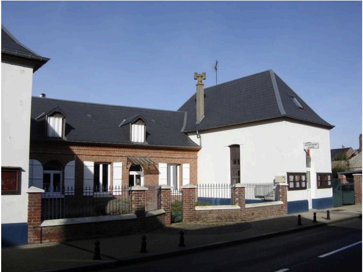
Vue détaillée de la galerie centrale.