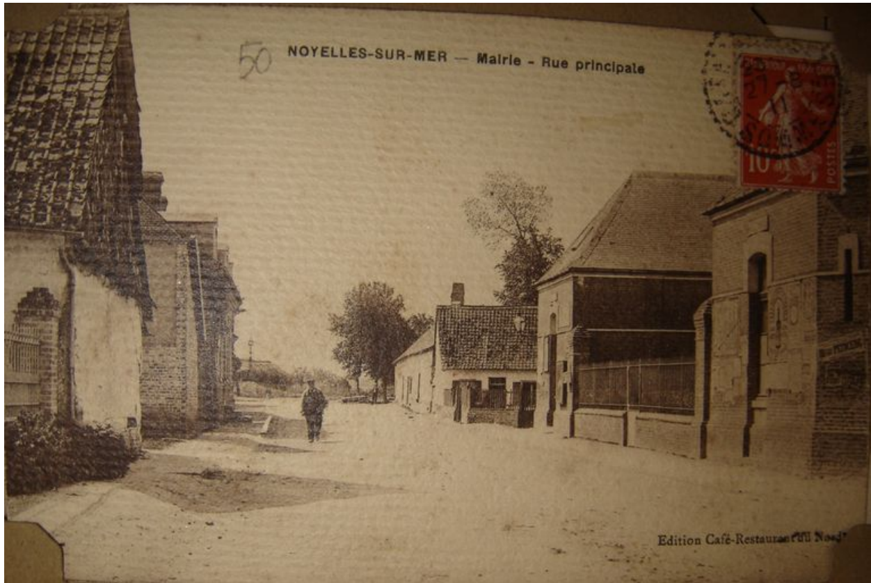
Vue ancienne de la mairie.