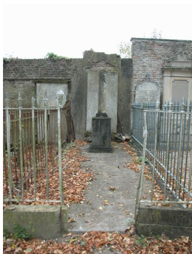
Vue générale. IVR22_20048001144NUCA