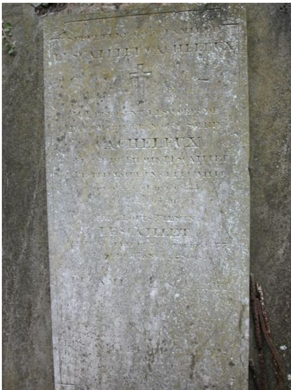
Stèle funéraire, vers 1844.