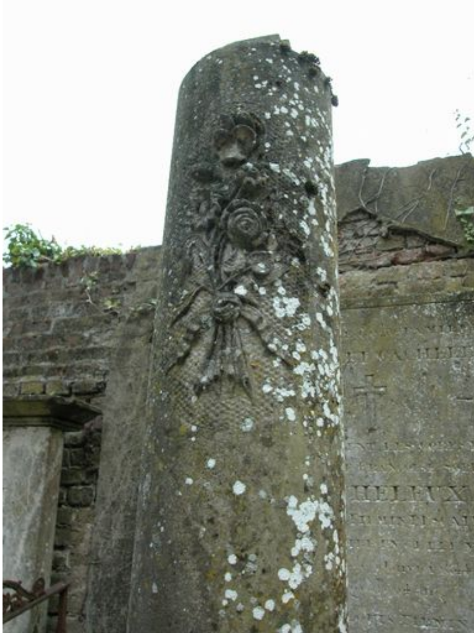
Vue de la partie supérieure de la colonne funéraire de Sophie Lescaillet, vers 1892.