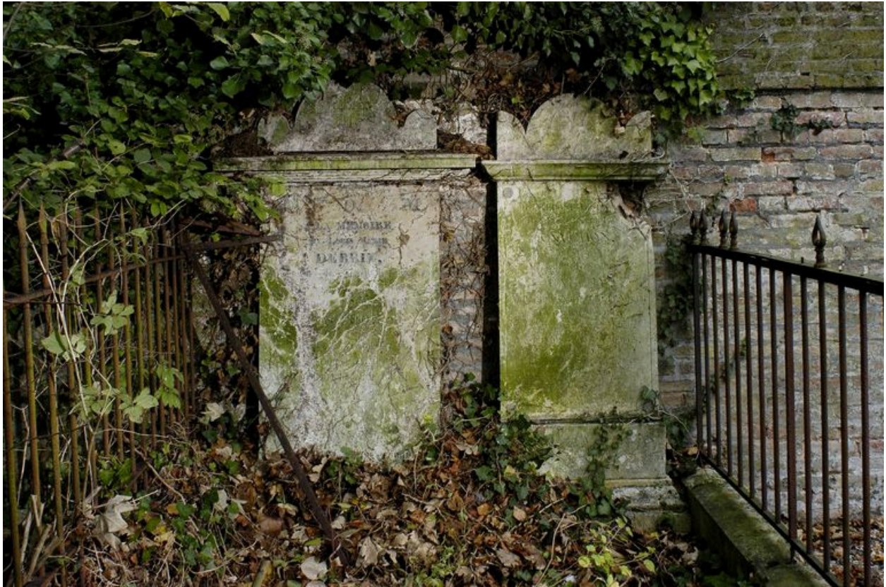
Vue des stèles.