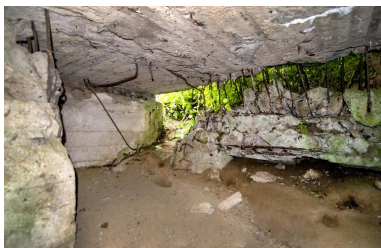
Vue intérieure vers la sortie sud-est