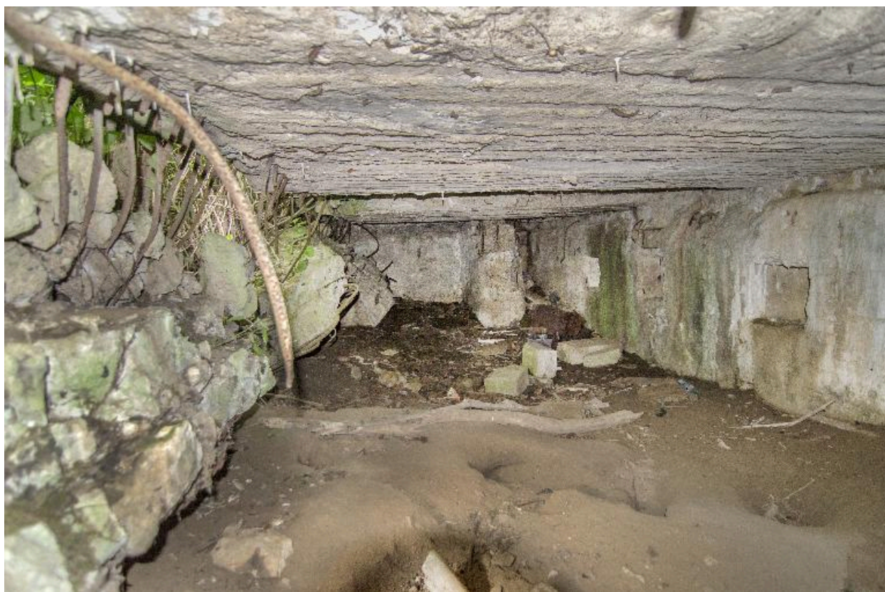
Salle principale, explosée au sud. Dans le fond, le départ de la coursière de tir