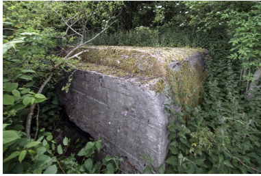
Seule partie visible de l'édifice. Le couvrement, vers le nord-ouest IVR32_20165901164NUCA