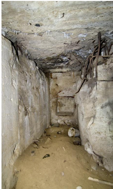
La coursière de tir en enfilade. Dans le fond, la niche à munitions