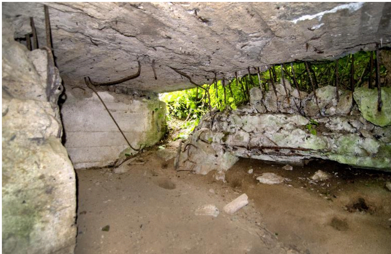
Vue intérieure vers la sortie sud-est