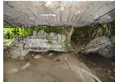
Le mur sud, explosé, de l'intérieur