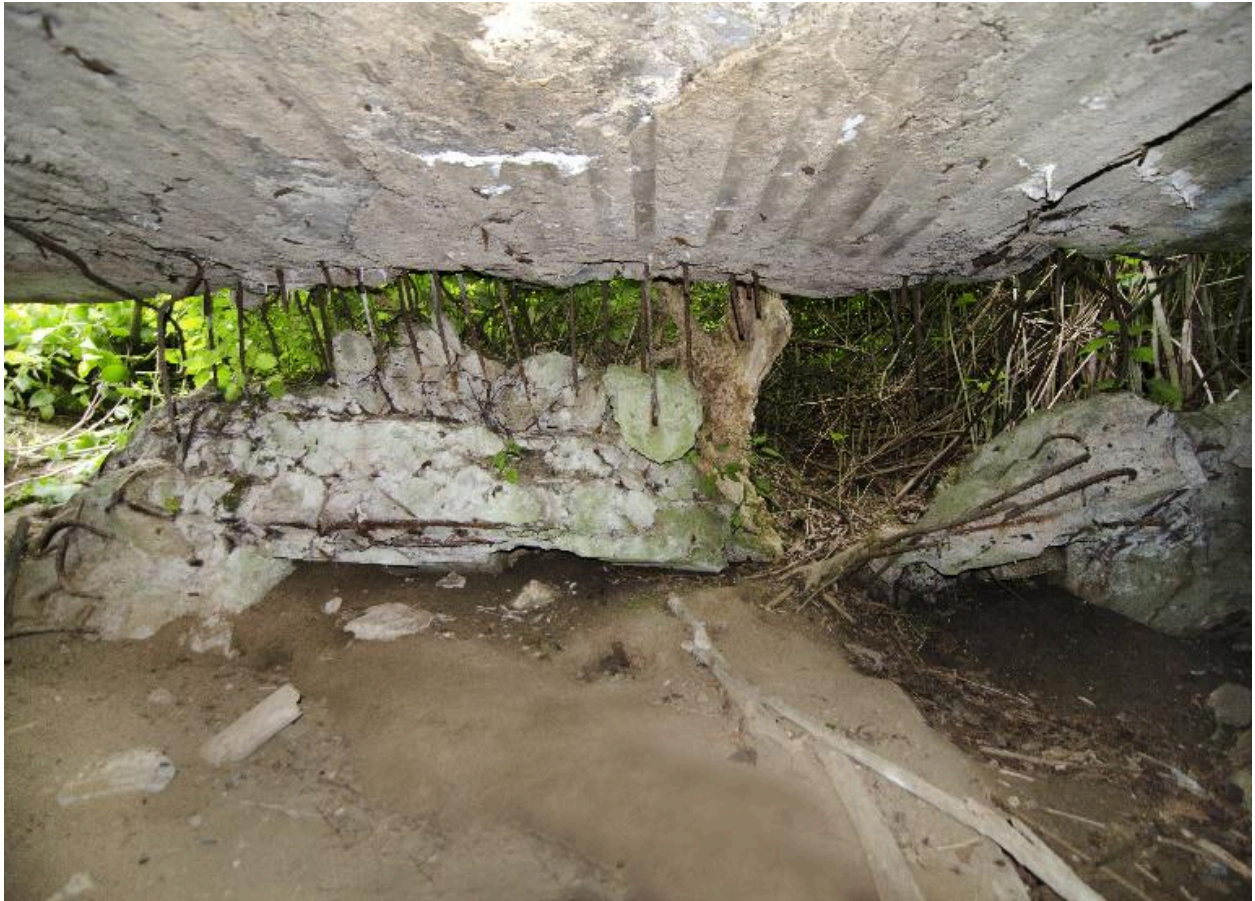
Le mur sud, explosé, de l'intérieur