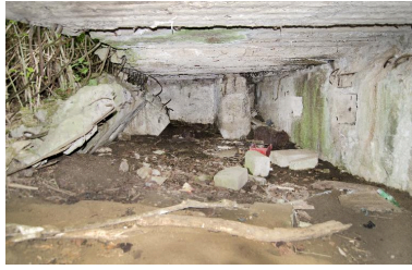
Salle principale, exposée au sud. Dans le fond, le départ de la coursière de tir IVR32_20165901166NUCA