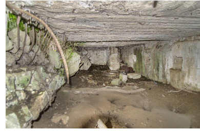
Salle principale, exposée au sud. Dans le fond, le départ de la coursière de tir