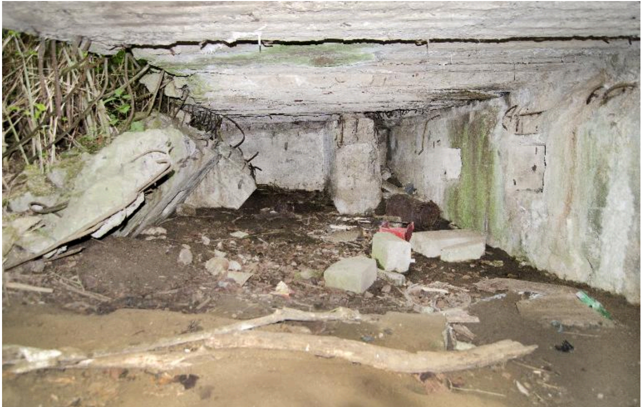
Salle principale, explosée au sud. Dans le fond, le départ de la coursière de tir