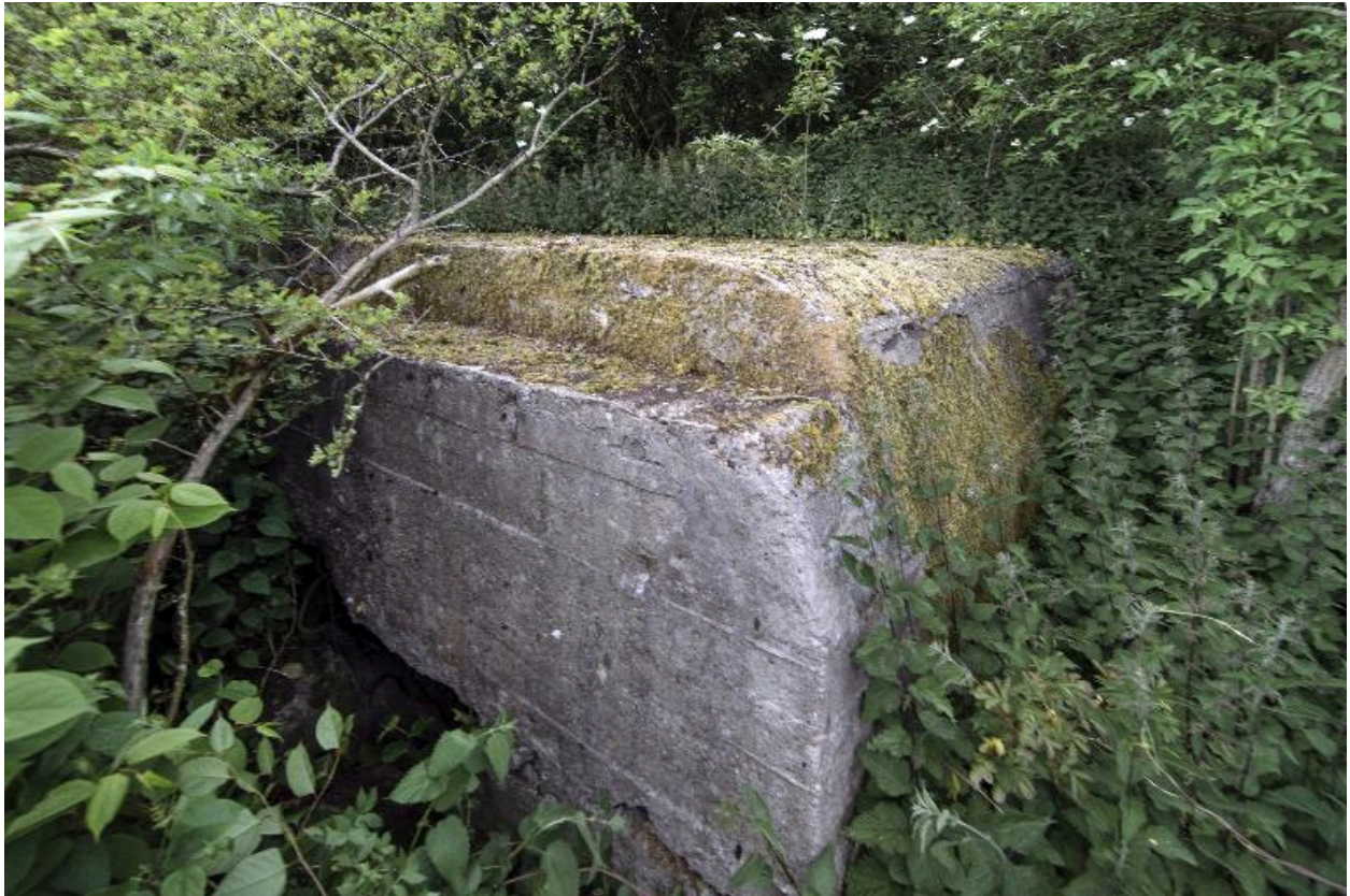
Seule partie visible de l'édifice. Le couverture, vers le nord-ouest