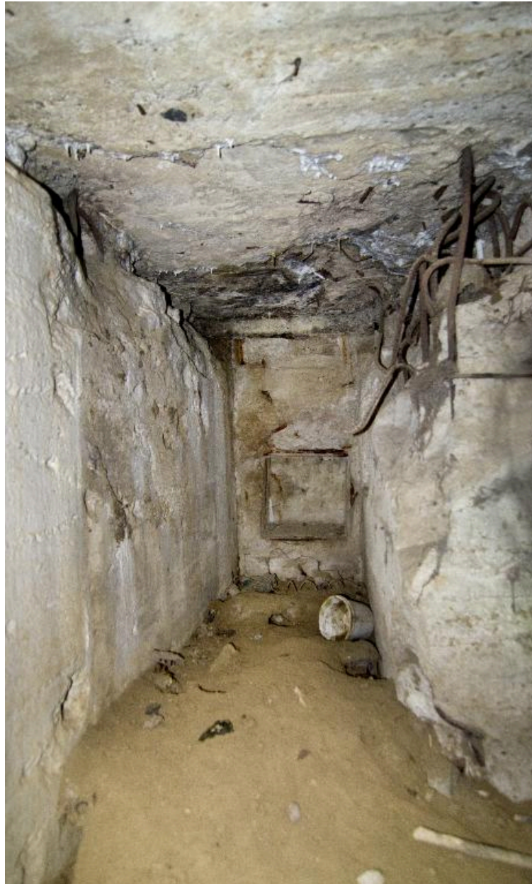
La coursière de tir en enfilade. Dans le fond, la niche à munitions