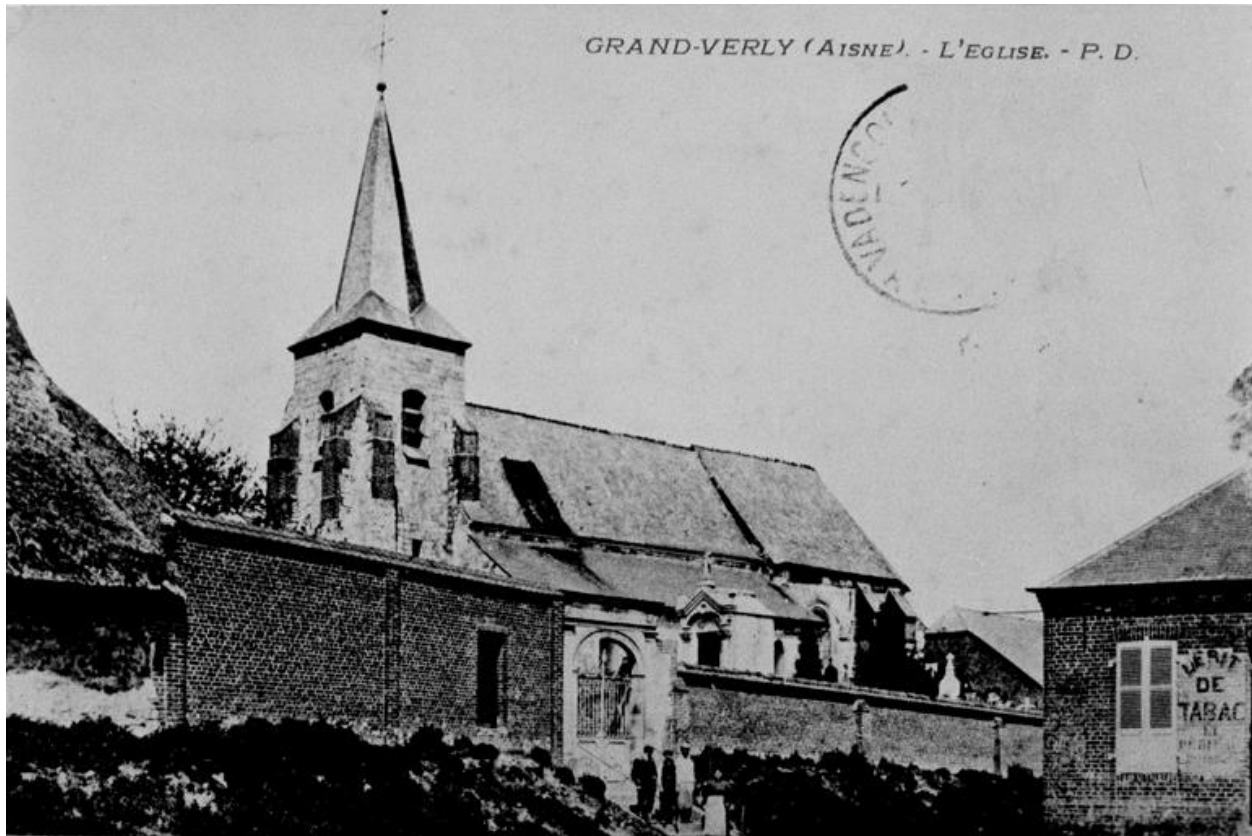
Carte postale ancienne : vue générale de l'église, avant 1914.