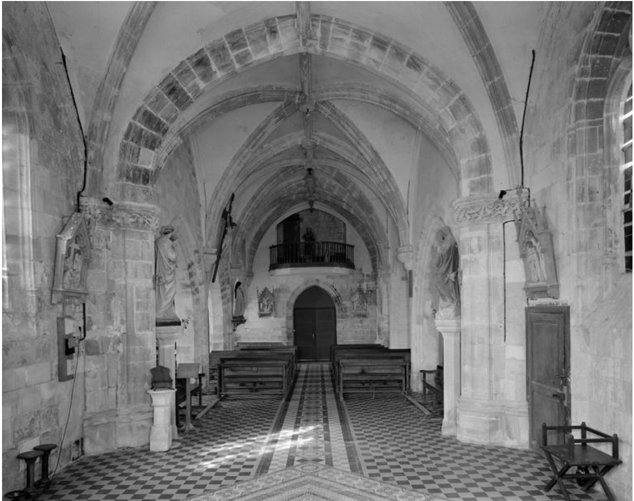
Vue intérieure de la nef, depuis le chœur vers l'entrée.