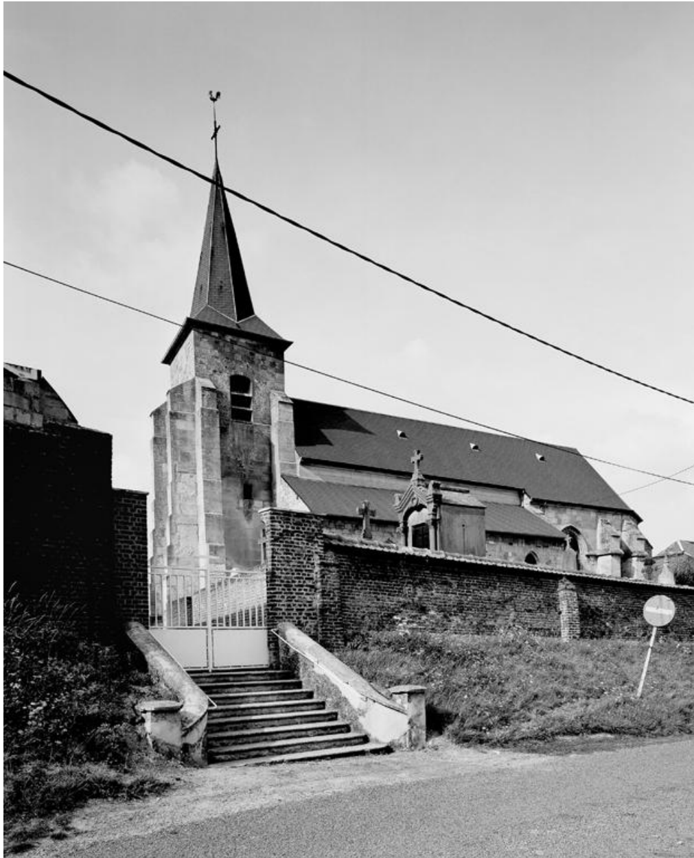
Vue d'ensemble de l'église et du cimetière, depuis le sud-ouest.