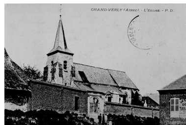
Carte postale ancienne : vue générale de l'église, avant 1914.

IVR22_19910201422V