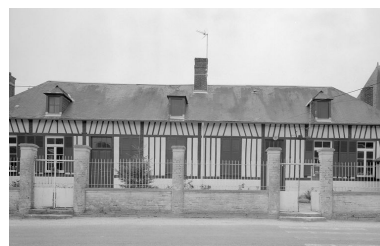
Élévation antérieure. IVR22_19846001063X