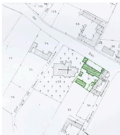
Plan de situation. Extrait du plan cadastral de 1978, section AC 31.