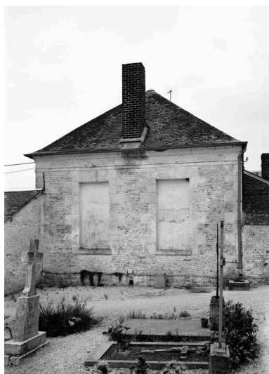
Pignon est. IVR22_19846001061X