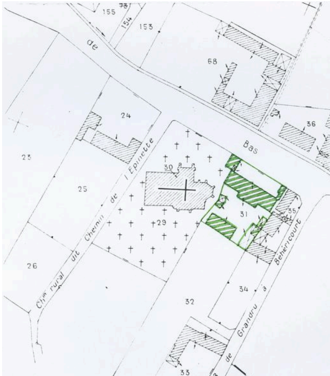
Plan de situation. Extrait du plan cadastral de 1978, section AC 31.