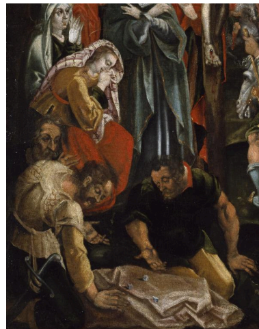
Détail du tableau : sainte Marie-Madeleine pleurant, et les bourreaux jouant aux dés les vêtements du Christ.