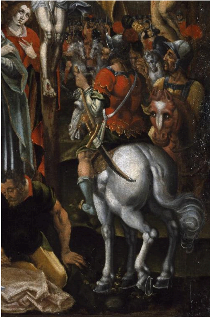
Détail du tableau : un officier romain à cheval.