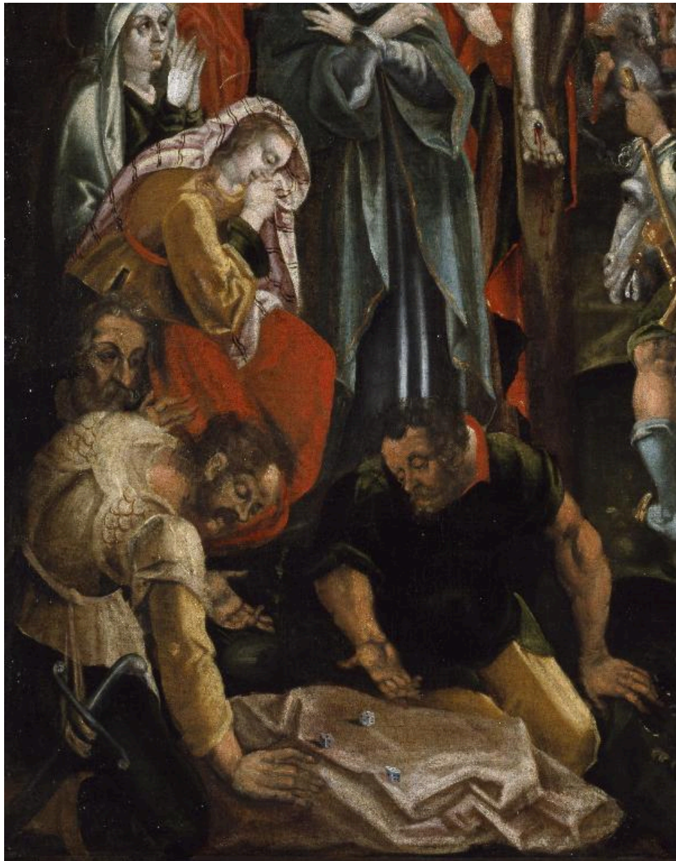
Détail du tableau : sainte Marie-Madeleine pleurant, et les bourreaux jouant aux dés les vêtements du Christ.