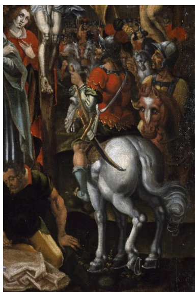
Détail du tableau : un officier romain à cheval. IVR22_20010202198ZA