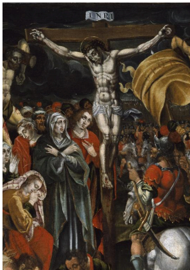
Détail du tableau : le Christ mort sur la croix.