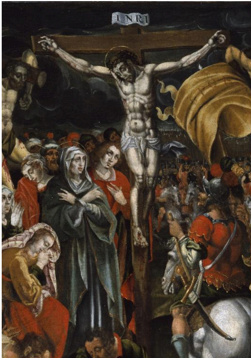
Détail du tableau : le Christ mort sur la croix.