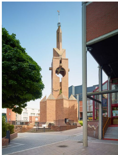
Élévation antérieure vue de trois quart est. IVR31_20155901642NUCA