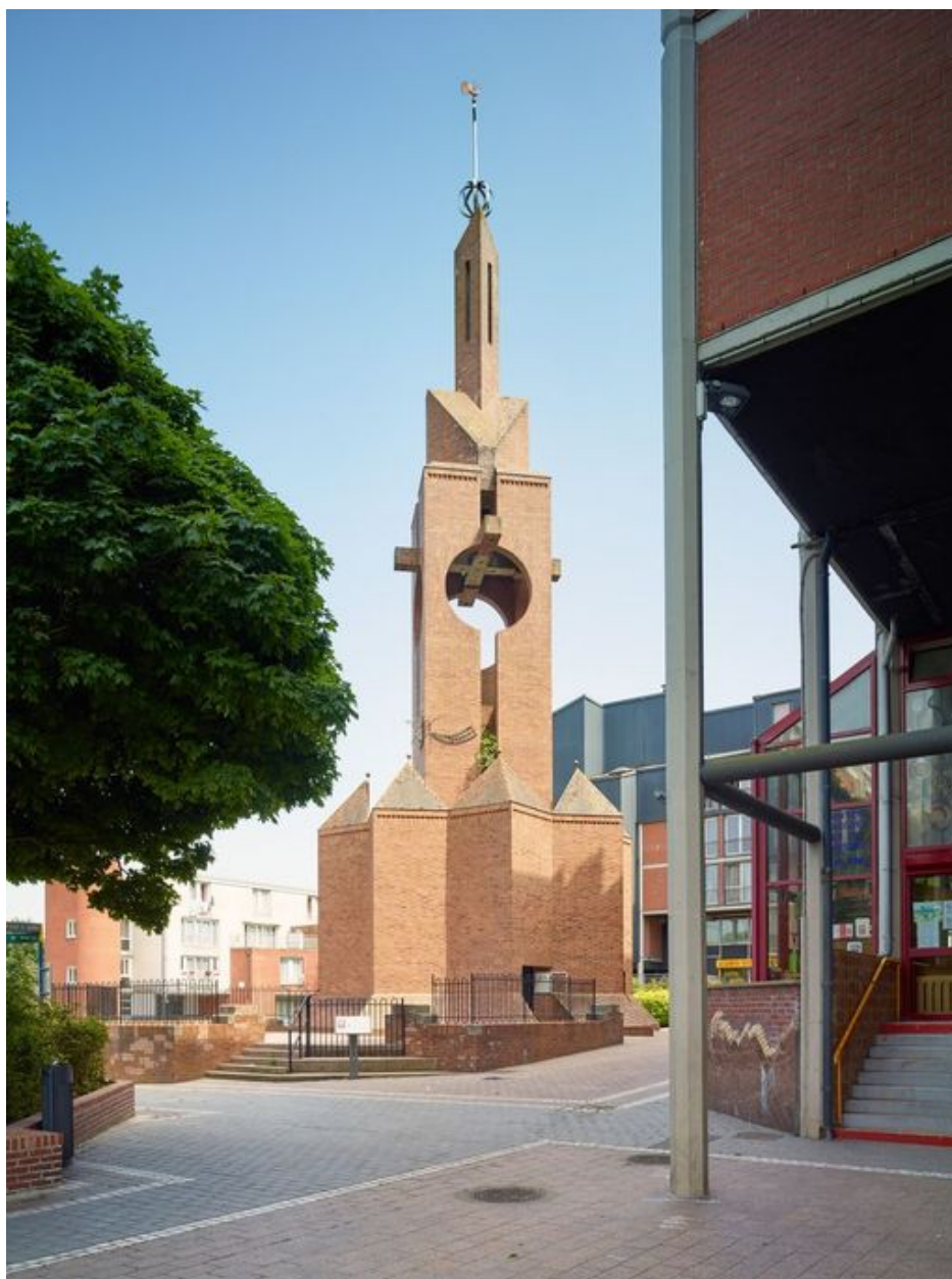
Élévation antérieure vue de trois quart est.