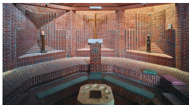
Vue intérieure, autel et gradins.