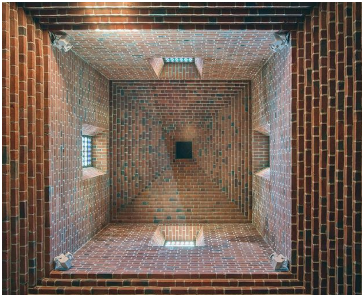
Vue en contre-plongée de l'intérieur du clocher.