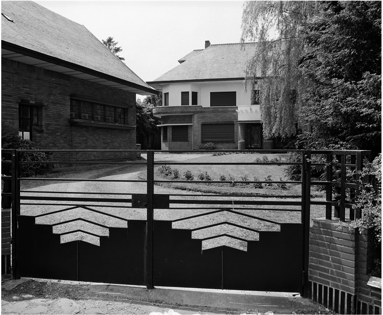
Vue générale de la maison et de la clôture en 1995.