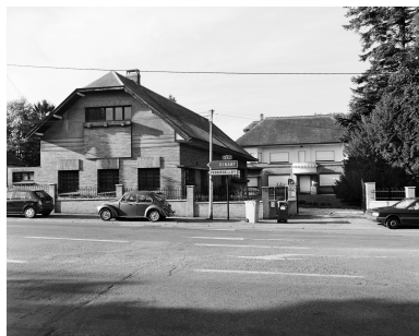
Vue générale. IVR31_20025902328X