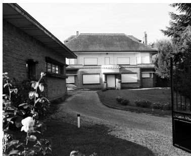
Élévation antérieure de la maison.