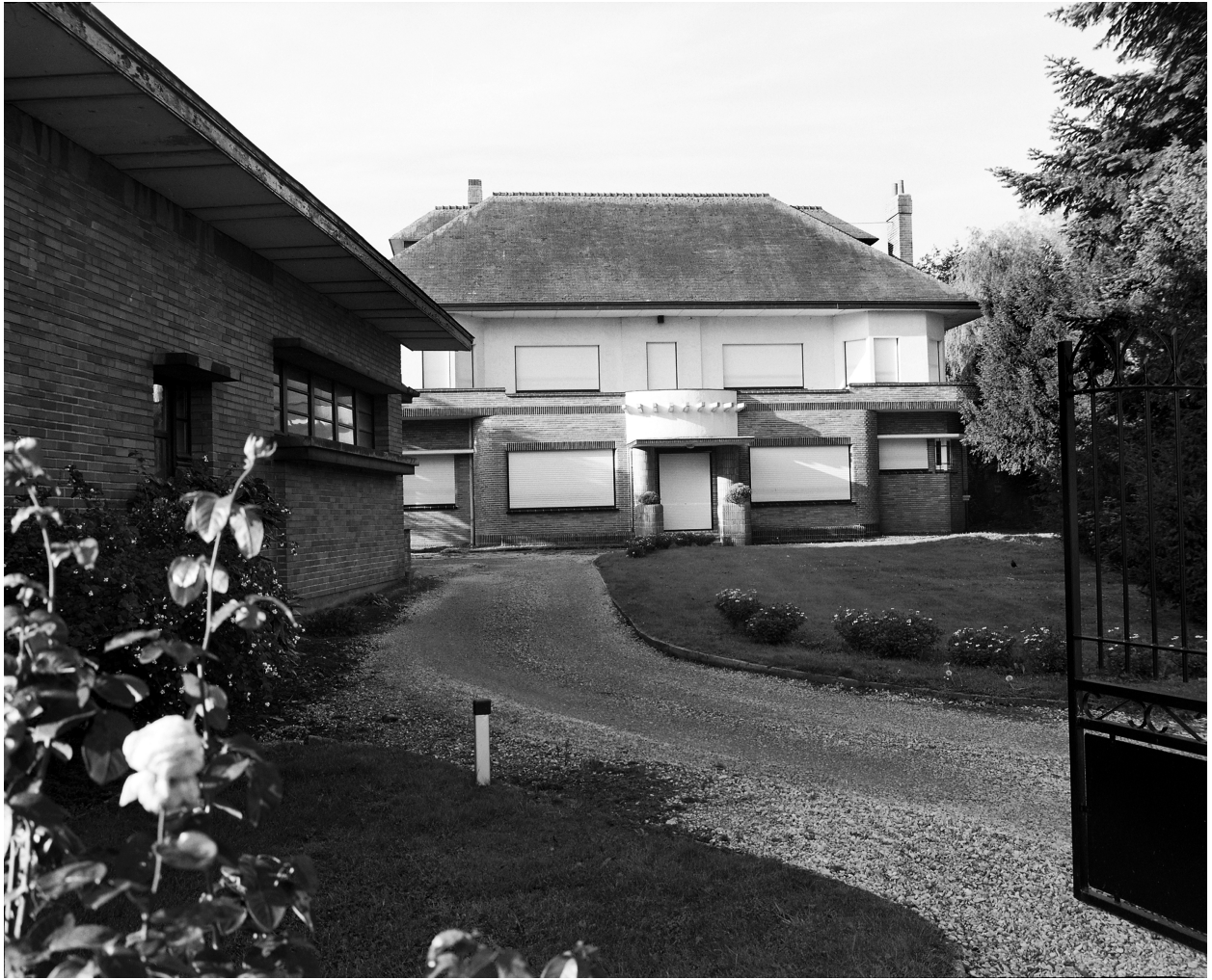
Élévation antérieure de la maison.