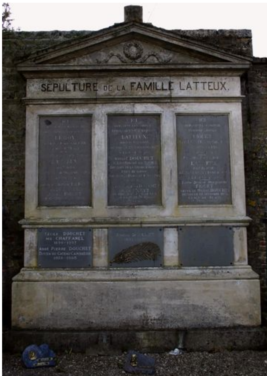
Stèle à entablement et fronton.