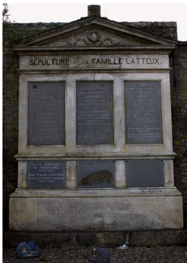
Stèle à entablement et fronton.