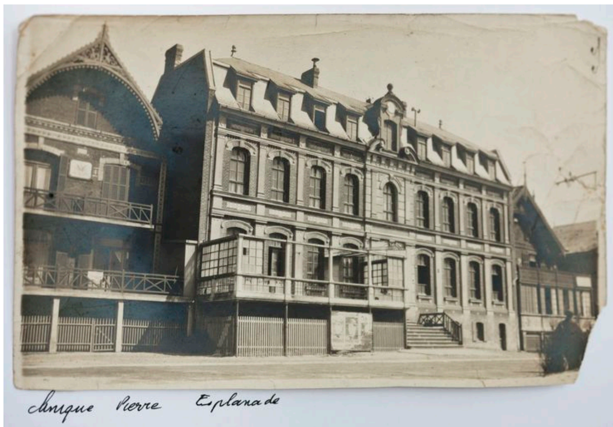
Façade antérieure donnant sur l'esplanade, vue générale prise de trois-quarts gauche. Carte postale, début 20e siècle (coll. part.).