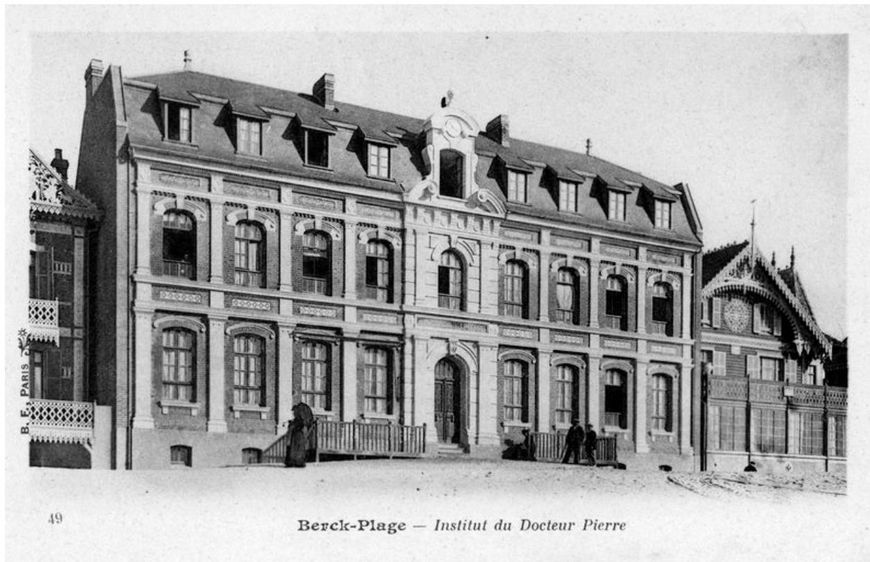
Elévation antérieure donnant sur la plage, vue générale prise de trois-quarts gauche. Carte postale, début 20e siècle (coll. part.).