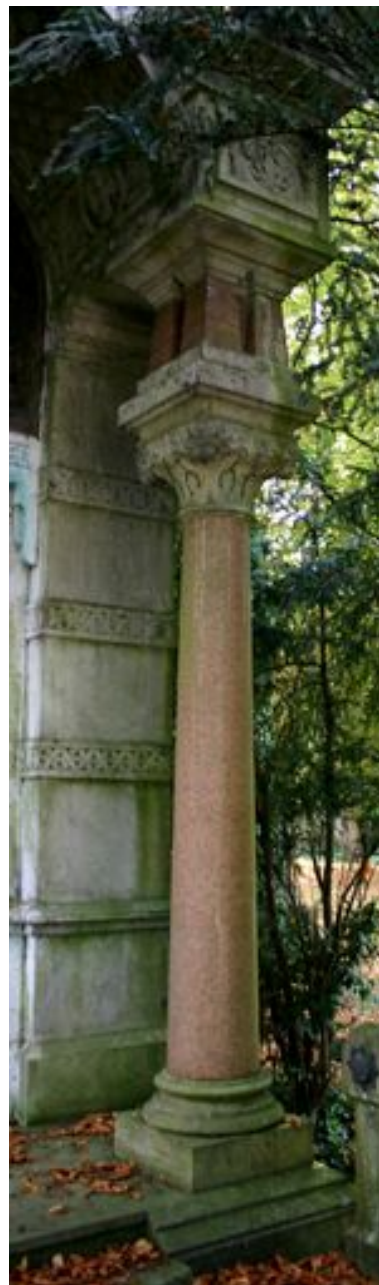
Colonne du tombeau- monument, côté droit.