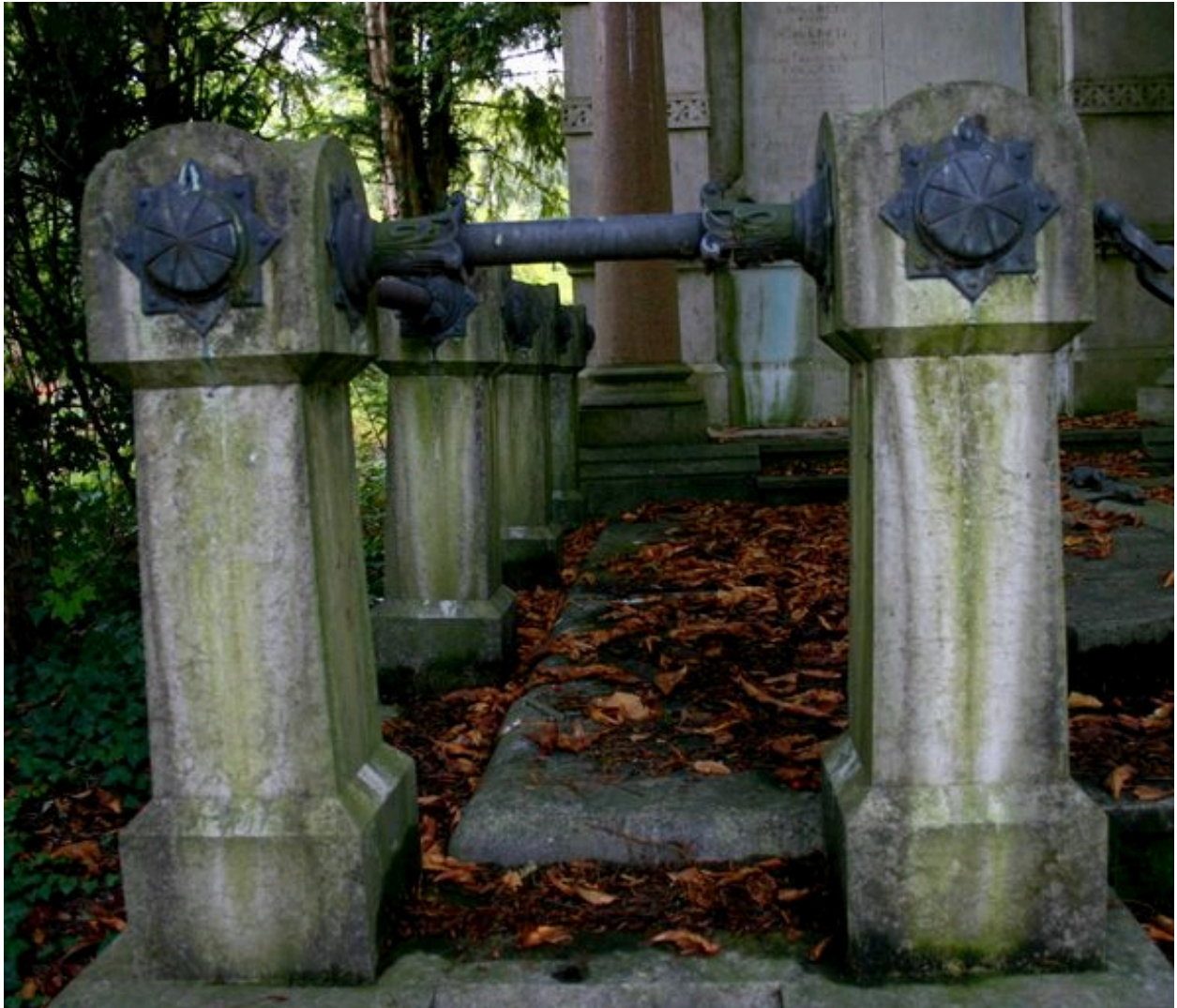
Détail des poteaux de clôture.