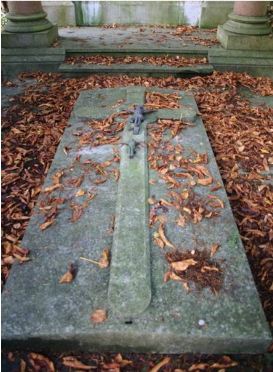
Dalle fermant l'entrée du caveau.