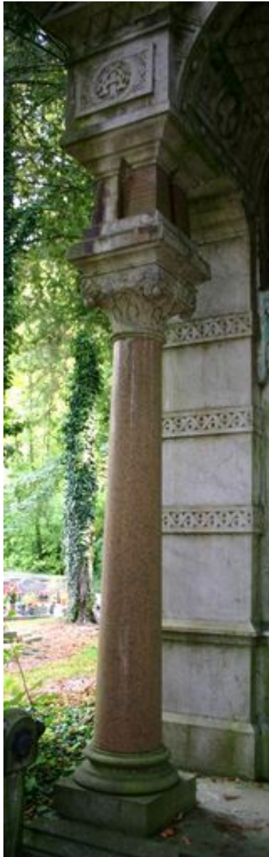
Colonne du tombeau-monument, côté gauche.