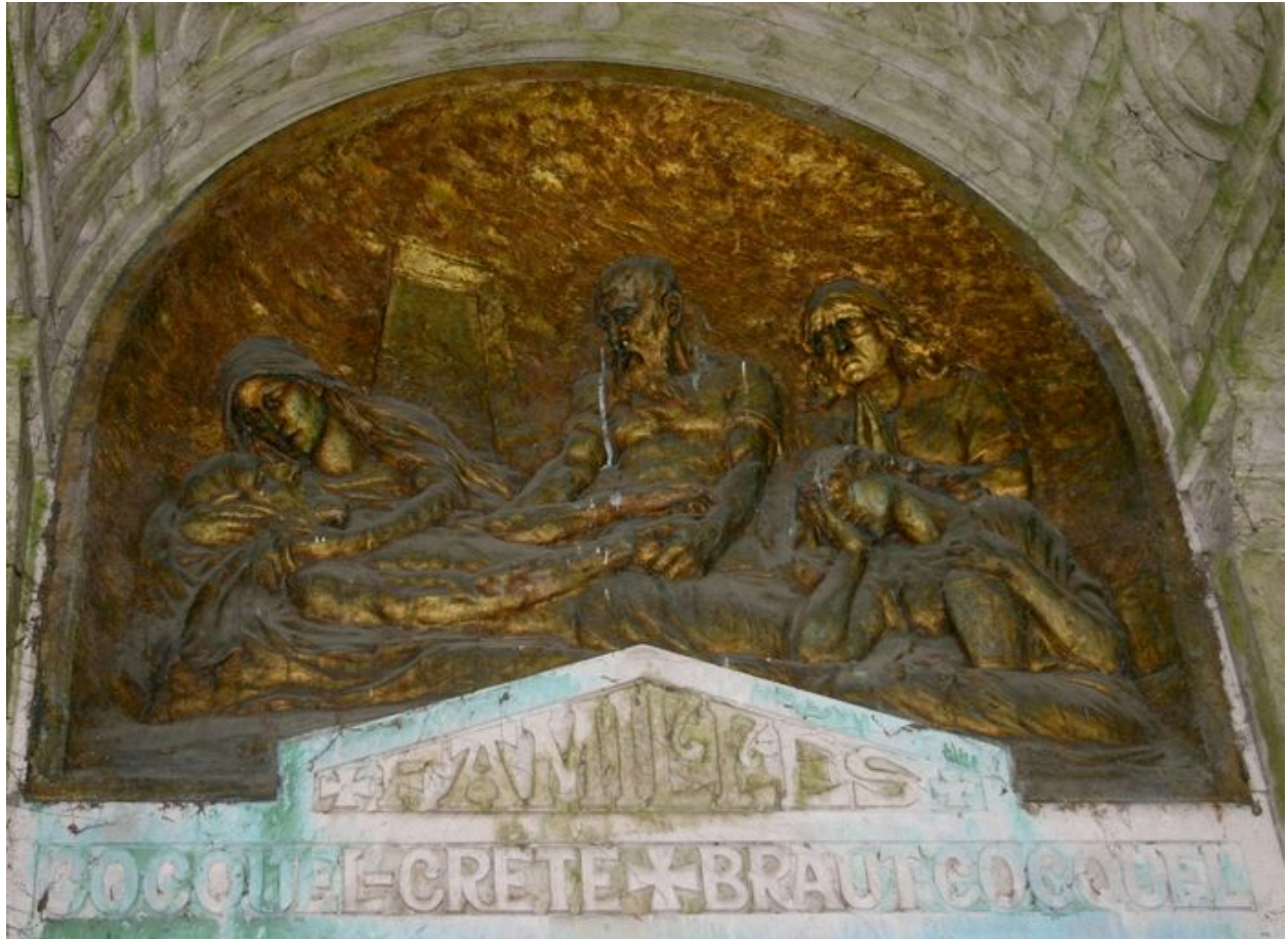
Haut-relief, attribué à Albert Roze.