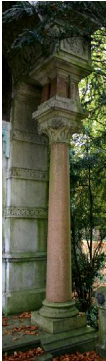
Colonne du tombeau-monument, côté droit.