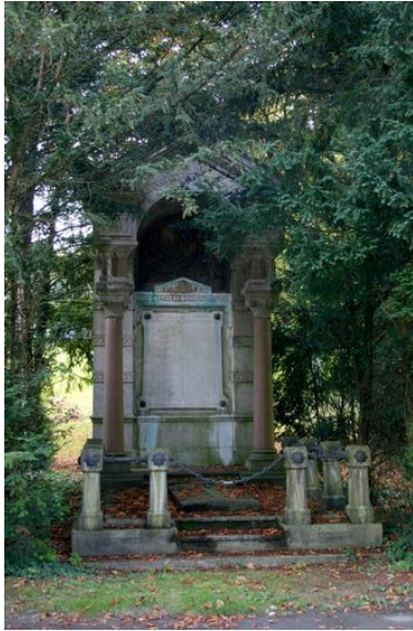
Vue générale. IVR22_20078001185NUCA