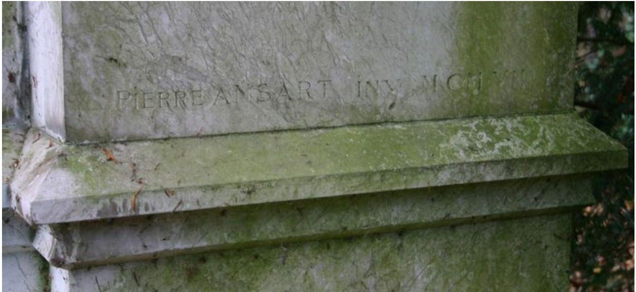
Signature de l'architecte Pierre Ansart (au bas du pilastre droit) et date M CM VII.