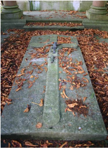
Dalle fermant l'entrée du caveau. IVR22_20078001194NUCA