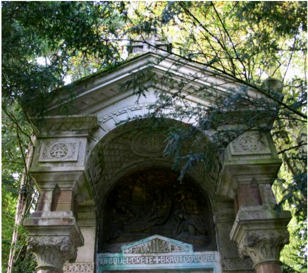
Détail du fronton du tombeau-monument.