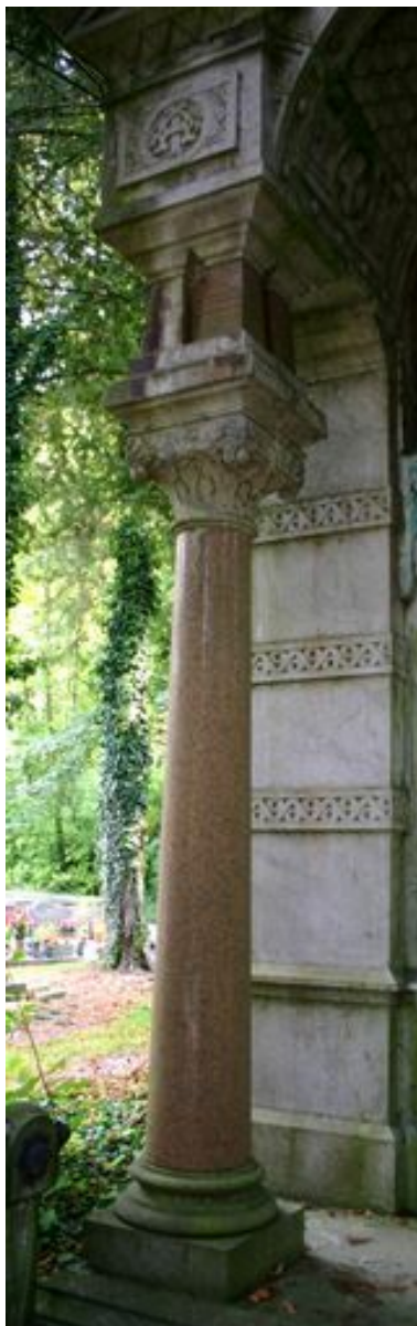
Colonne du tombeau- monument, côté gauche.