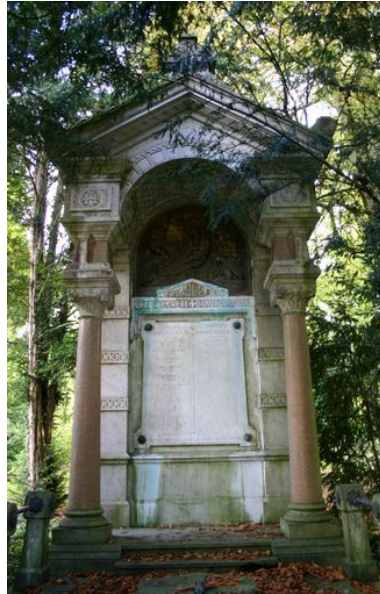
Tombeau-monument.