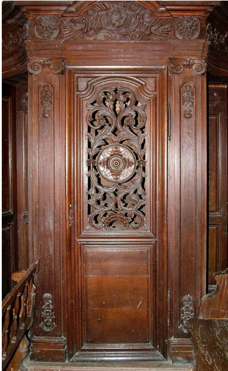
Elévation de la partie centrale.