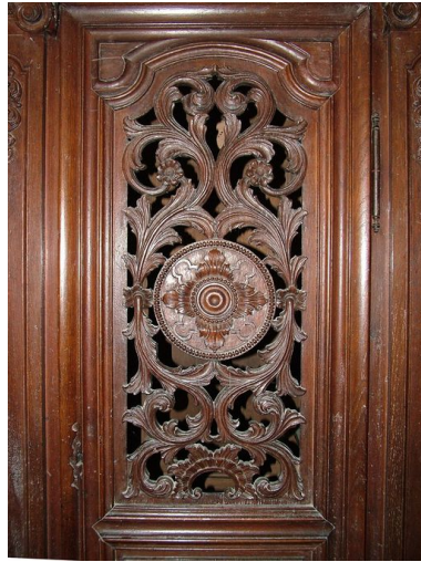
Détail du vantail central ajouré en partie supérieure.