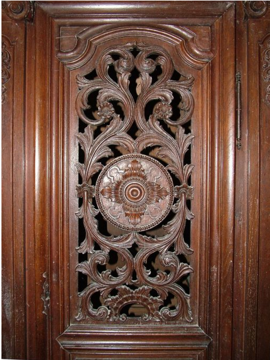
Détail du vantail central ajouré en partie supérieure.