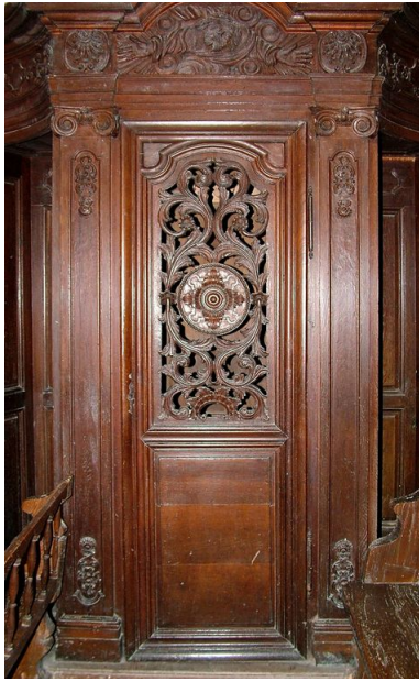
Elévation de la partie centrale.