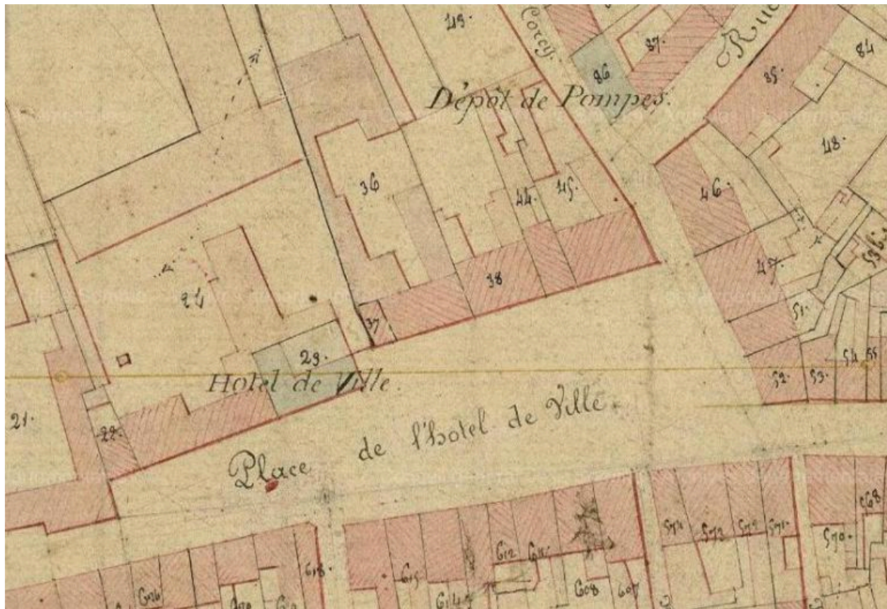
Extrait du cadastre de 1826 (AD Somme).