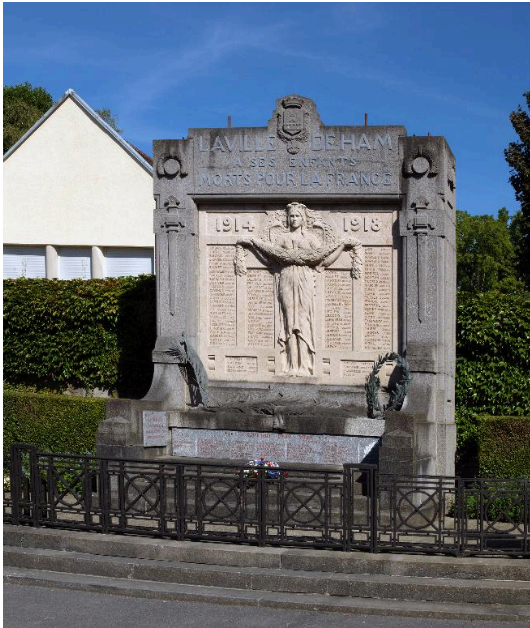
Vue de la stèle.

IVR22_20158000872NUC2A Auteur de l'illustration : Marie-Laure Monnehay-Vulliet (c) Région Hauts-de-France - Inventaire général reproduction soumise à autorisation du titulaire des droits d'exploitation