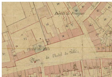
Extrait du cadastre de 1826 (AD Somme).