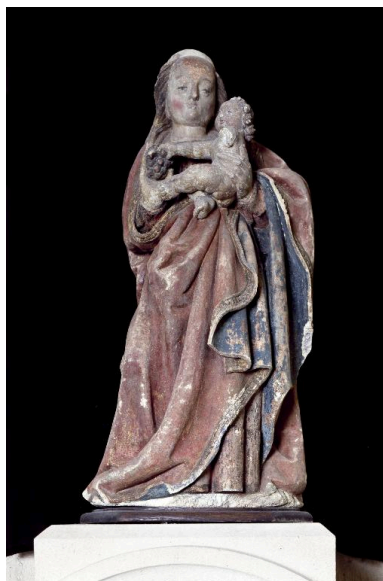
La statue, vue de face. IVR22_19920200504XA