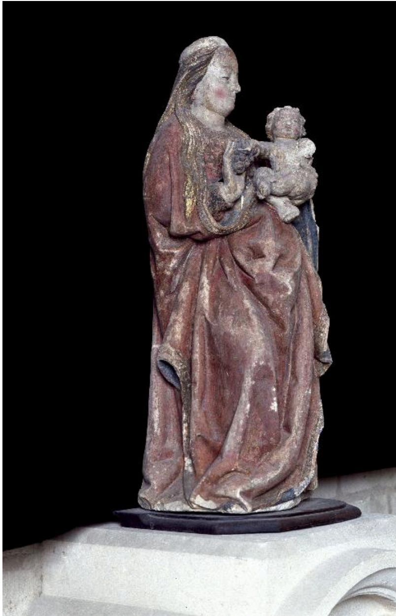
La statue, vue de profil.