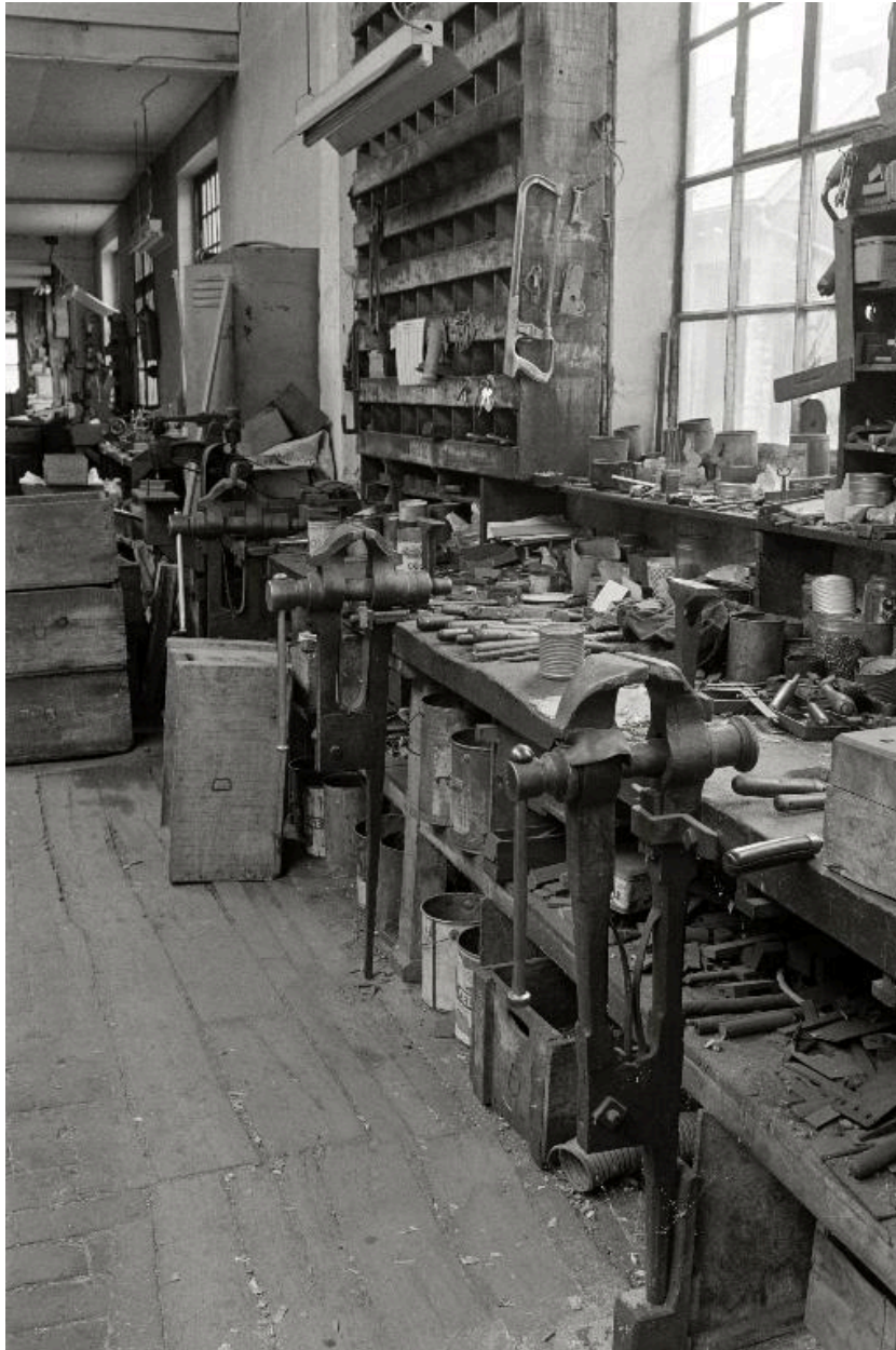
Atelier de fabrication, vue intérieure en 1990.