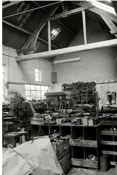
Atelier de fabrication, vue intérieure en 1990.