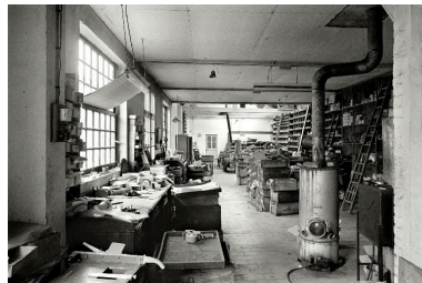
Atelier de fabrication, vue intérieure en 1990.