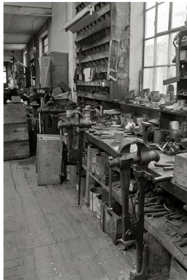
Atelier de fabrication, vue intérieure en 1990. IVR22_19908000095Z