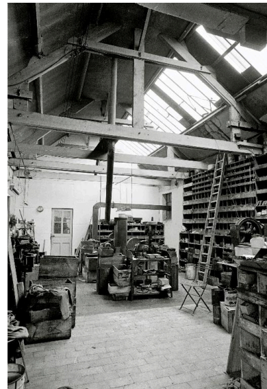
Atelier de fabrication, vue intérieure en 1990.