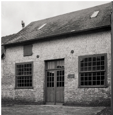
Atelier de fabrication en 1990.