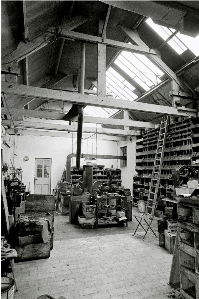
Atelier de fabrication, vue intérieure en 1990.