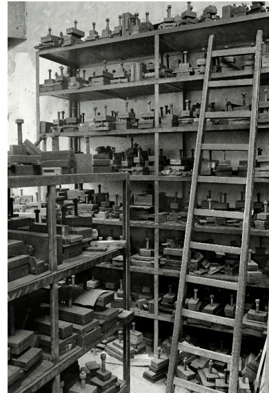
Atelier de fabrication, vue intérieure en 1990. IVR22_19908000093Z