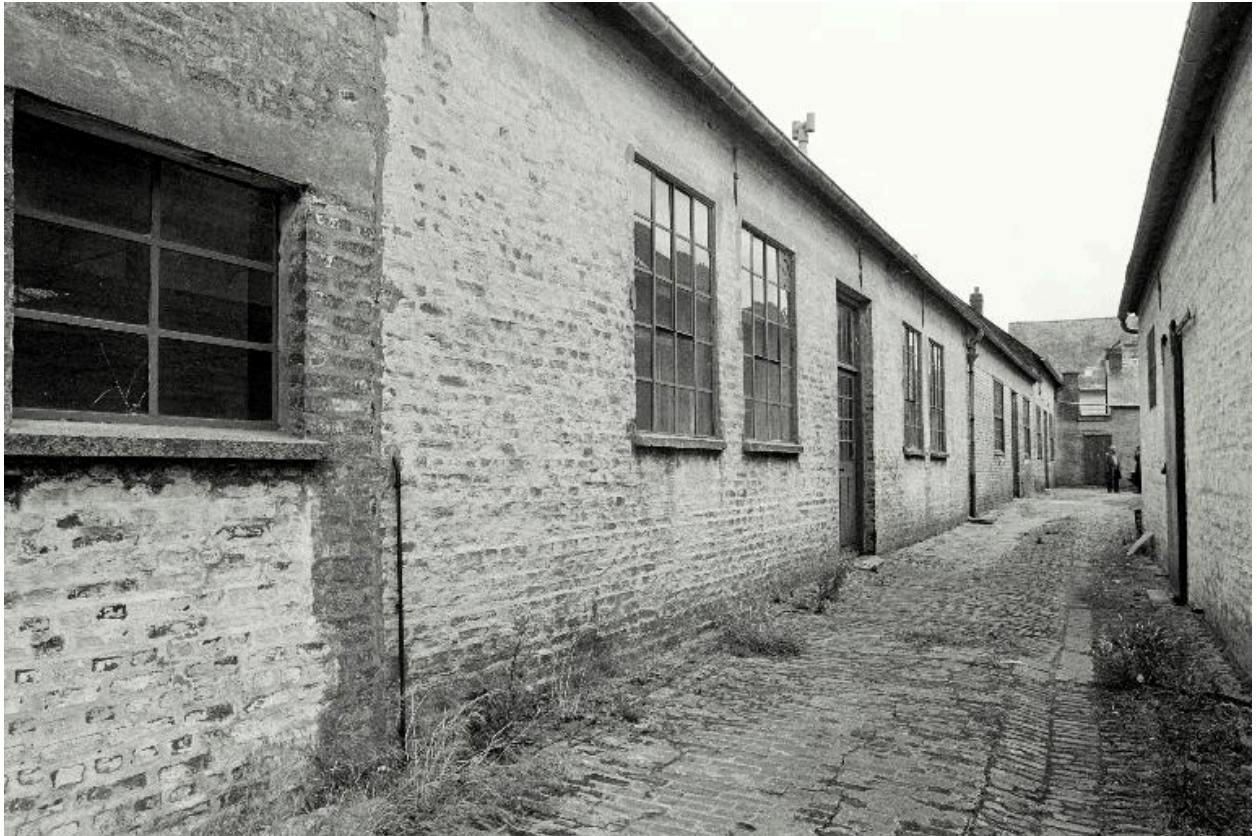
Atelier de fabrication, élévation antérieure en 1990.