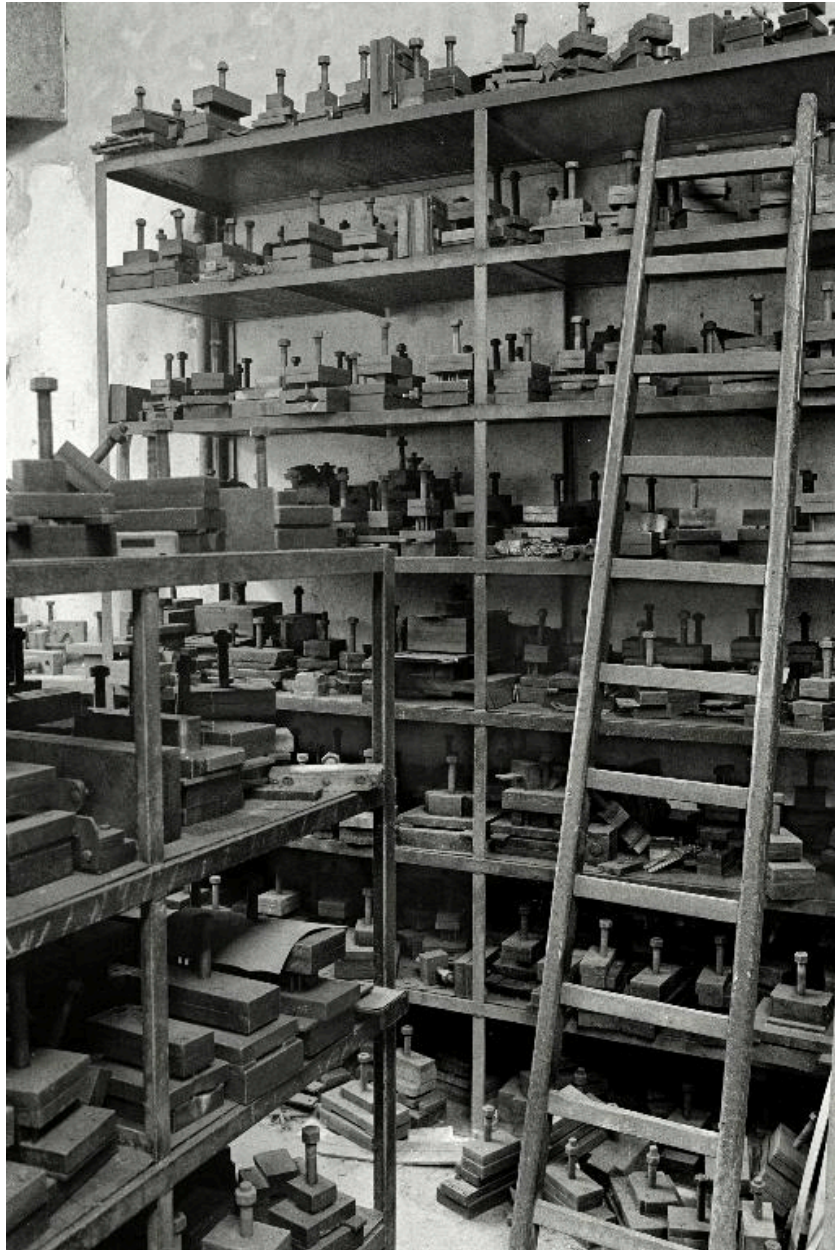
Atelier de fabrication, vue intérieure en 1990.