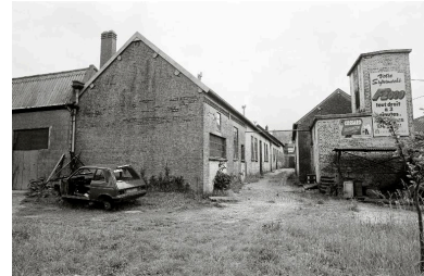
Atelier de fabrication en 1990.