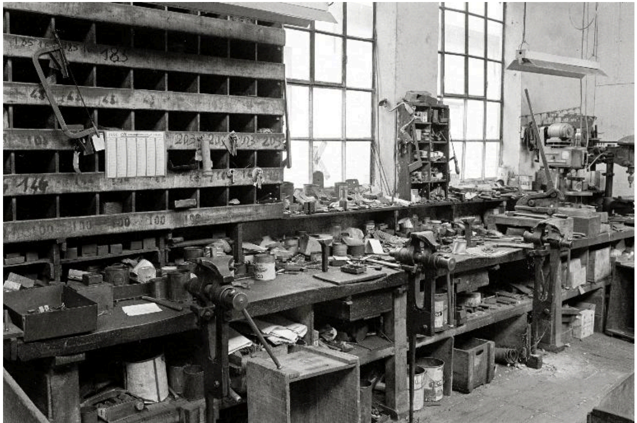
Atelier de fabrication, vue intérieure en 1990.