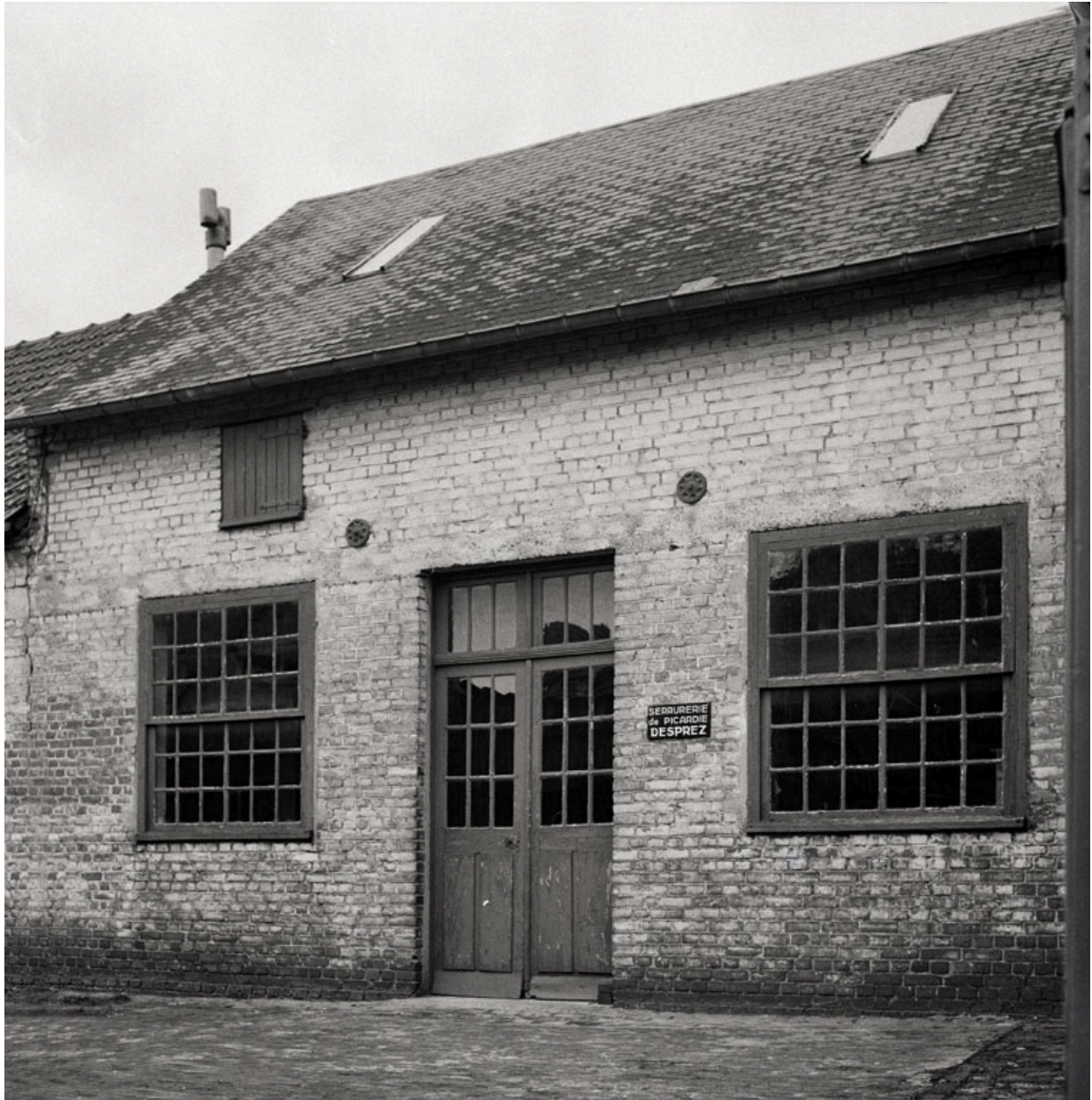
Atelier de fabrication en 1990.