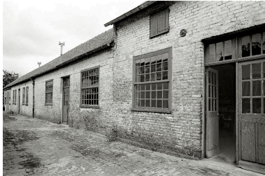
Ateliers de fabrication, élévation antérieure, en 1990.