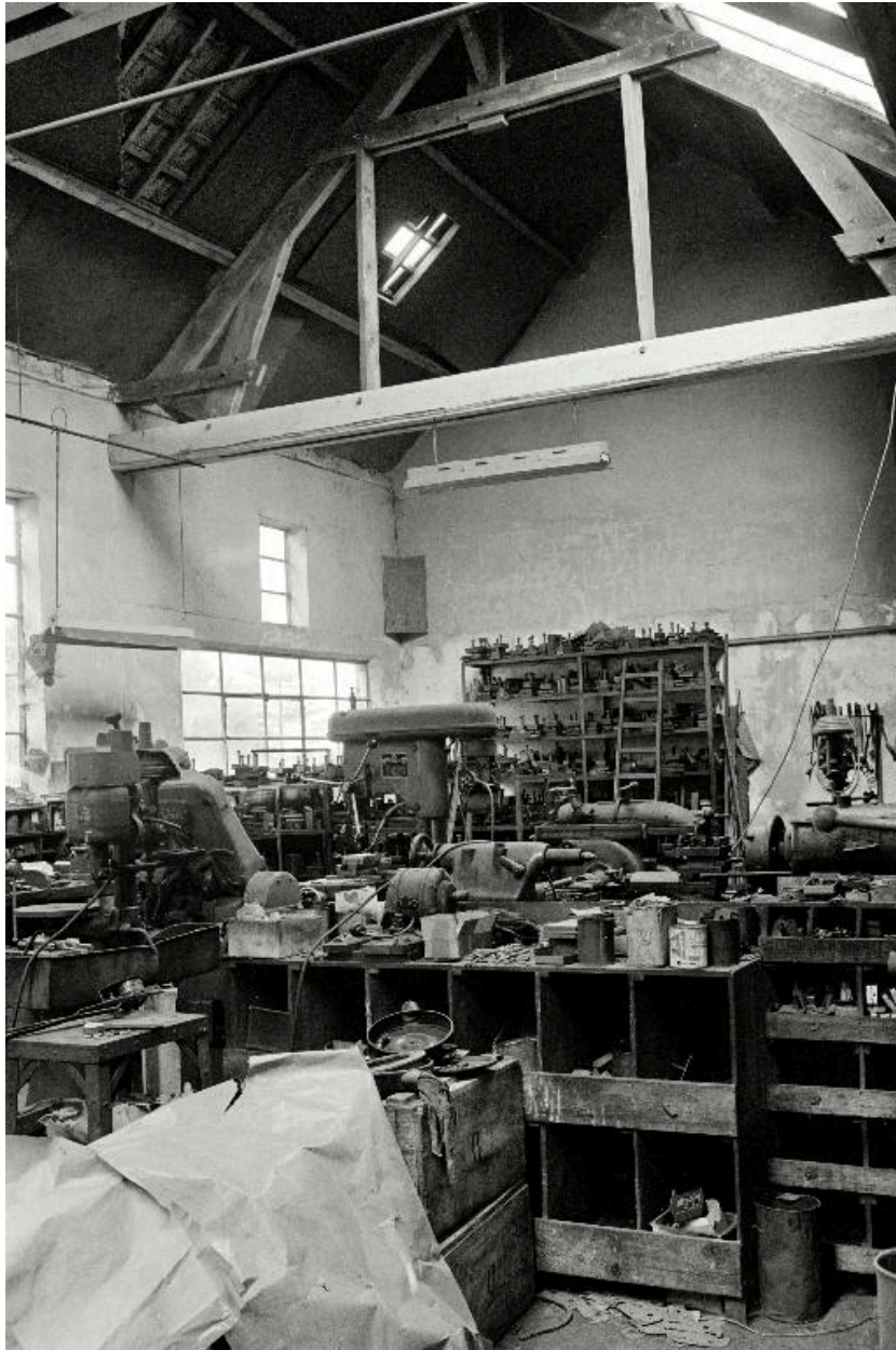
Atelier de fabrication, vue intérieure en 1990.