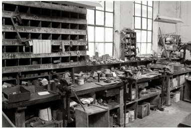
Atelier de fabrication, vue intérieure en 1990. IVR22_19908000091Z