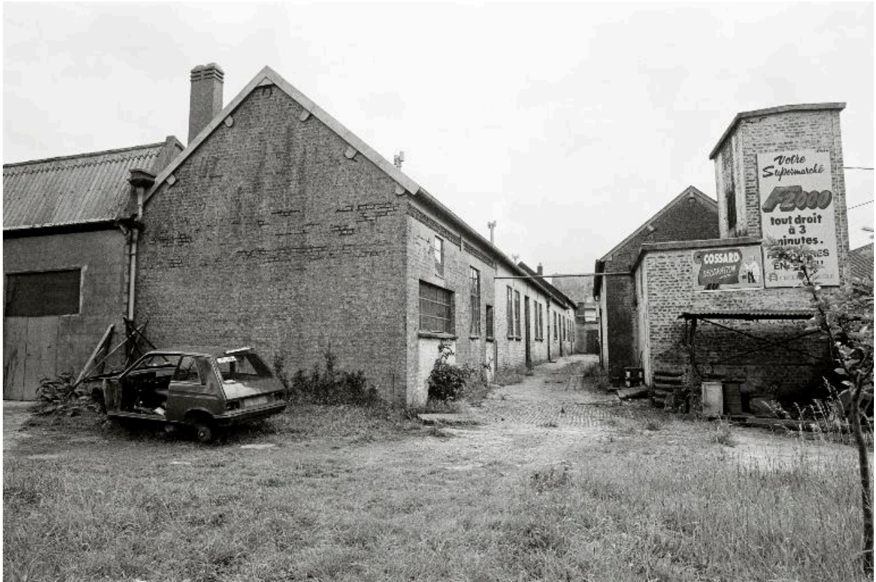
Atelier de fabrication en 1990.