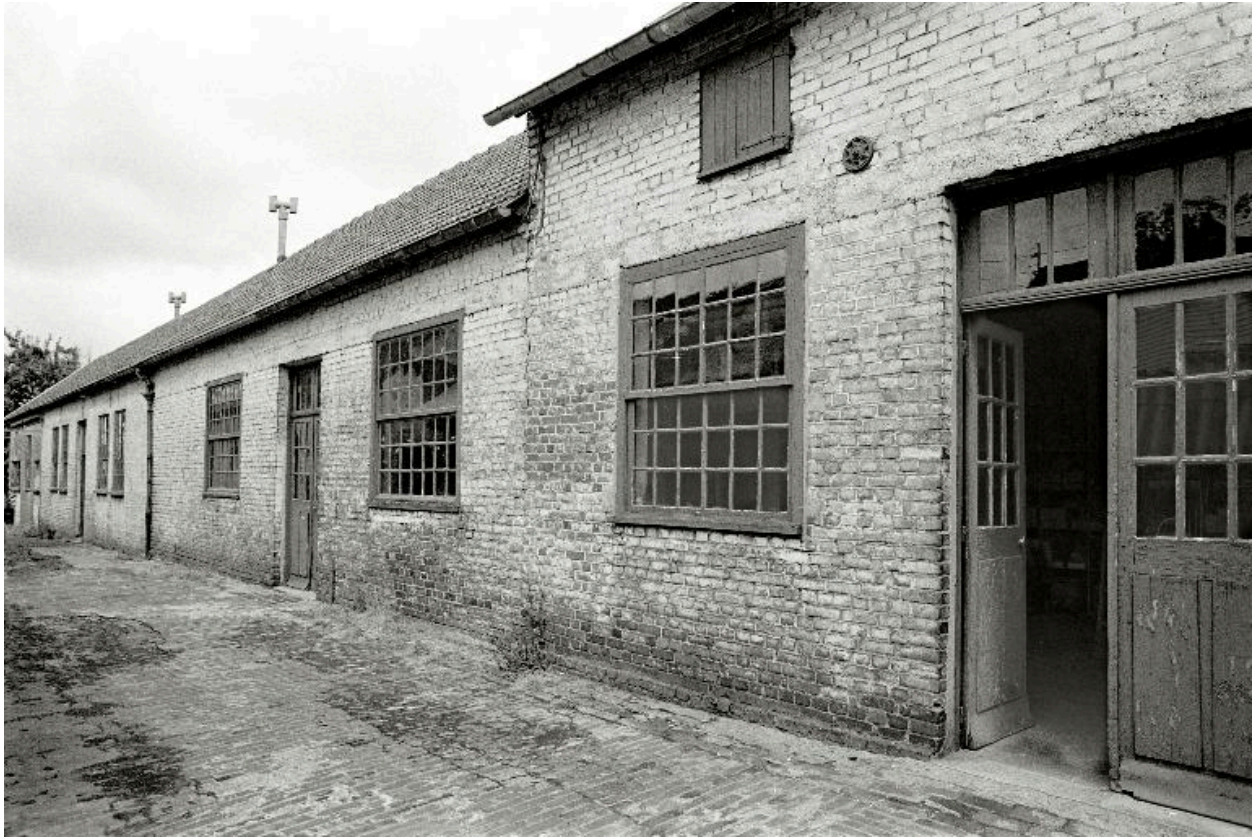
Ateliers de fabrication, élévation antérieure, en 1990.