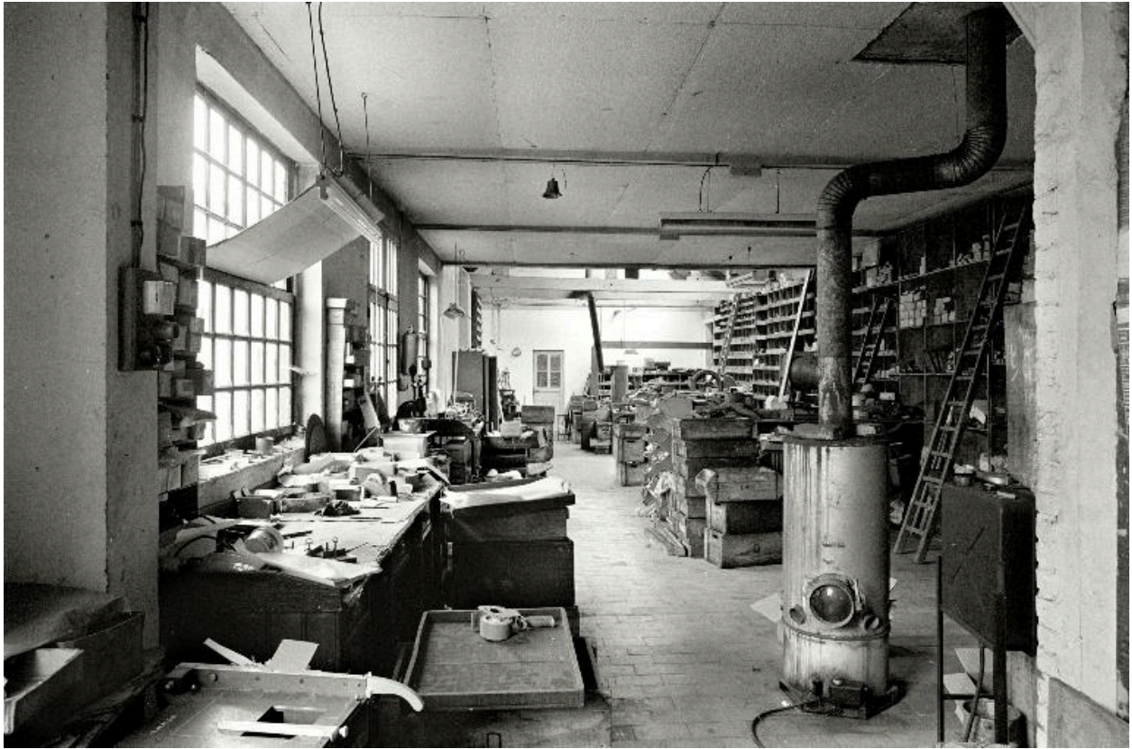
Atelier de fabrication, vue intérieure en 1990.