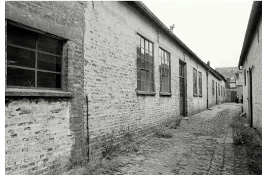
Atelier de fabrication, élévation antérieure en 1990. IVR22_19908000097Z