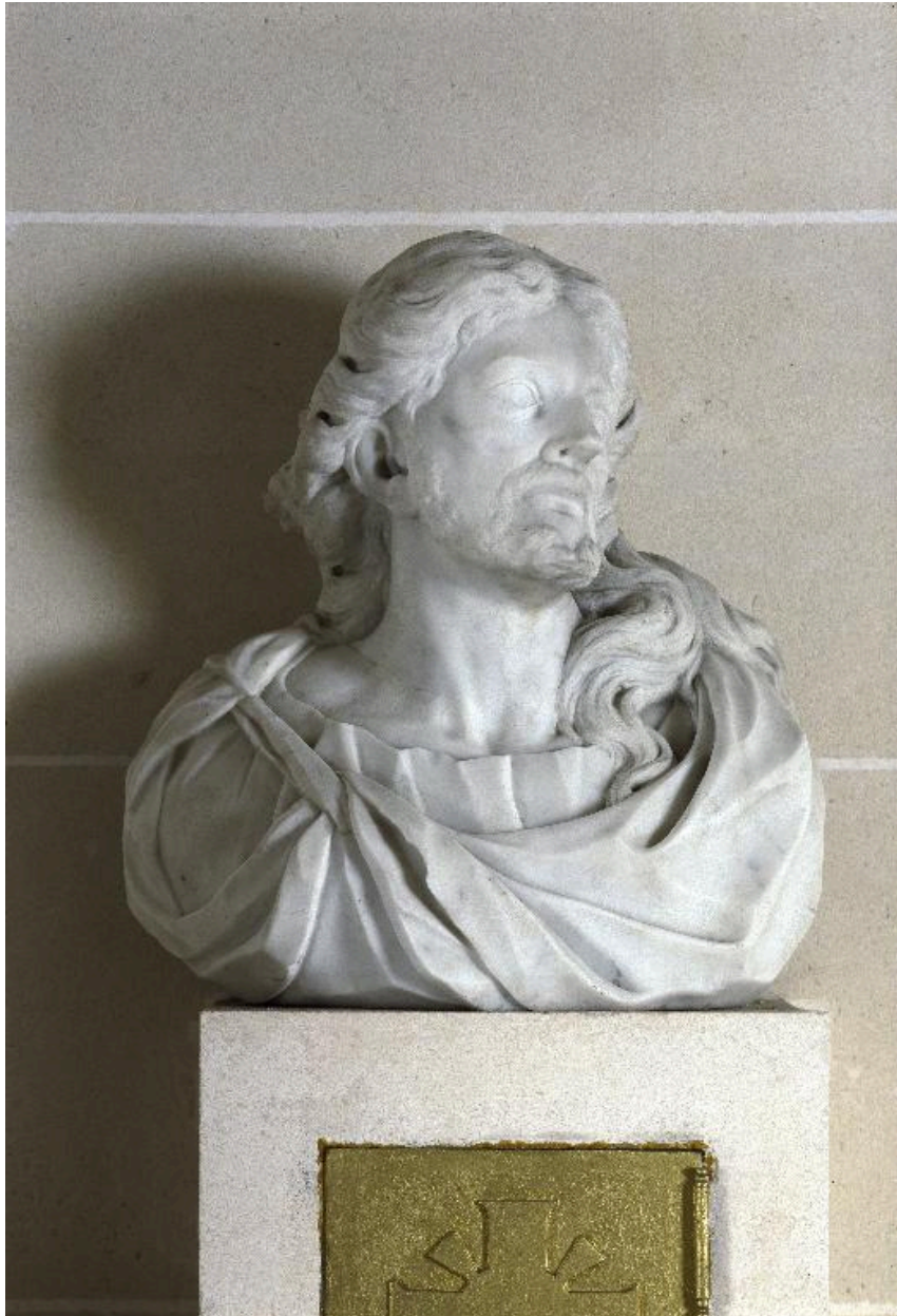
Le buste, vu de face.