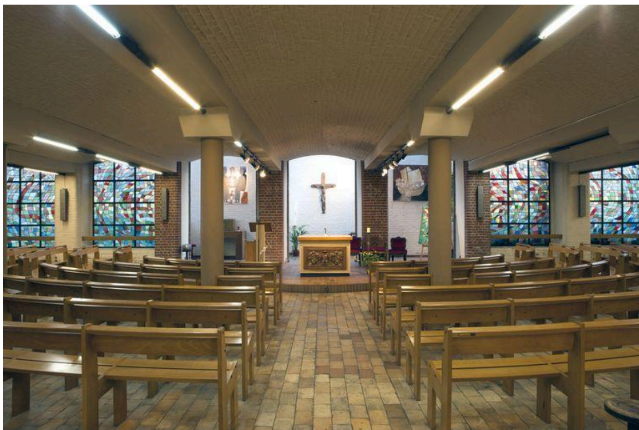
Vue générale vers l'autel.