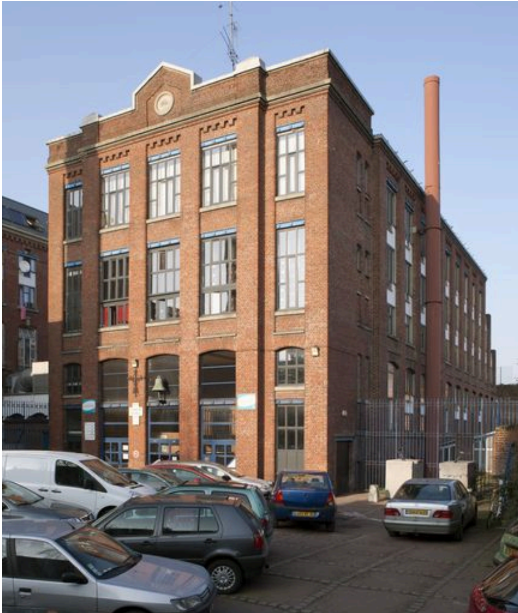
Élévation antérieure et flanc droit.