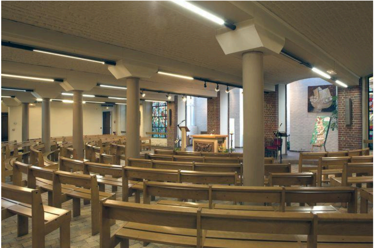
Vue de trois quarts vers l'autel.