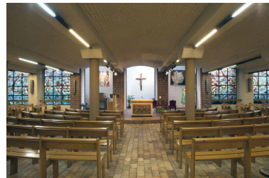
Vue générale vers l'autel.