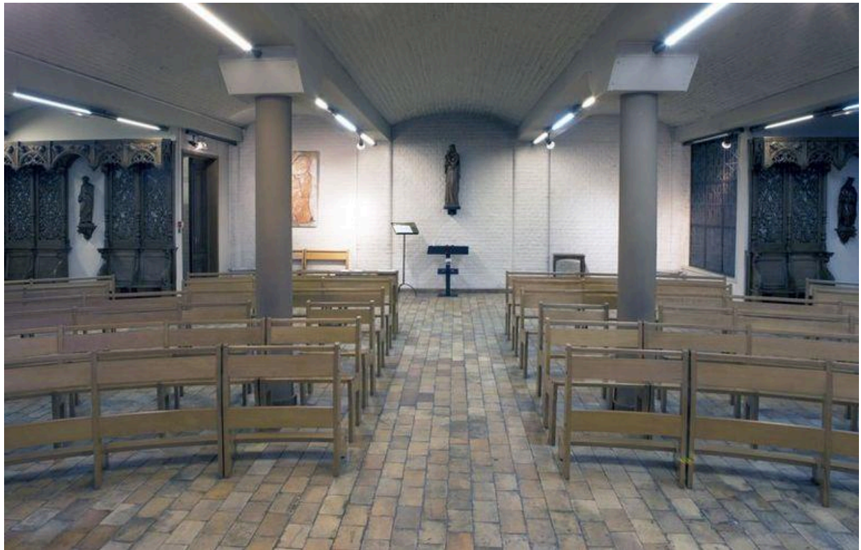
Vue générale depuis l'autel.