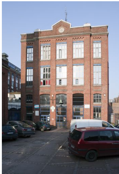
Élévation antérieure. IVR31_20155900643NUCA