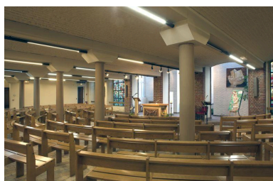
Vue de trois quarts vers l'autel.