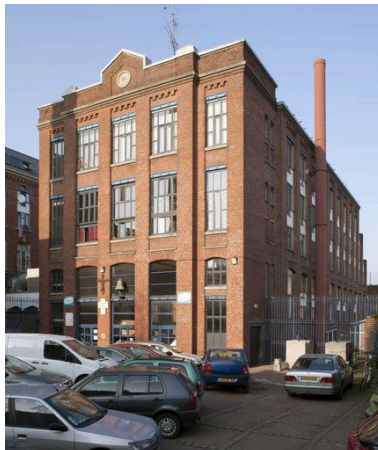
Élévation antérieure et flanc droit. IVR31_20155900644NUCA