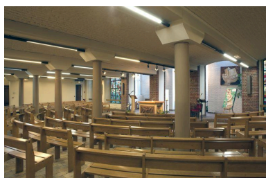
Vue de trois quarts vers l'autel. IVR31_20155900646NUCA