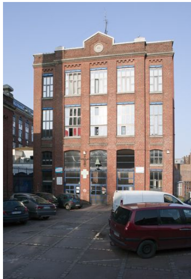
Élévation antérieure. IVR31_20155900643NUCA