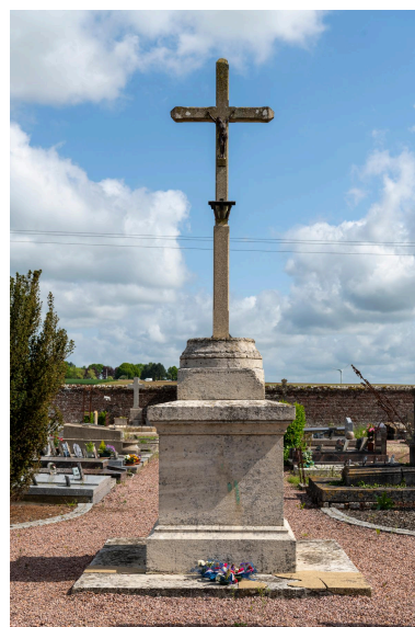
Croix du cimetière réalisée par Bertin à Breteuil.

Phot. Marc Kérignard IVR32_20236000621NUCA