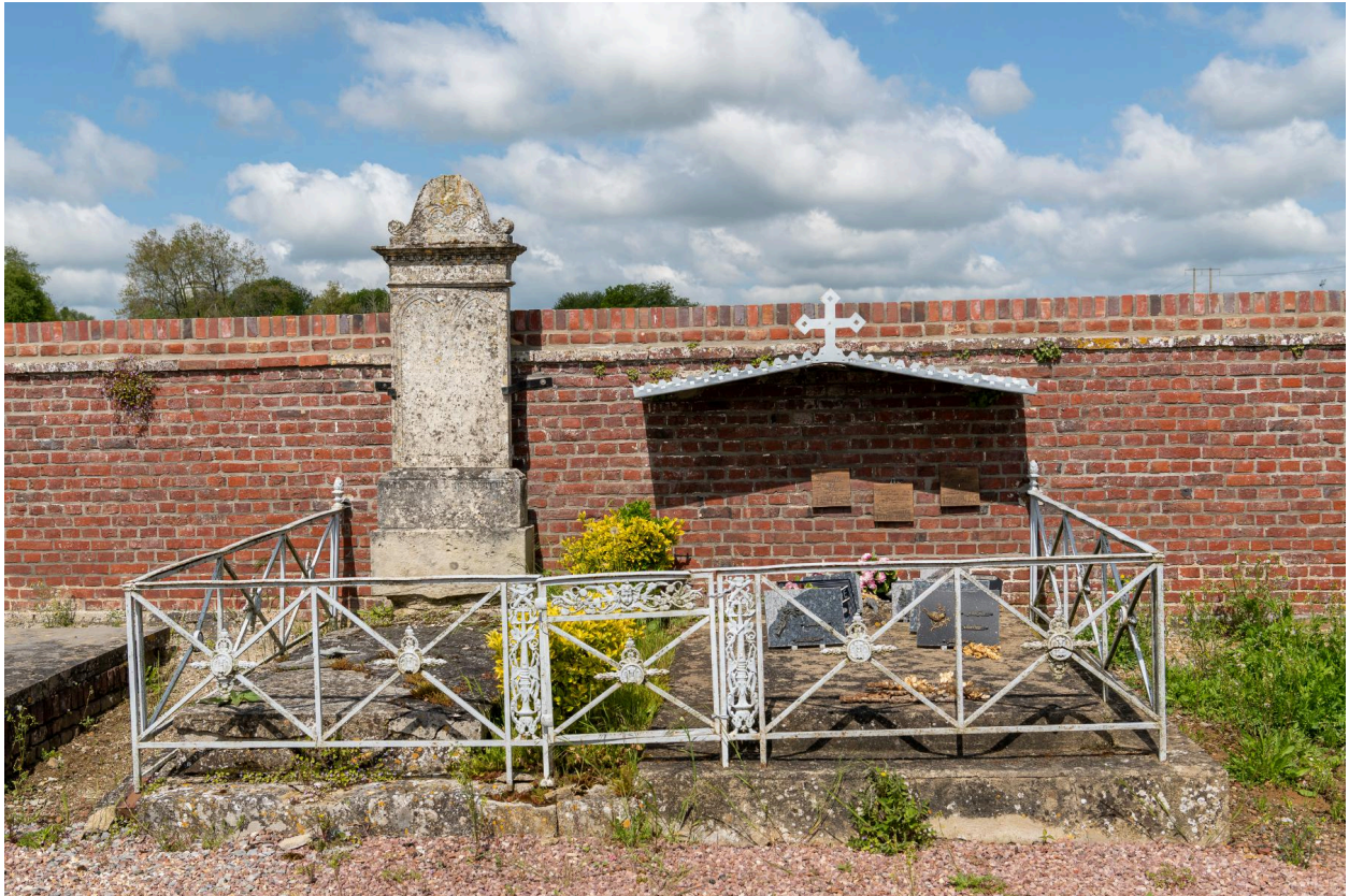
Enclos funéraire avec porte-couronne et stèle.