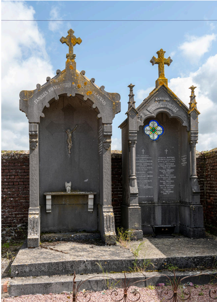
Enclos funéraire avec deux tombeaux en forme de chapelles ouvertes, signé Préjan.