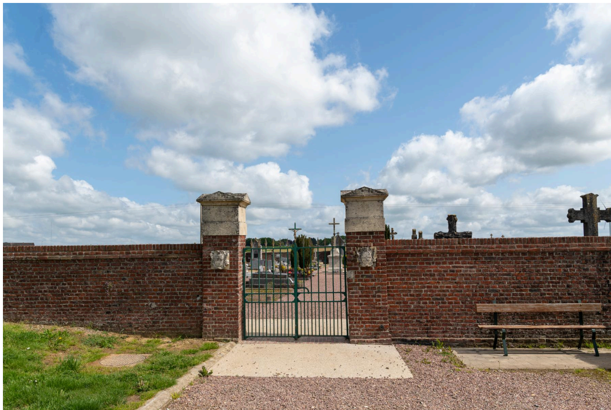
Vue générale de l'entrée du cimetière.