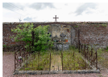
Tombeau avec porte-couronnes et clôture en fer forgé.

Phot. Marc Kérignard IVR32_20236000625NUCA