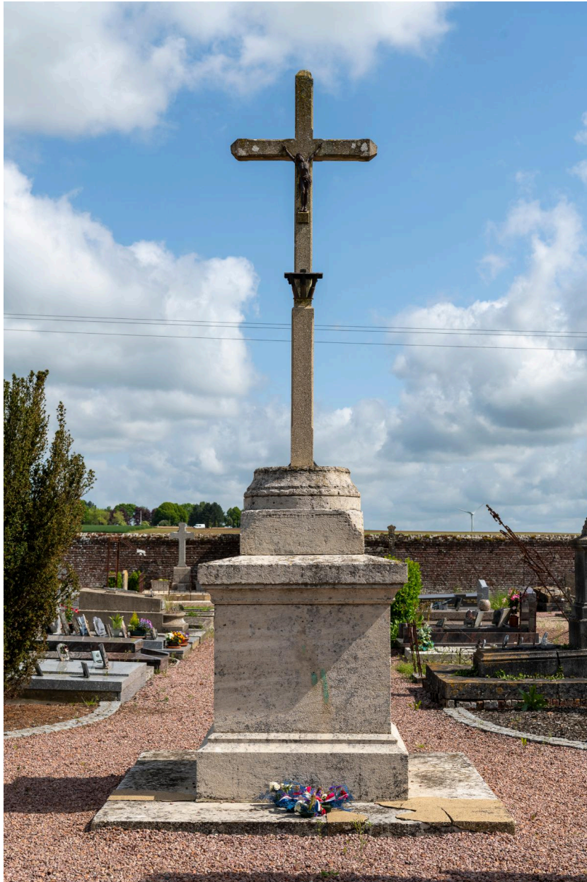
Croix du cimetière réalisée par Bertin à Breteuil.