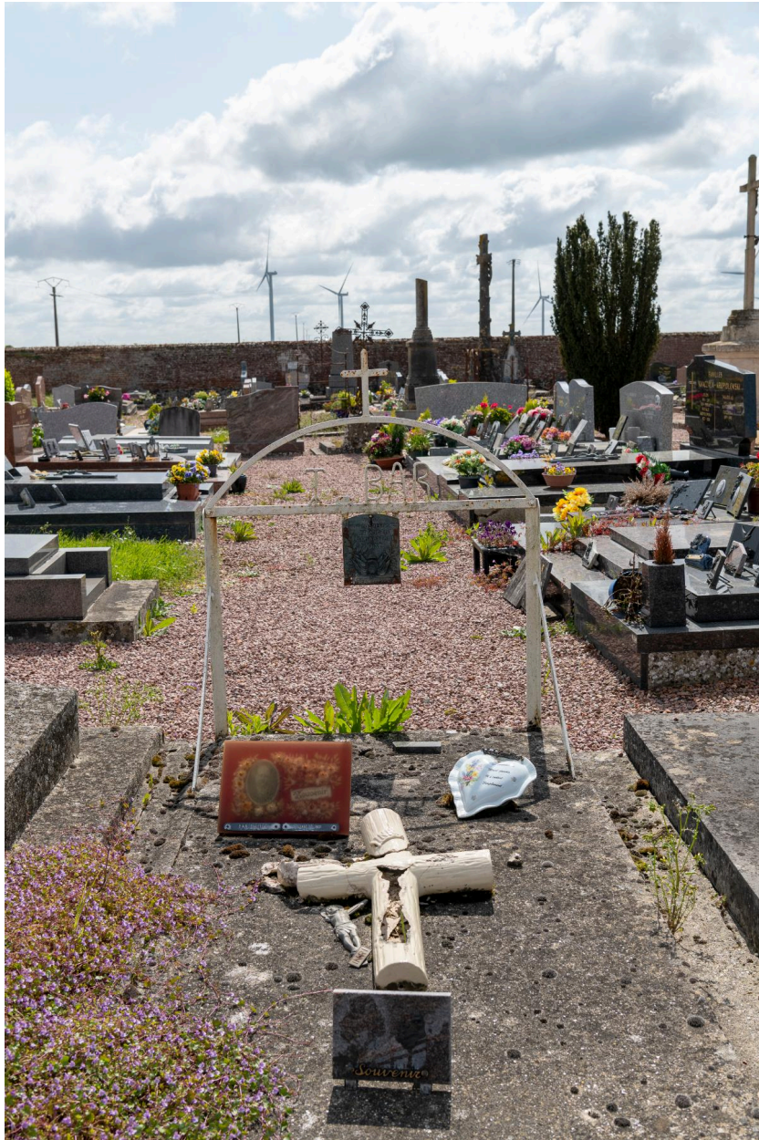
Tombeau de T. Bar, ancien combattant de l'Oise.