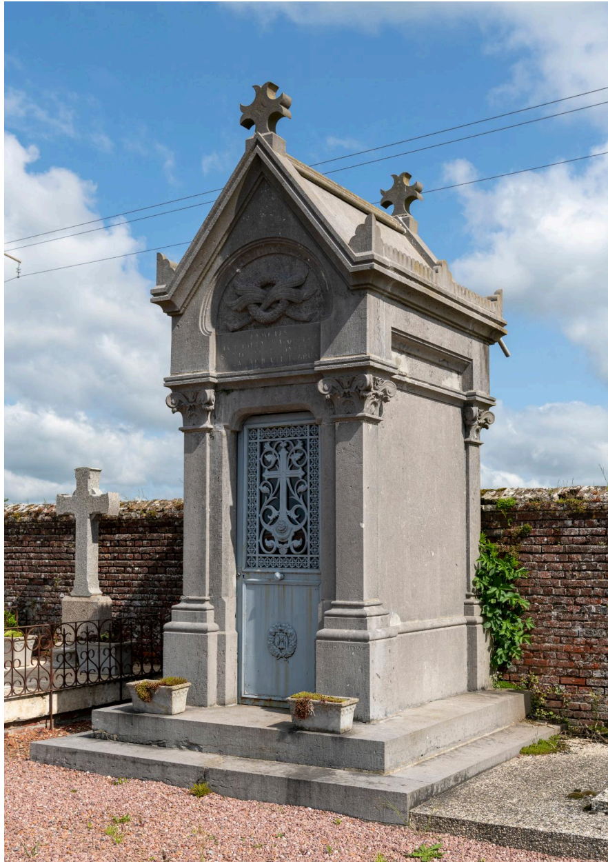
Tombeau en forme de chapelle signé Ollivier à Beauvais.