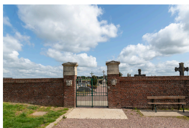
Vue générale de l'entrée du cimetière.

IVR32_20236000620NUCA