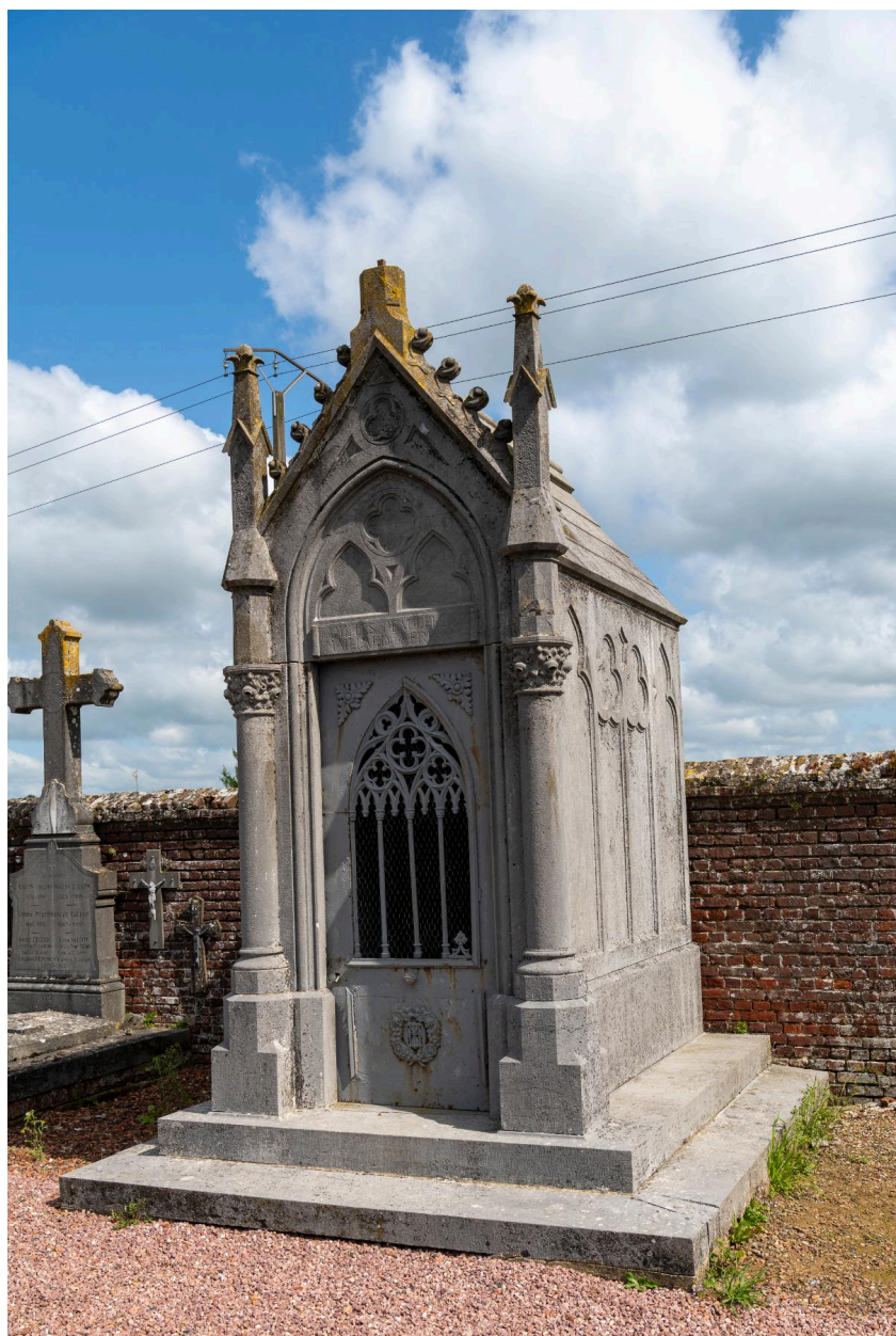
Tombeau en forme de chapelle des familles Peucellier, Maillard et Francy.