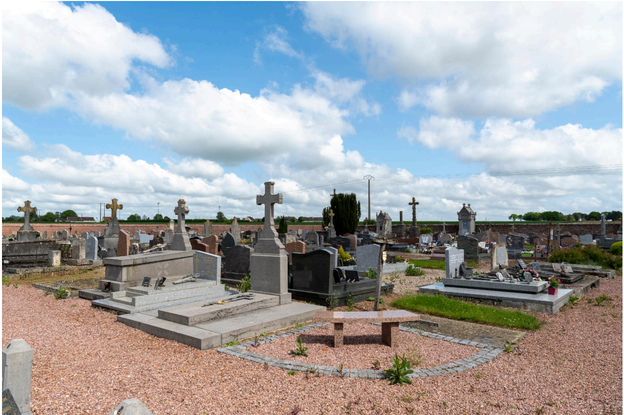
Vue générale du cimetière depuis l'angle sud-est.