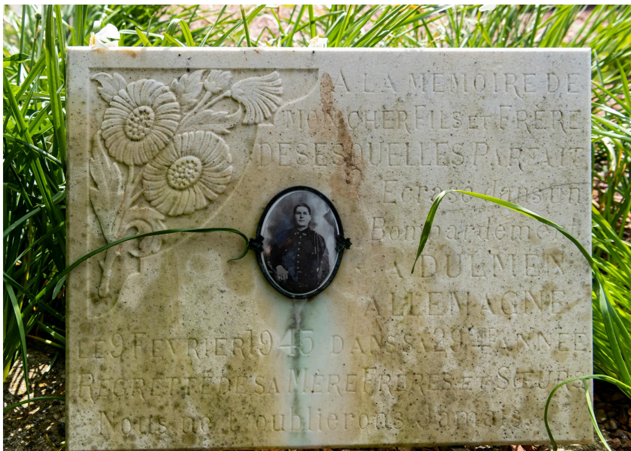
Plaque funéraire de Parfait Desesquelles, mort au cours d'un bombardement en Allemagne en 1945.