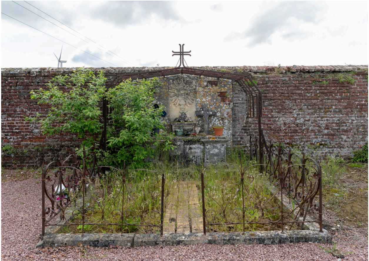
Tombeau avec porte-couronnes et clôture en fer forgé.