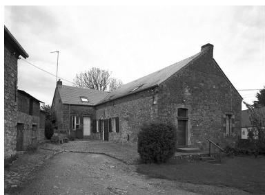
Vue du logis, depuis la cour.