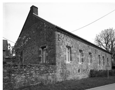
Vue générale du logis, depuis la voie.

Phot. Grégory Boulén (reproduction) IVR31_20045905241NUCA