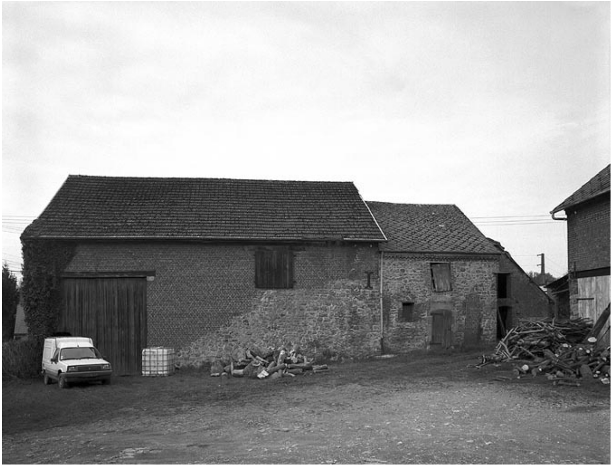
Vue des bâtiments d'exploitation situés à l'ouest.