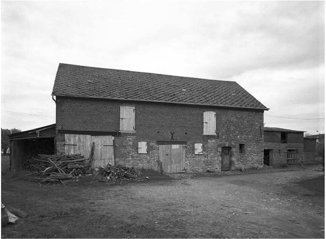
Vue de l'étable-fenil, située au nord.