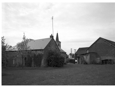
Vue de l'élévation postérieure du logis.