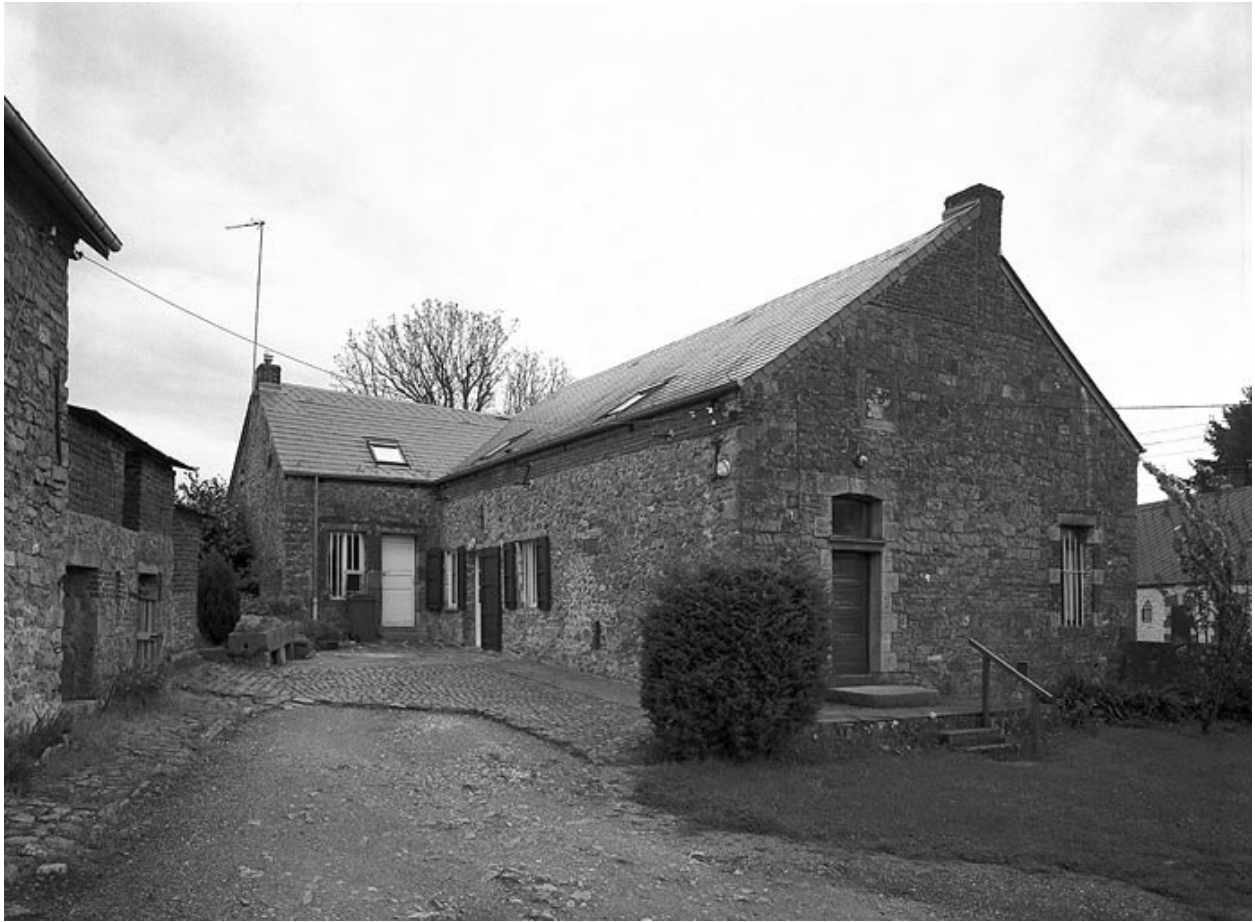
Vue du logis, depuis la cour.