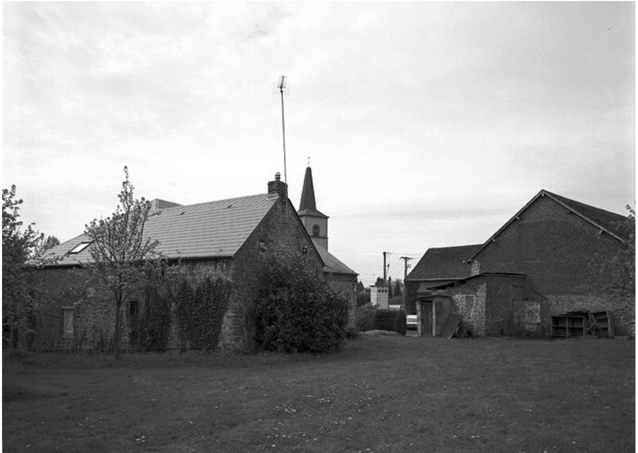
Vue de l'élévation postérieure du logis.