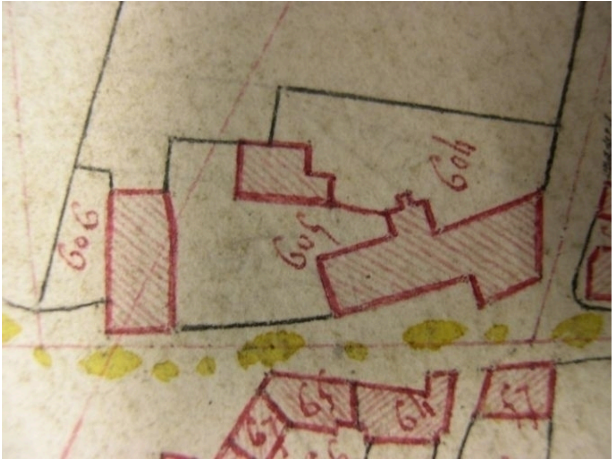
Extrait de la feuille cadastrale A2. Plan de situation en 1810.