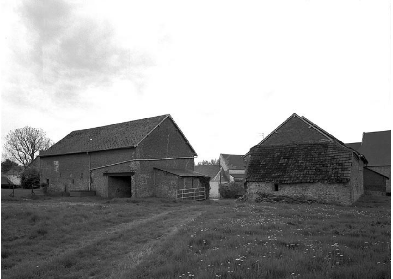
Vue de l'élévation postérieure des bâtiments d'exploitation.