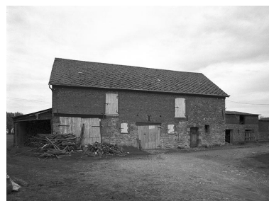
Vue de l'étable-fenil, située au nord.