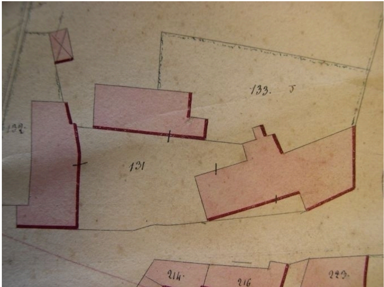
Extrait de la feuille cadastrale D1. Plan de situation en 1845.