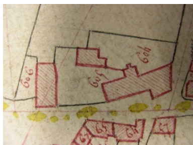
Extrait de la feuille cadastrale A2. Plan de situation en 1810.

Phot. Grégory Boulén (reproduction) IVR31_20045905242NUCA