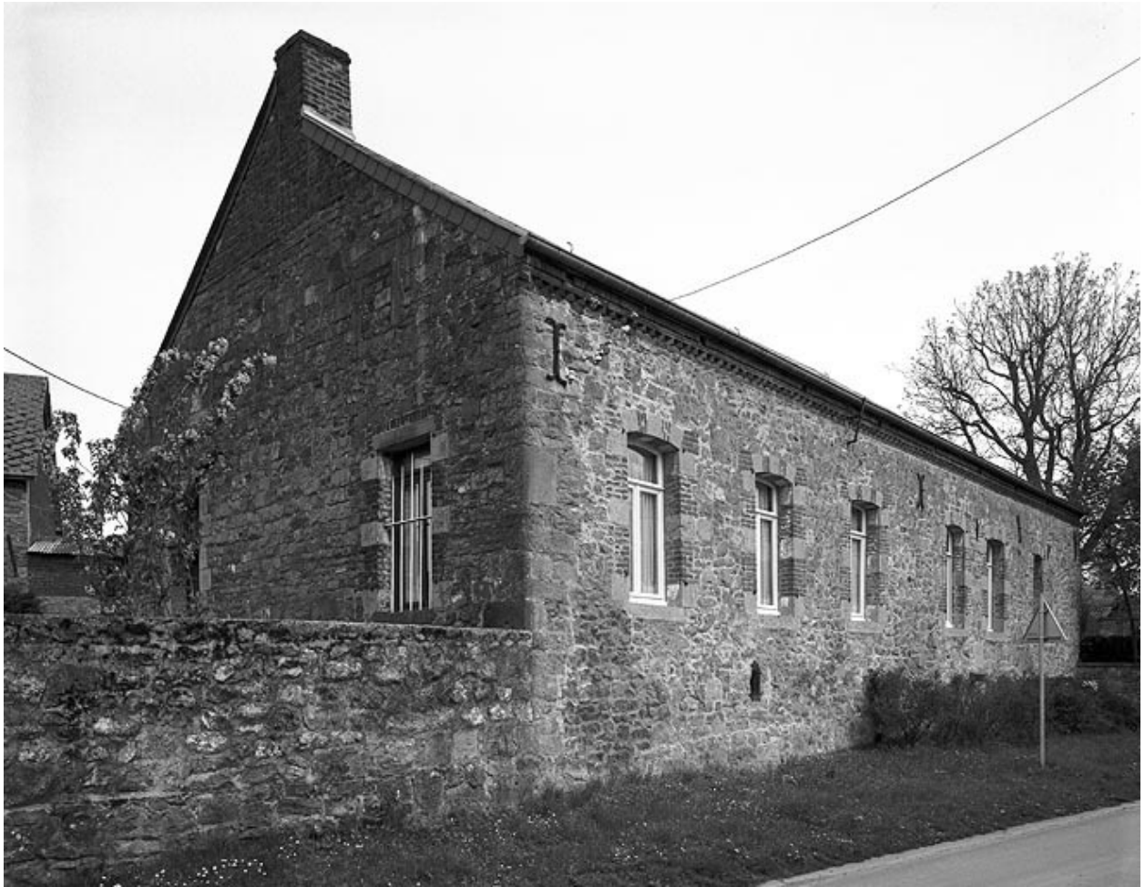
Vue générale du logis, depuis la voie.