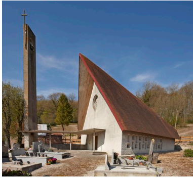
Vue générale. IVR31_20106200648NUCA