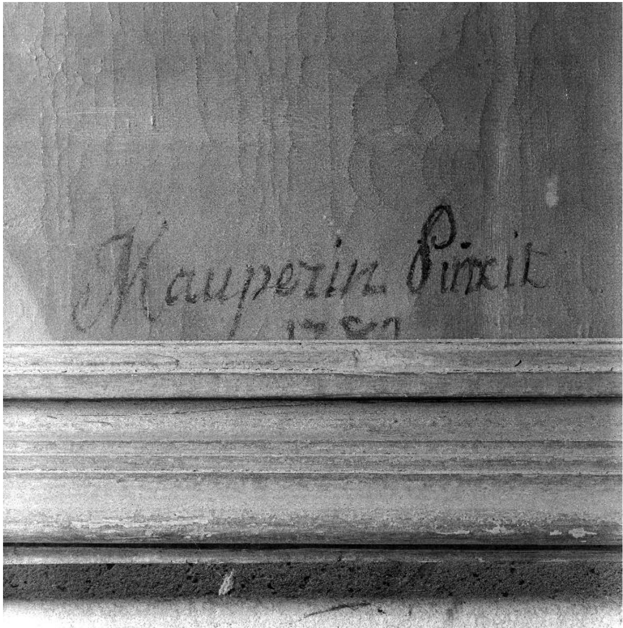
Détail de la signature et de la date.