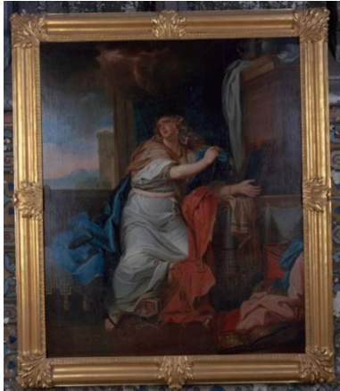
Vue générale. IVR22_19966003851VA