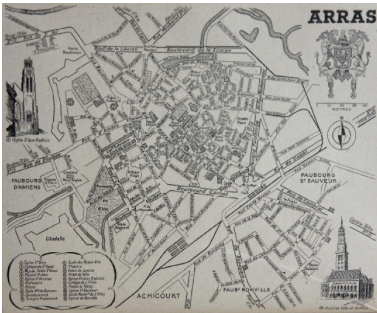
Plan de la ville d'Arras en 1943.