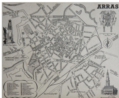
Plan de la ville d'Arras en 1943. IVR31_20096200323NUCA