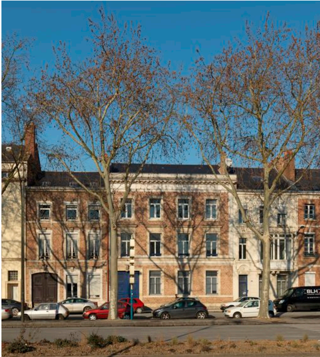
Vue de situation, ancienne maison, à droite de l'image.