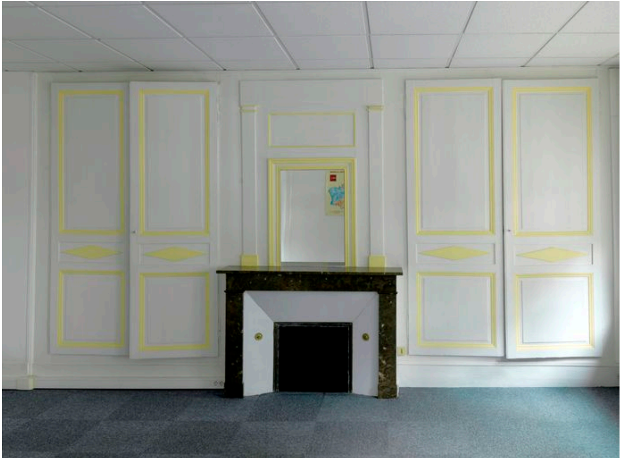
Boiseries et cheminée de l'ancienne chambre (sur rue) du deuxième étage.