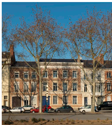
Vue de situation, ancienne maison, à droite de l'image.