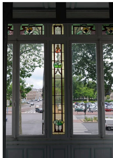
Vue intérieure de la logette du premier étage.