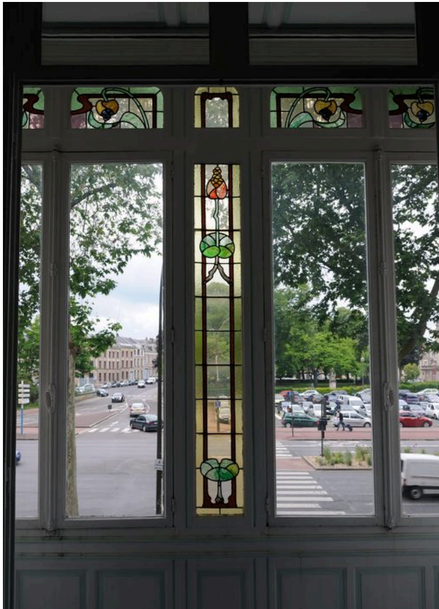
Vue intérieure de la logette du premier étage.