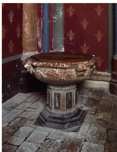
Vue générale. IVR22_20090200395XA