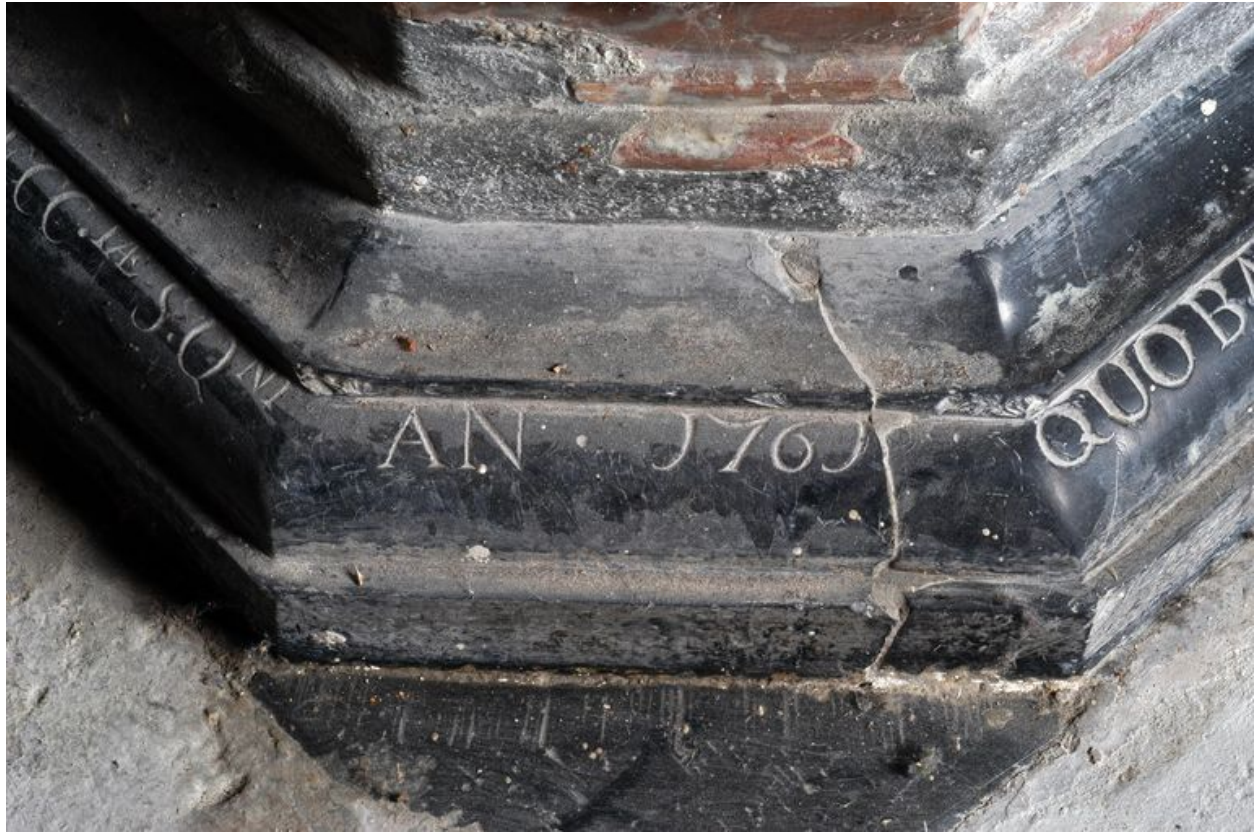
Détail du pied : date gravée de 1761.