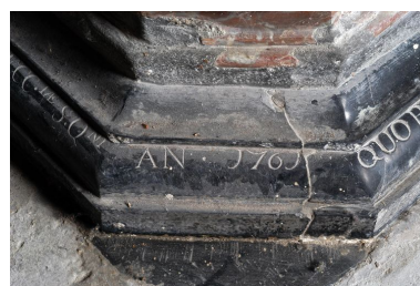
Détail du pied : date gravée de 1761. IVR22_20090200398NUCA