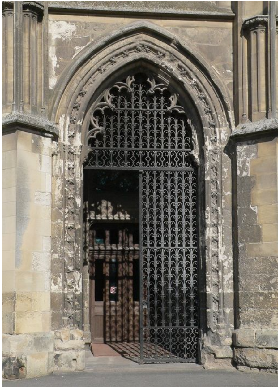
Vue du portail Saint-Quentin.