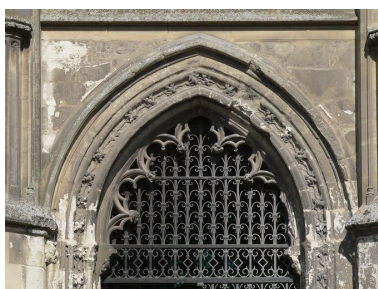
Dormant de la clôture du portail Saint-Quentin.