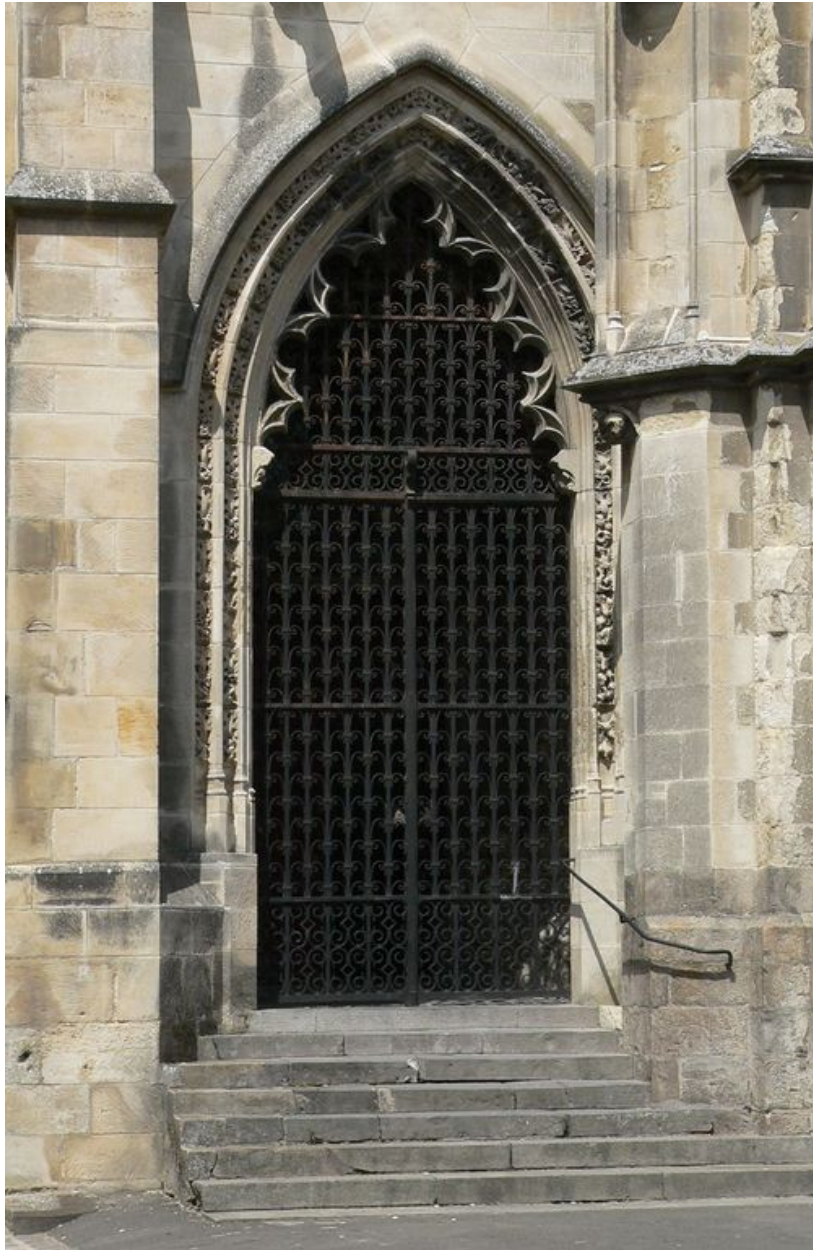
Vue du portail Lamoureux.