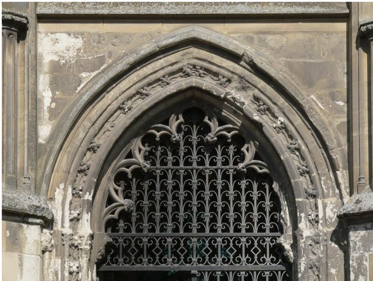
Dormant de la clôture du portail Saint-Quentin.