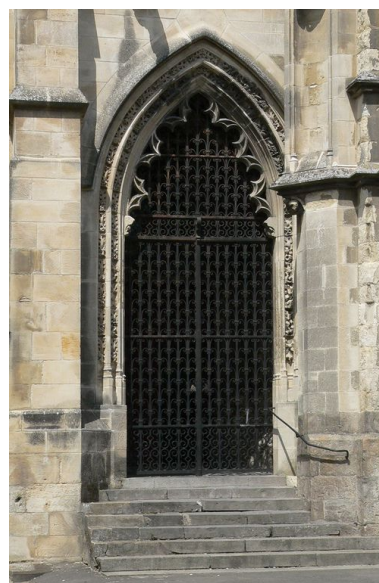
Vue du portail Lamoureux. IVR22_20110201081NUCA