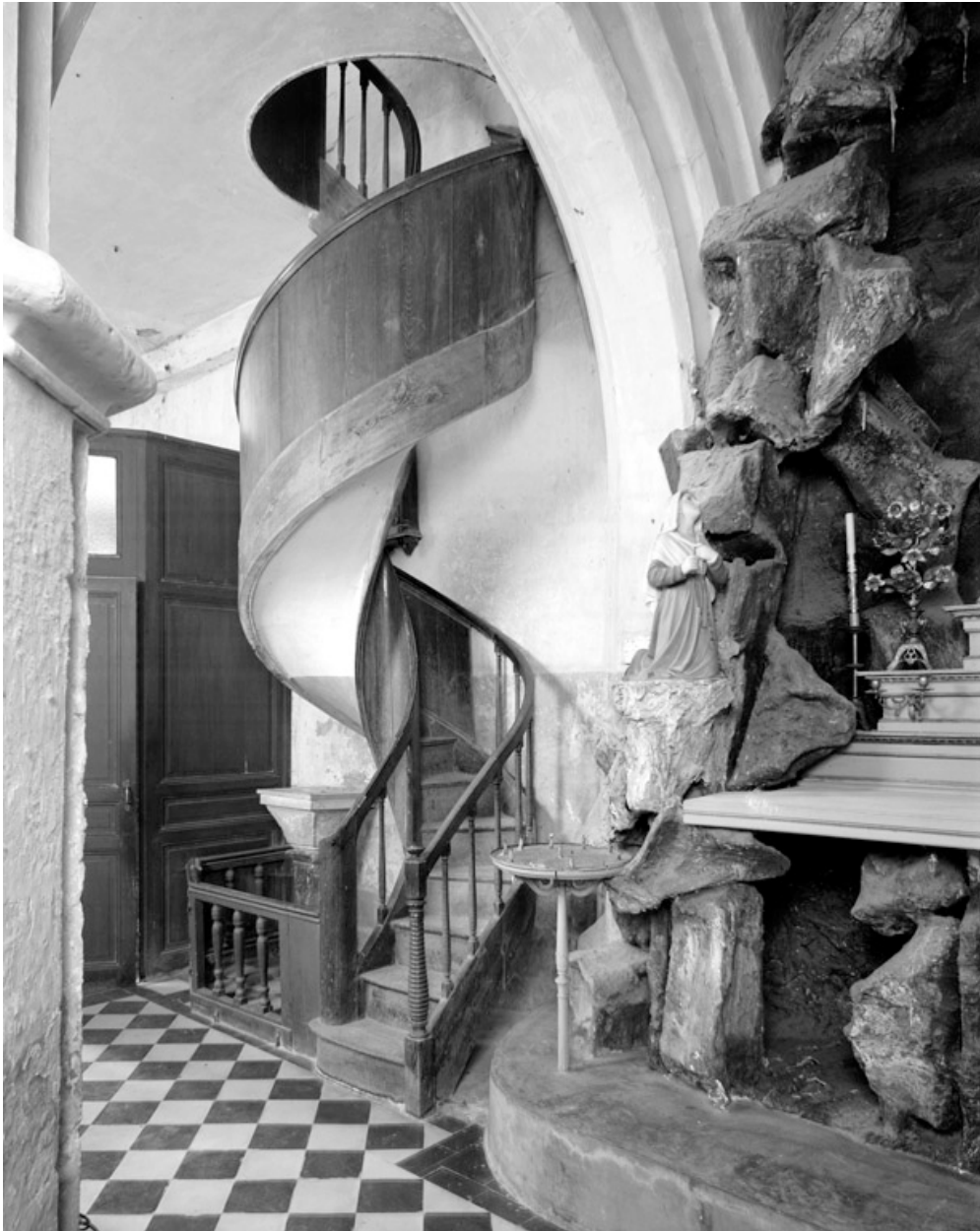
Escalier en colimaçon montant à la tribune, depuis la nef.