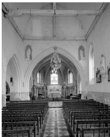
Vue intérieure, vers le chœur. IVR22_19978000286V