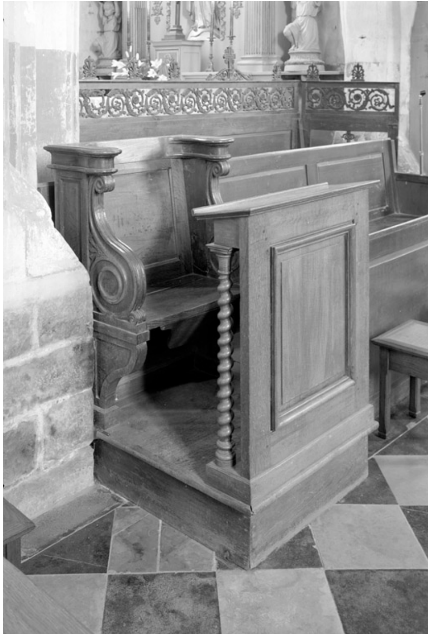
Elément de stalles en remploi dans le choeur.