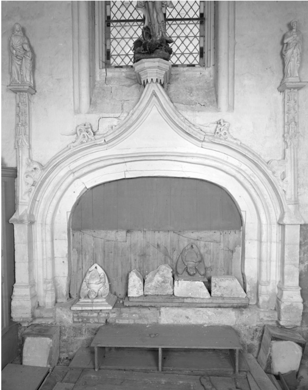
Arc en accolade, dans la chapelle sud.