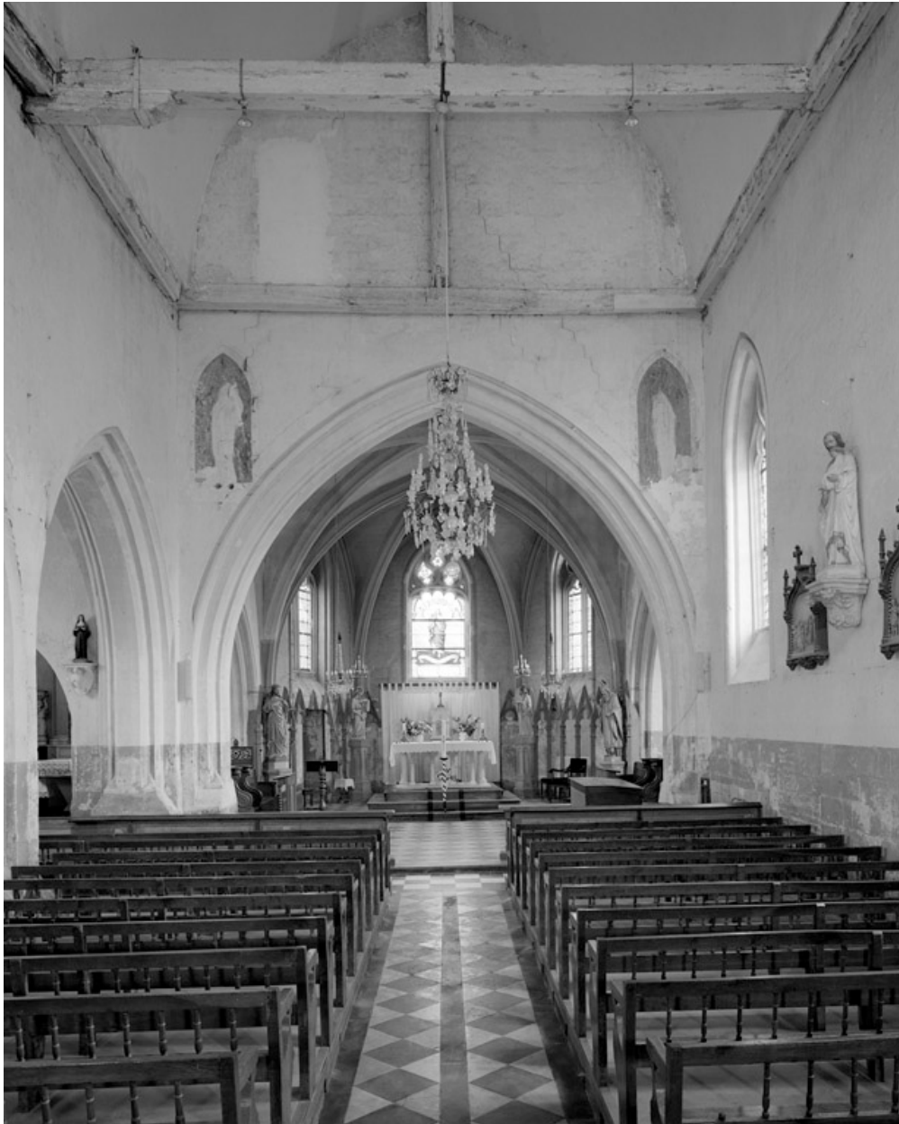
Vue intérieure, vers le chœur.