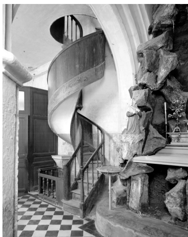
Escalier en colimaçon montant à la tribune, depuis la nef. IVR22_19978000288V