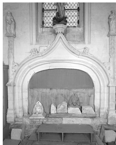
Arc en accolade, dans la chapelle sud.