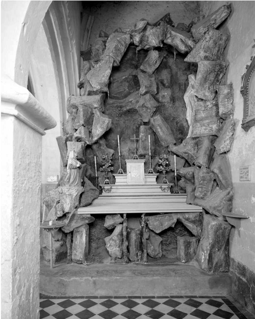
Autel secondaire, dans la chapelle aménagée sous le clocher, grotte de Lourdes.