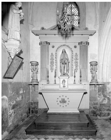
Autel secondaire, dans la chapelle nord-est. IVR22_19978000289V