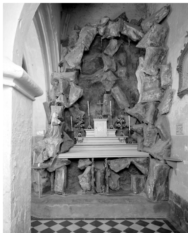
Autel secondaire, dans la chapelle aménagée sous le clocher, grotte de Lourdes. IVR22_19978000287V