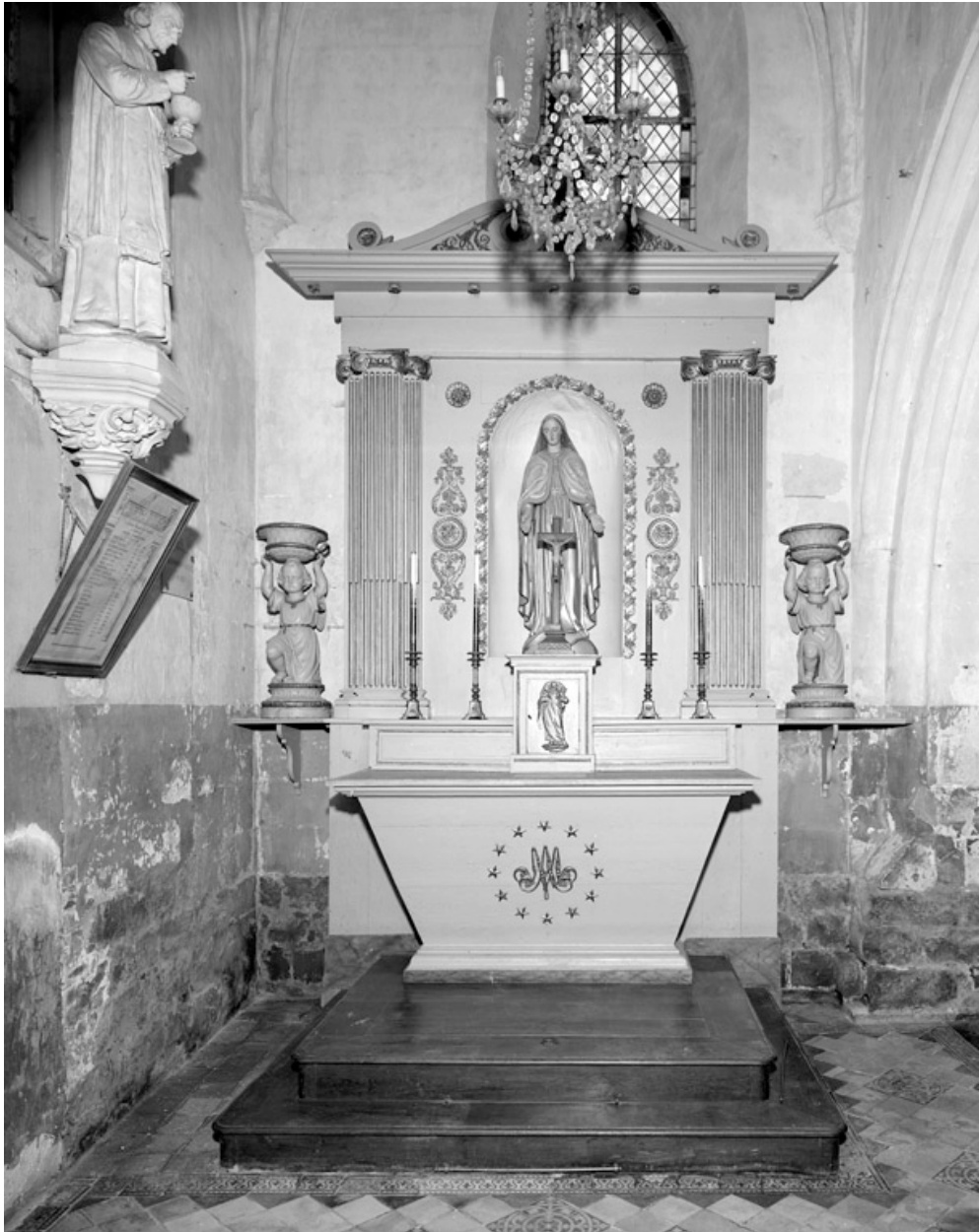
Autel secondaire, dans la chapelle nord-est.