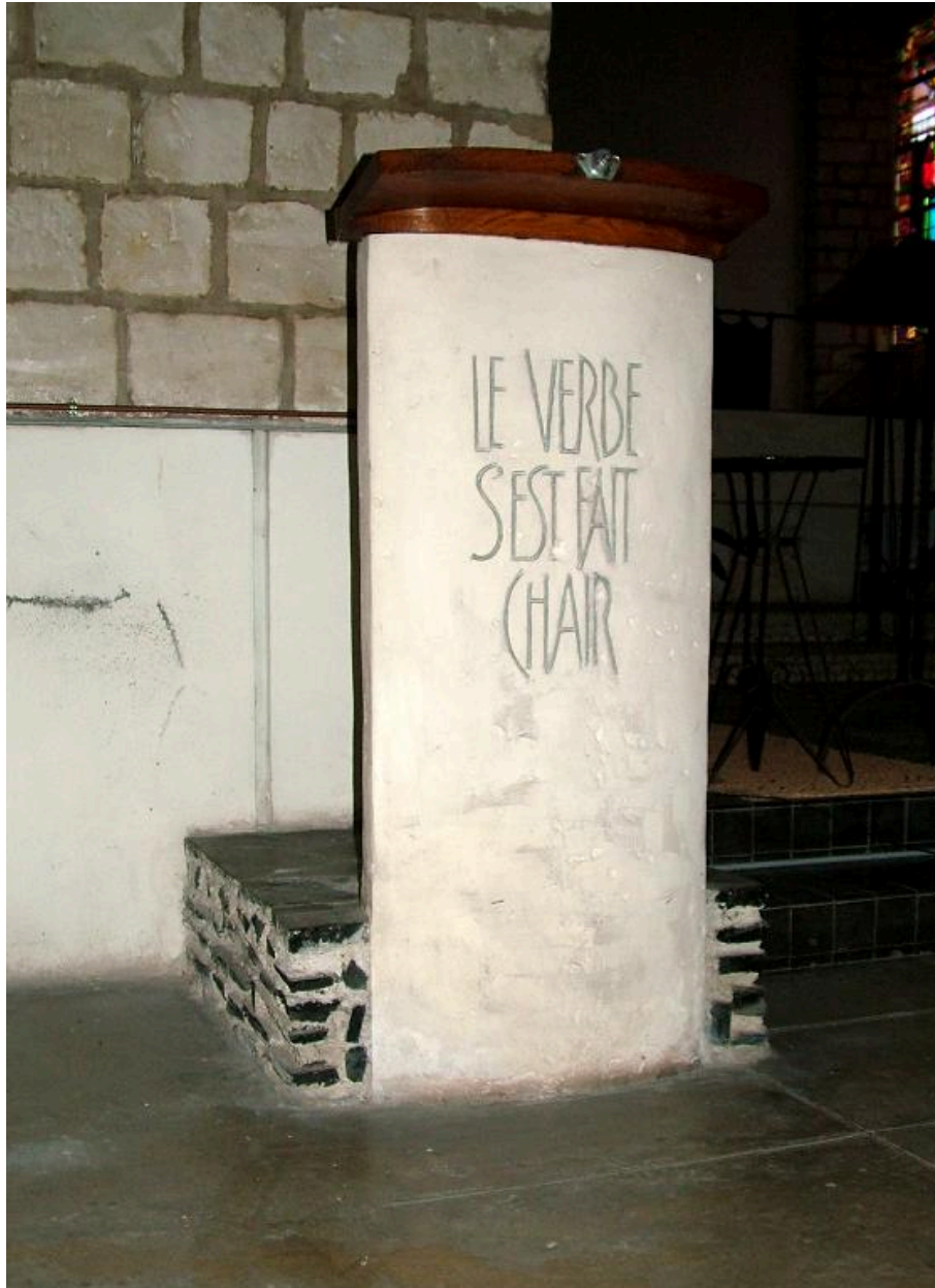
Ambon, calcaire, 4e quart 20e siècle.