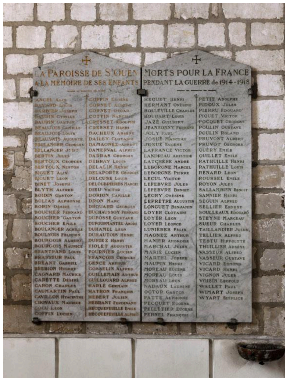
Tableau commémoratif des morts, 2e quart 20e siècle.