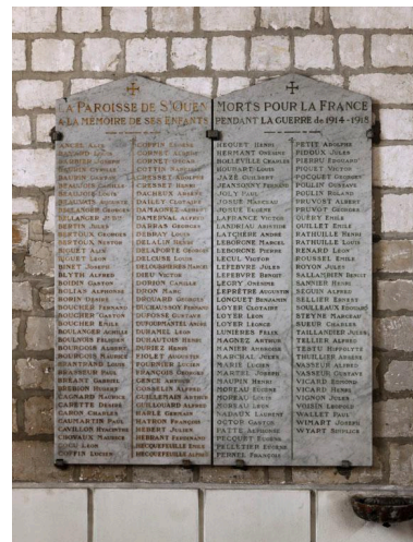
Tableau commémoratif des morts, 2e quart 20e siècle.