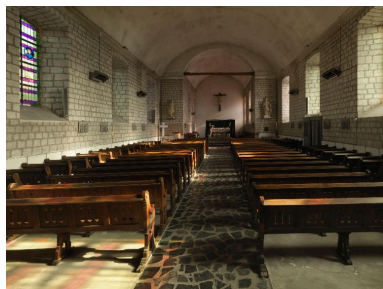
Vue de la nef et du chœur.