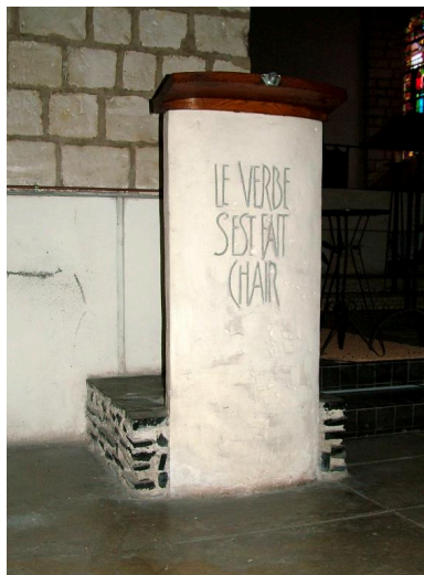
Ambon, calcaire, 4e quart 20e siècle.