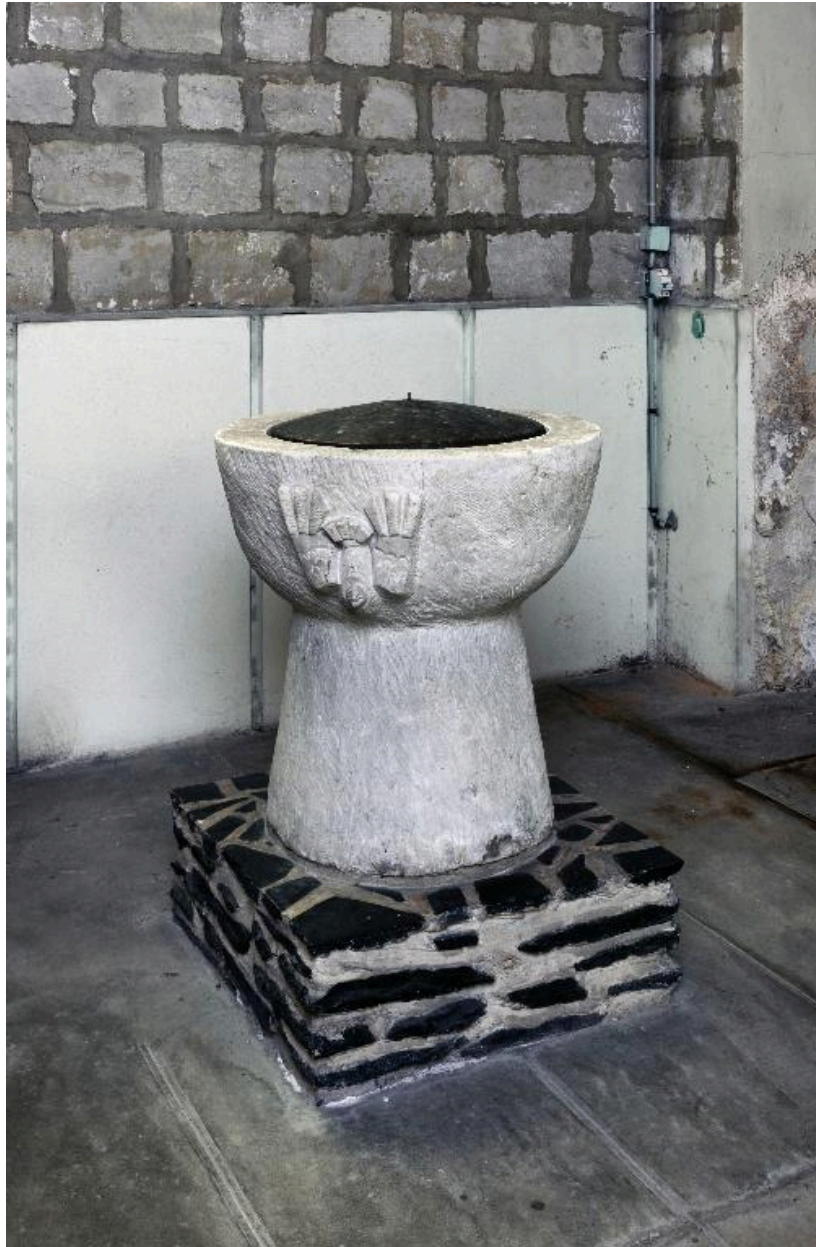
Fonts baptismaux, calcaire, 4e quart 20e siècle.