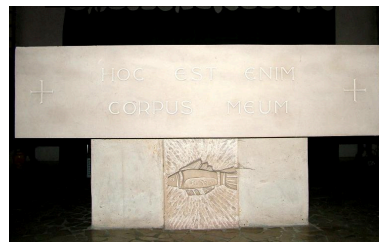
Détail du devant de l'autel de rite Paul VI, calcaire, 4e quart 20e siècle.