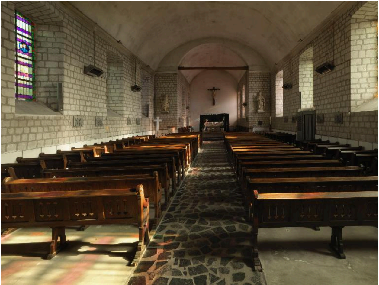
Vue de la nef et du chœur.