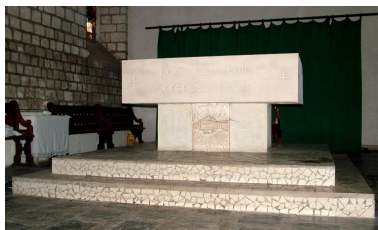
Autel de rite Paul VI, calcaire, 4e quart 20e siècle.