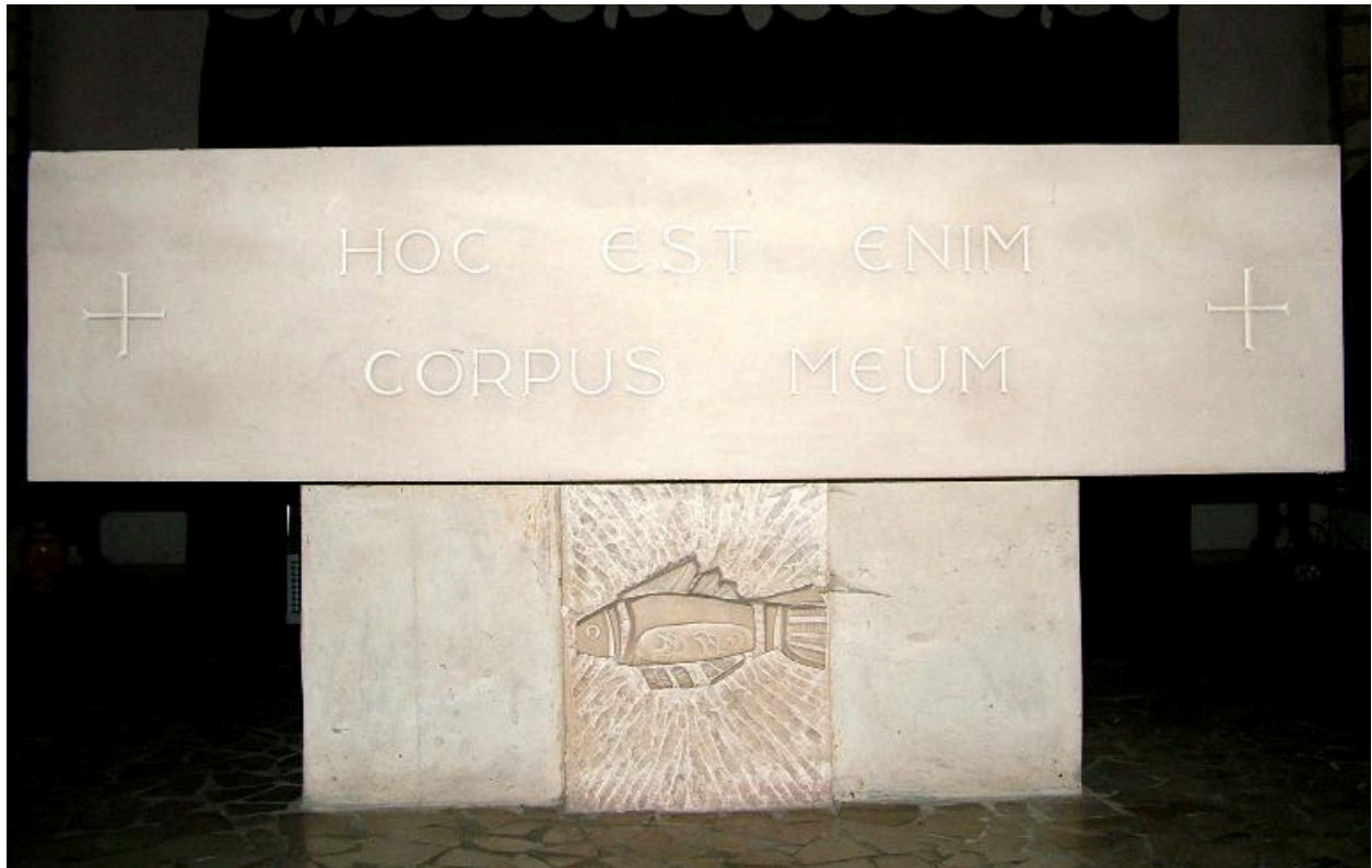
Détail du devant de l'autel de rite Paul VI, calcaire, 4e quart 20e siècle.