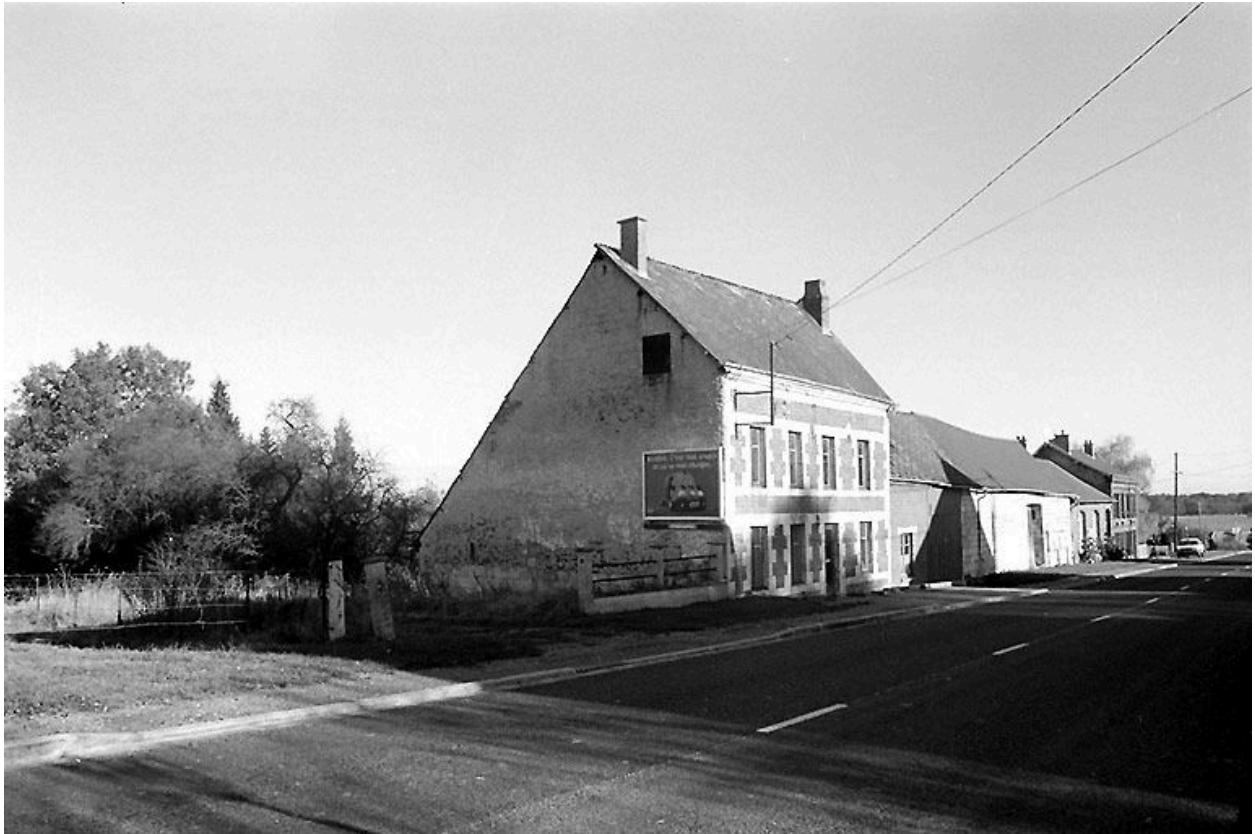
Vue générale : logis et grange depuis le sud-ouest.