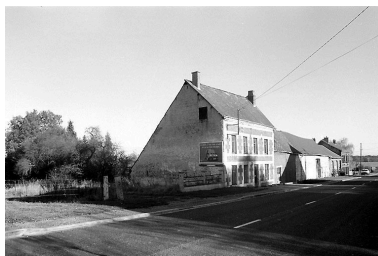
Vue générale : logis et grange depuis le sud-ouest.