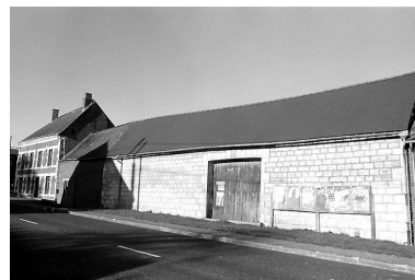
Grange.