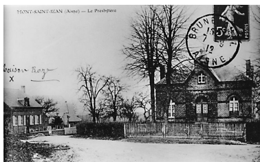
Vue de l'ancien presbytère, avant sa transformation en laiterie (AP).

Phot. Monnehay-Vulliet Marie-Laure IVR22_20080290141NUCA