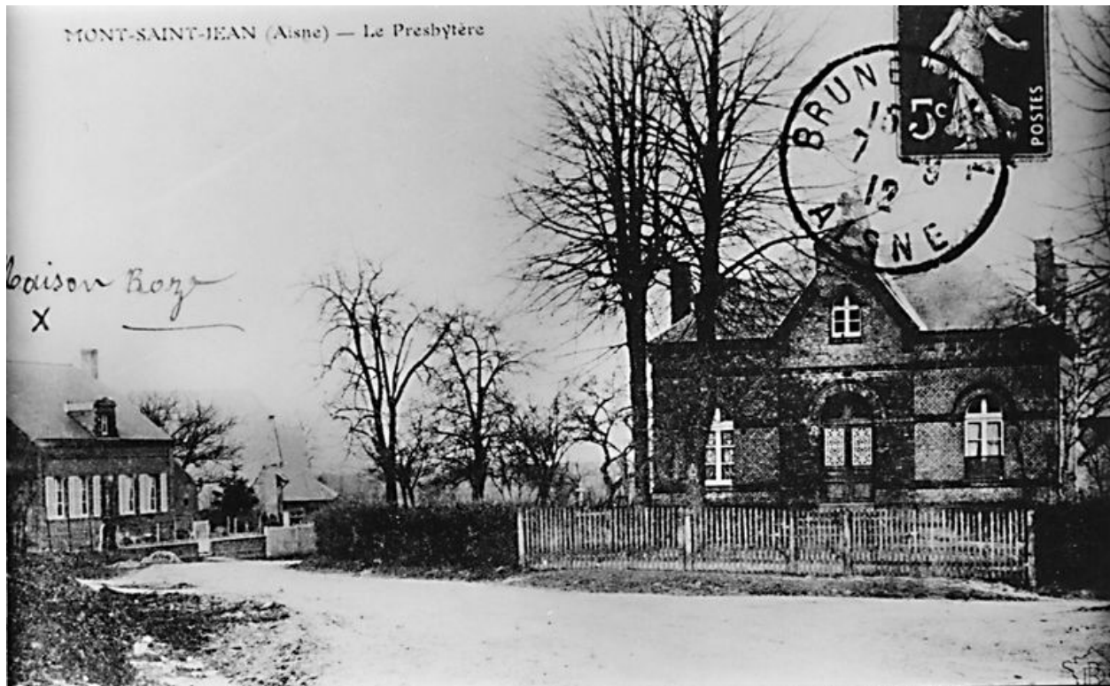
Vue de l'ancien presbytère, avant sa transformation en laiterie (AP).