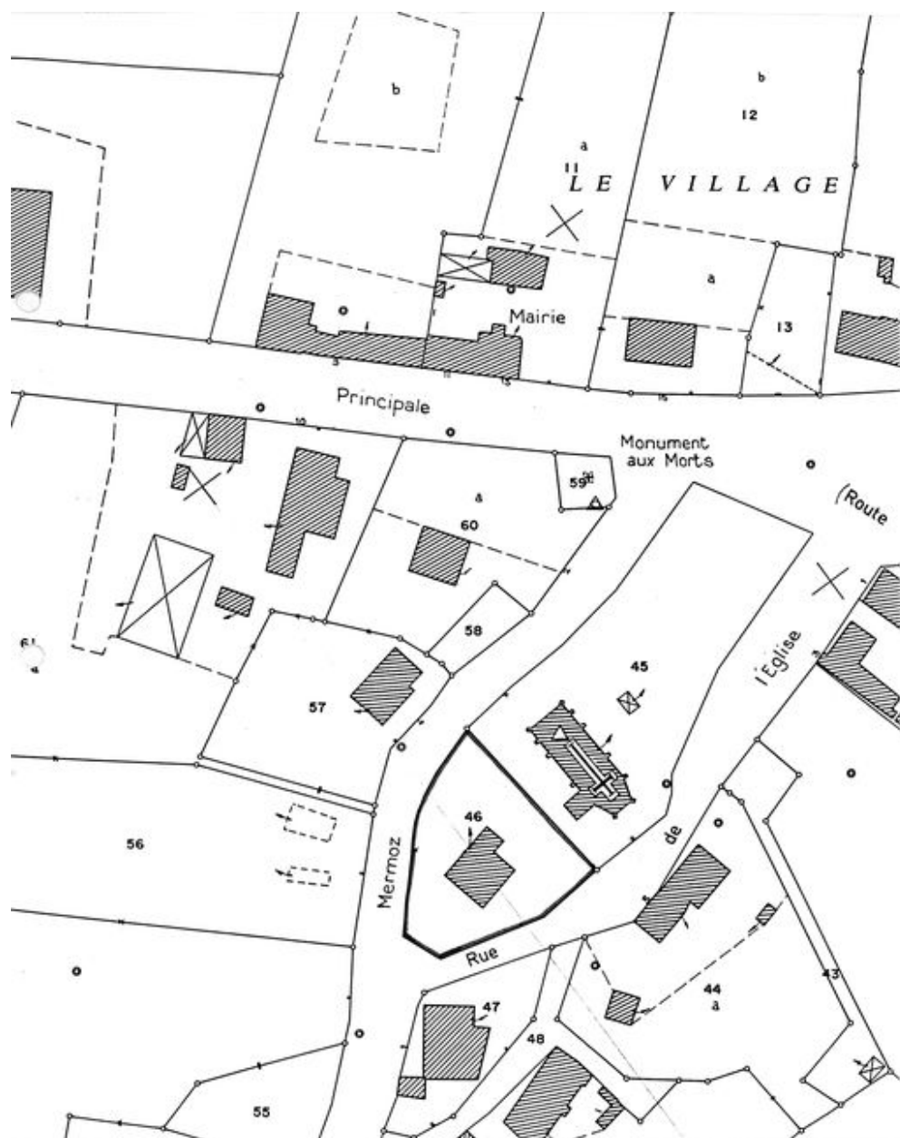
Plan de situation. Extrait du plan cadastral de 1986, section ZA.