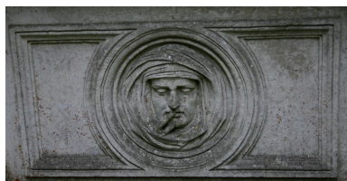
Bas-relief représentant l'allégorie du Silence, d'après Préault. IVR22_20098001299NUCA