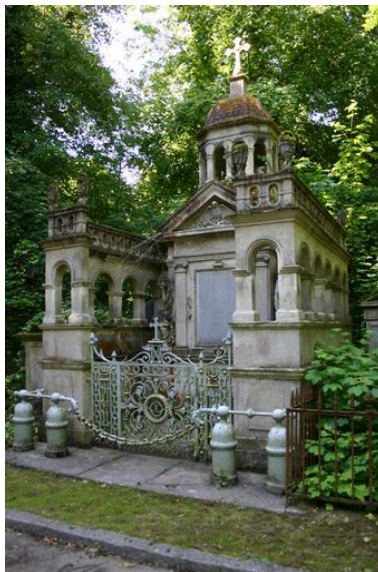
Vue générale du tombeau-mausolée en forme de mausolée, depuis le côté.