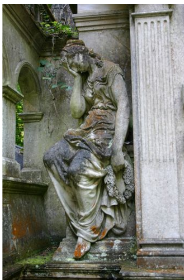
Pleureuse (gauche). IVR22_20098001297NUCA