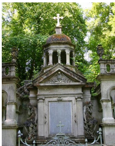
Détail de la stèle à entablement et fronton triangulaire d'applique.