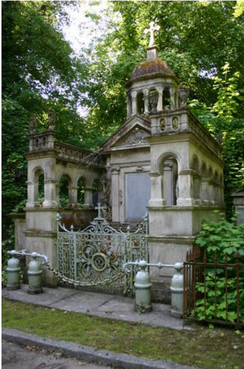
Vue générale du tombeau-monument en forme de mausolée, depuis le côté.