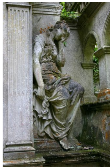
Pleureuse (droite).