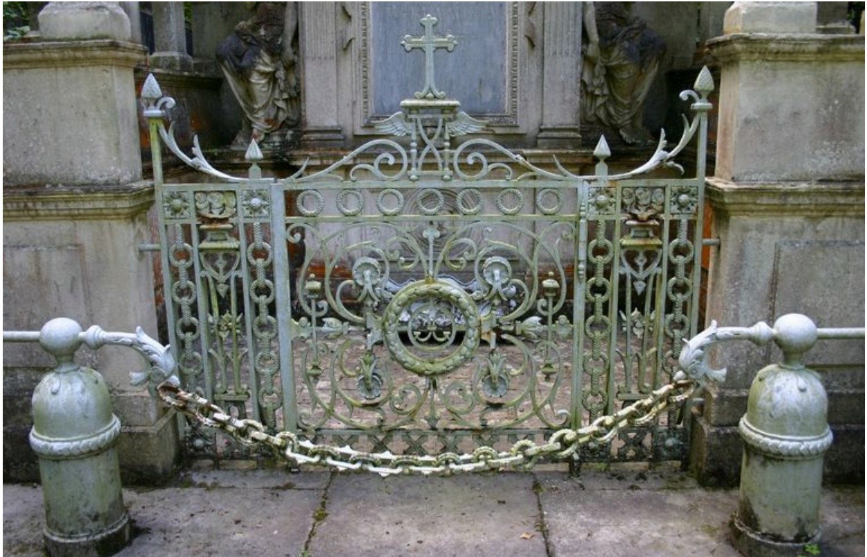
Grille de clôture antérieure en fonte ouvragée.