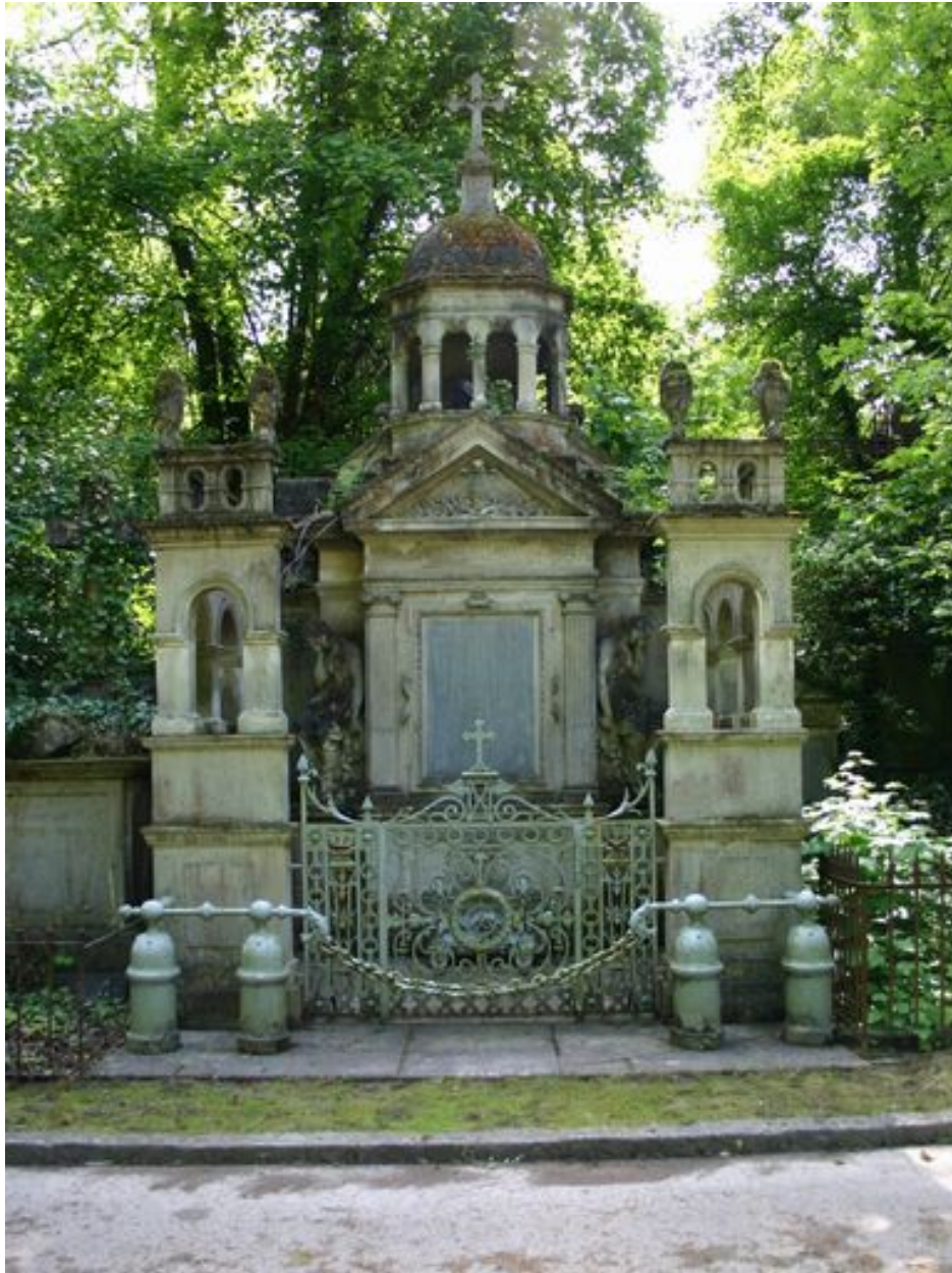
Vue générale de face du tombeau-monument en forme de mausolée.