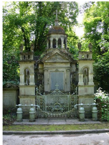
Vue générale de face du tombeau-mausolée en forme de mausolée.