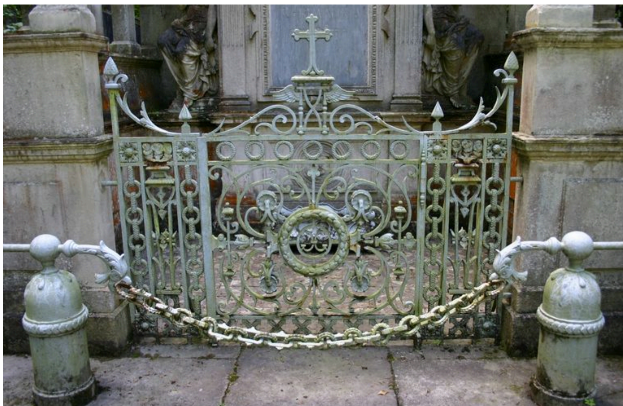
Grille de clôture antérieure en fonte ouvragée.