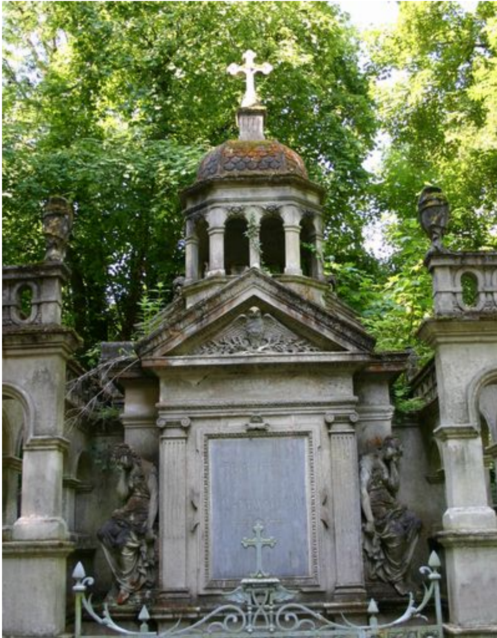
Détail de la stèle à entablement et fronton triangulaire d'applique.