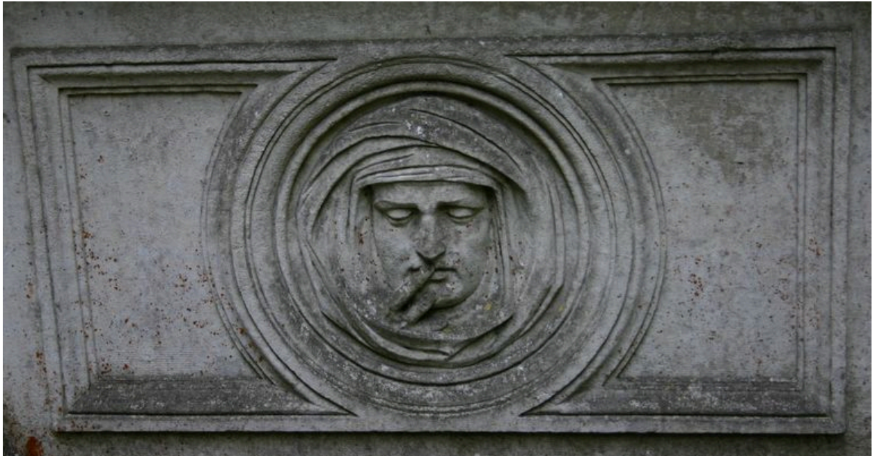
Bas-relief représentant l'allégorie du Silence, d'après Préault.