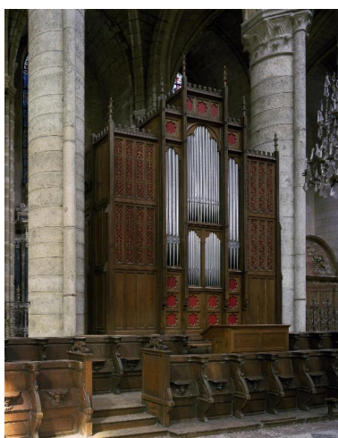
Vue générale de l'orgue.

IVR22_20010202412VA