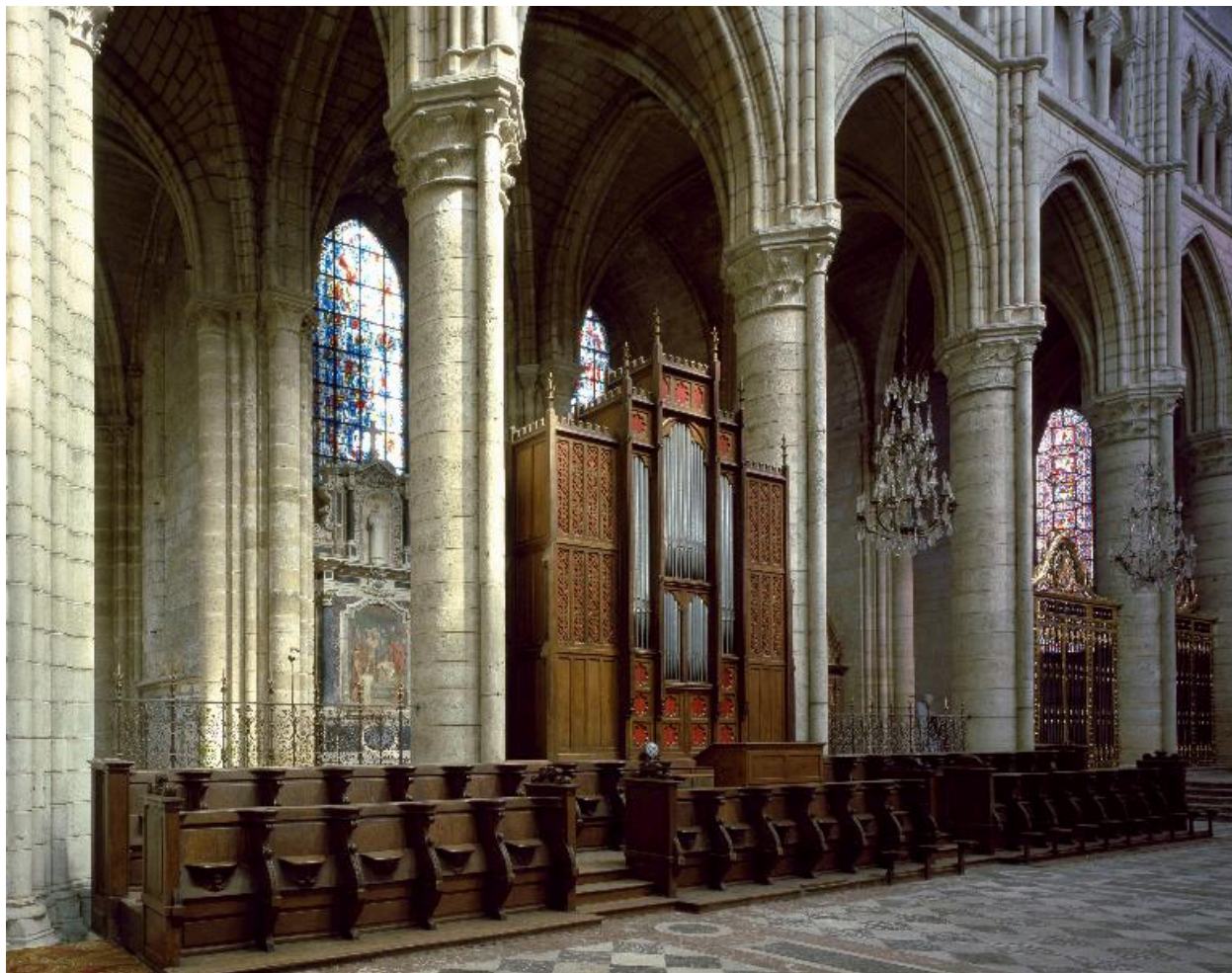
Vue de l'orgue de chœur, dans son environnement.