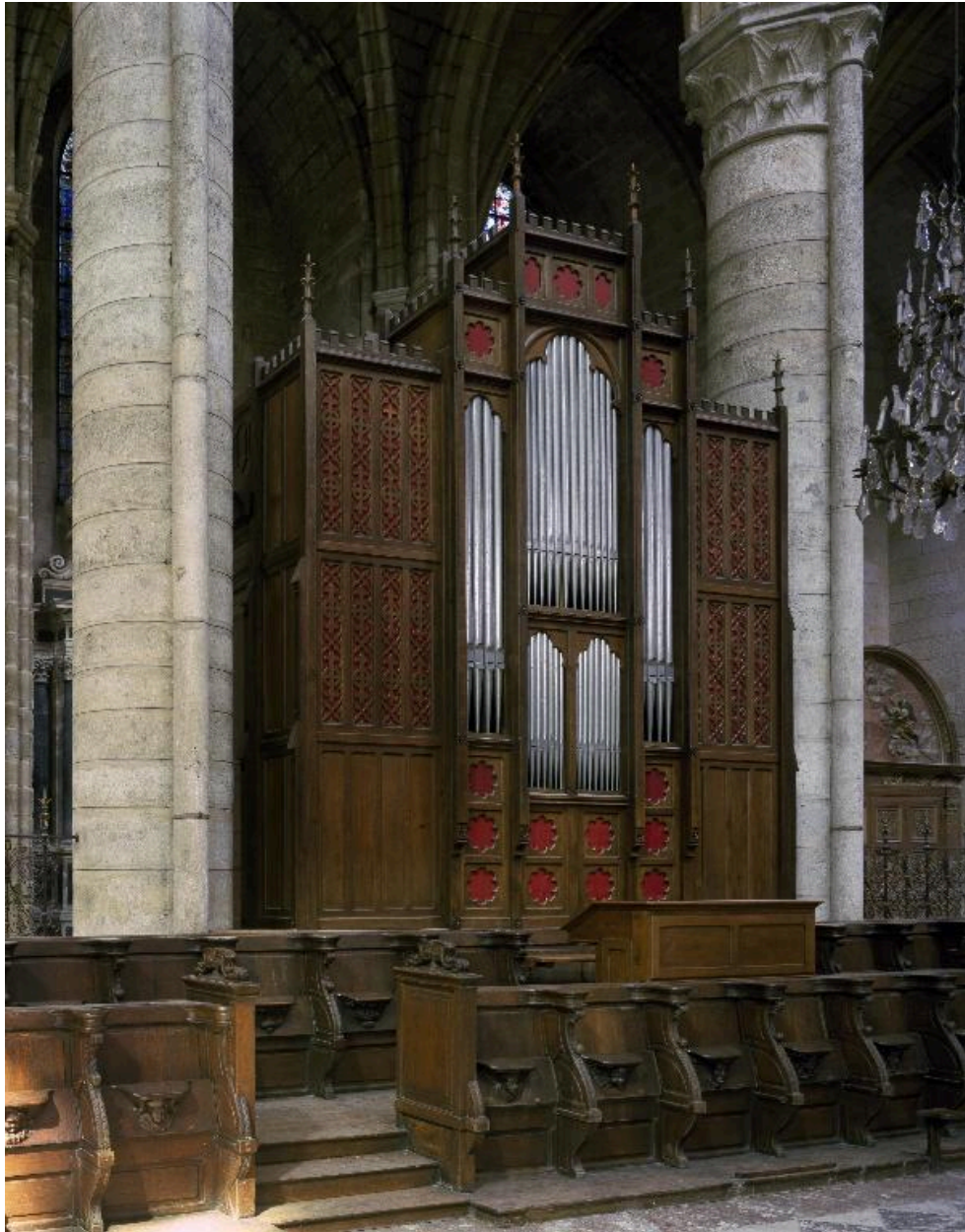
Vue générale de l'orgue.