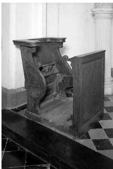
Stalle isolée dans l'abside, côté nord.