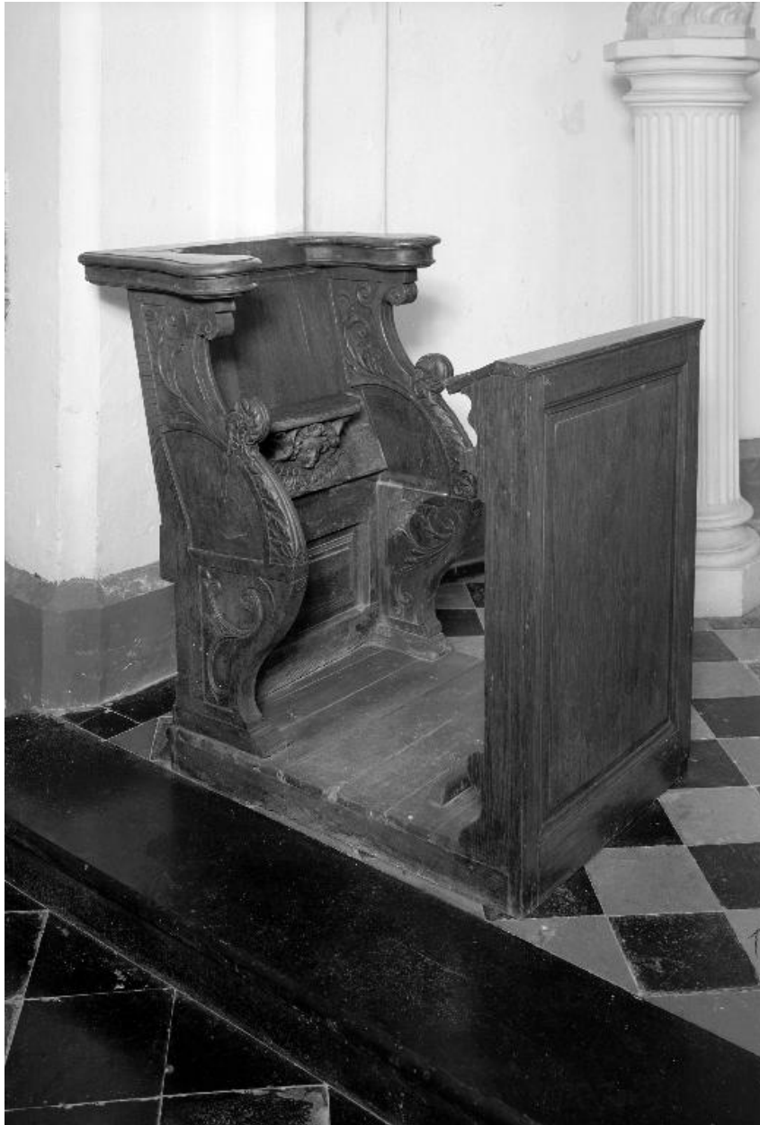
Stalle isolée dans l'abside, côté nord.