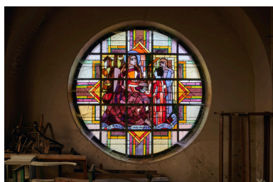
Verrière en rosace de sainte Cécile