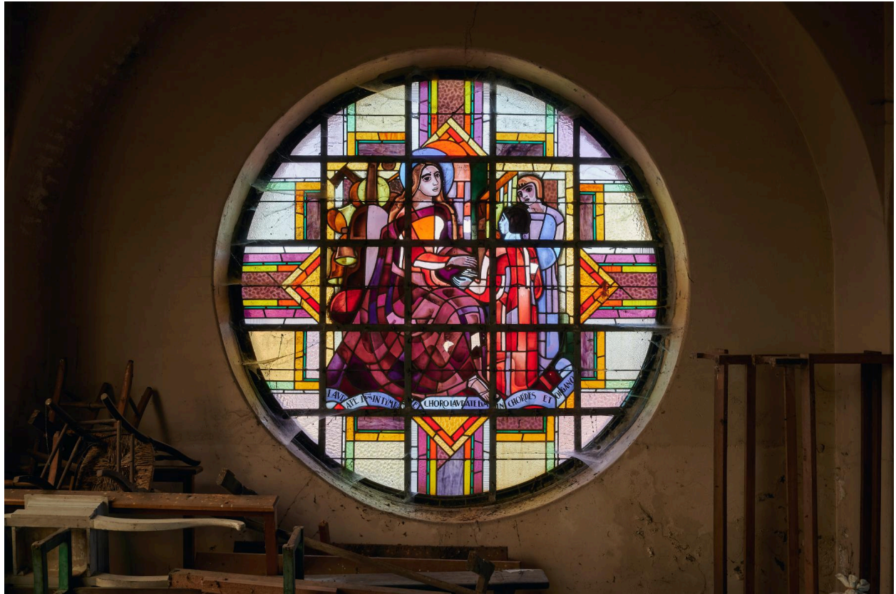
Verrière en rosace de sainte Cécile