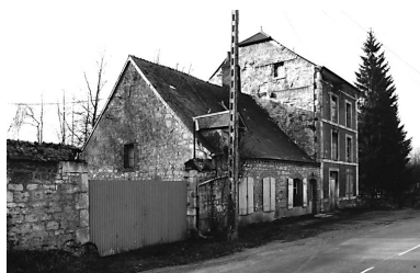
Vue du logis et du moulin.