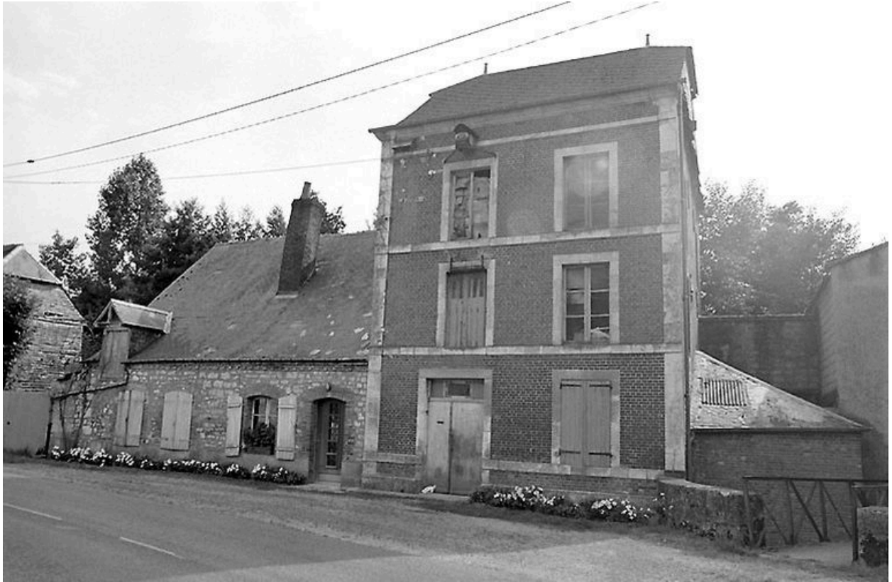
Vue générale depuis le nord-est.