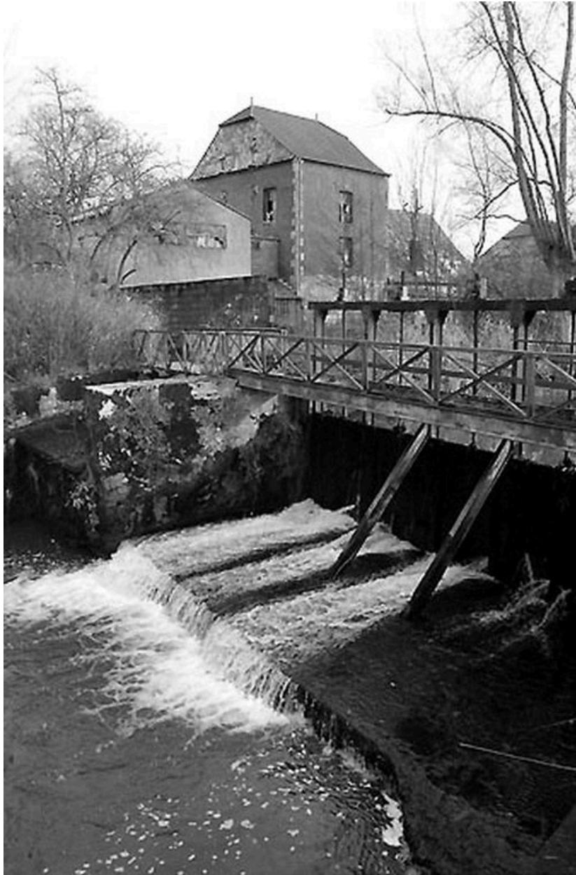
Vue des bâtiments du moulin et du barrage.