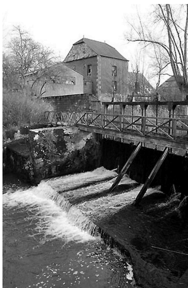
Vue des bâtiments du moulin et du barrage.