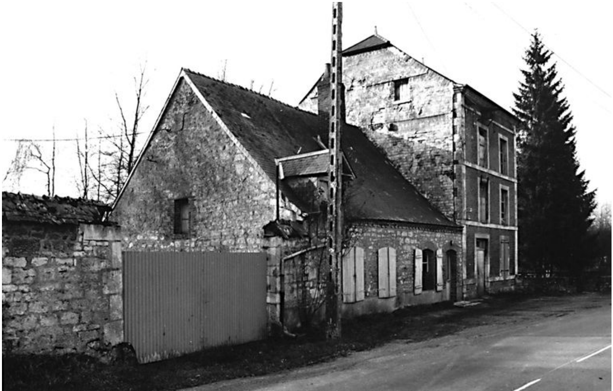
Vue du logis et du moulin.