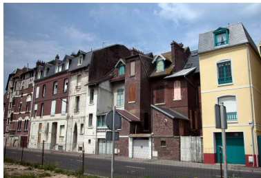
Vue d'ensemble depuis l'avenue du Maréchal-Foch, façades postérieures des maisons en front de mer.

Phot. Justome Elisabeth (reproduction) IVR22_20048001578NUCAB