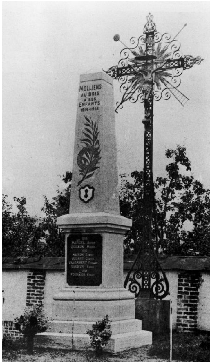
Monument aux morts, par Louis Timmerman, 1922 (C'était hier..., p 83).