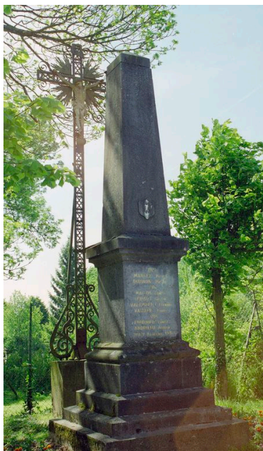
Monument aux morts et calvaire.