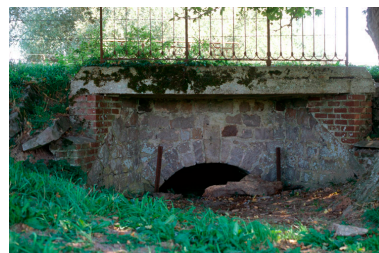
Petit pont de grès au sud du village, 1786.