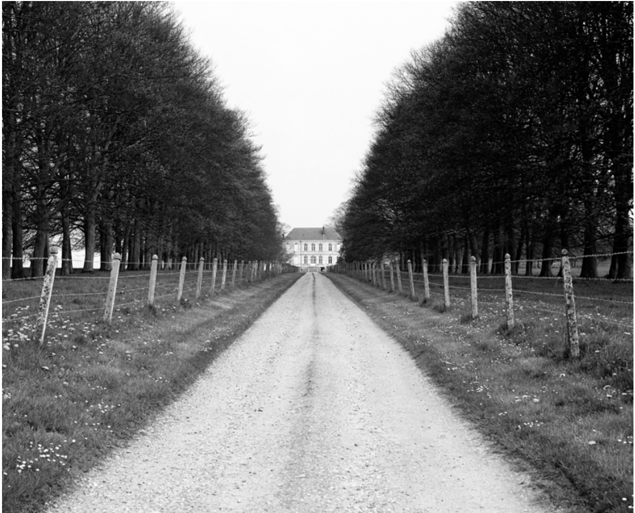
Allée menant au château.