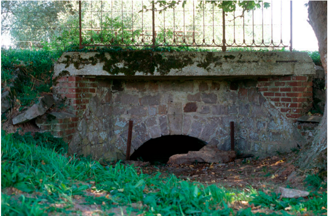
Petit pont de grès au sud du village, 1786.