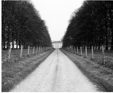
Allée menant au château. IVR22_20018000062X