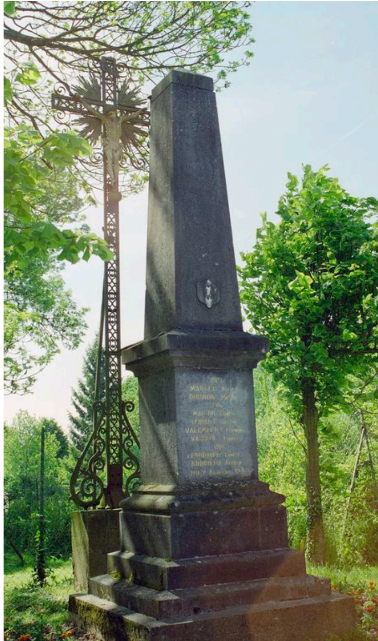
Monument aux morts et calvaire.