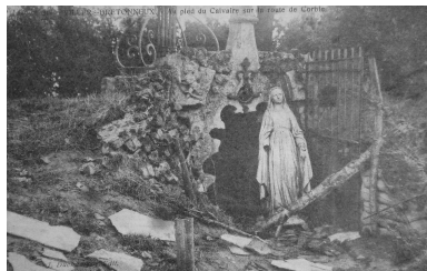
Villers-Bretonneux. Le calvaire. Carte postale, 1er quart 20e siècle (coll. part.). IVR32_20208005152NUCA