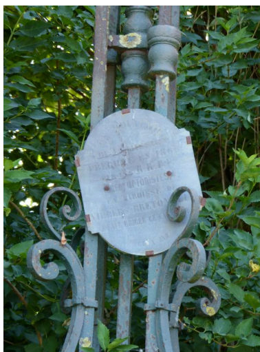
Vue de la plaque en zinc portant les inscriptions.