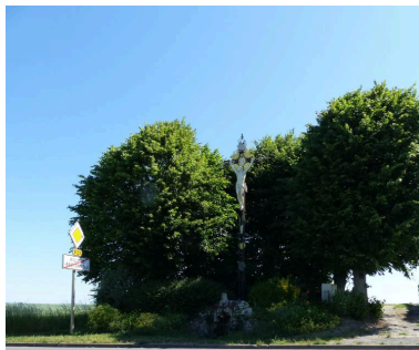
Vue générale. IVR32_20208005148NUCA