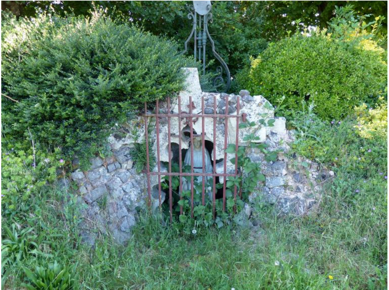
La grotte de Lourdes.