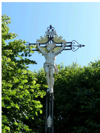
Partie supérieure de la croix.