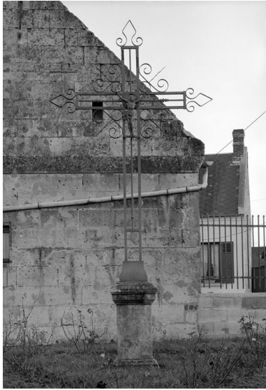
Vue générale. IVR22_19846001416X