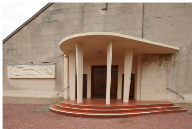
Détail du porche.