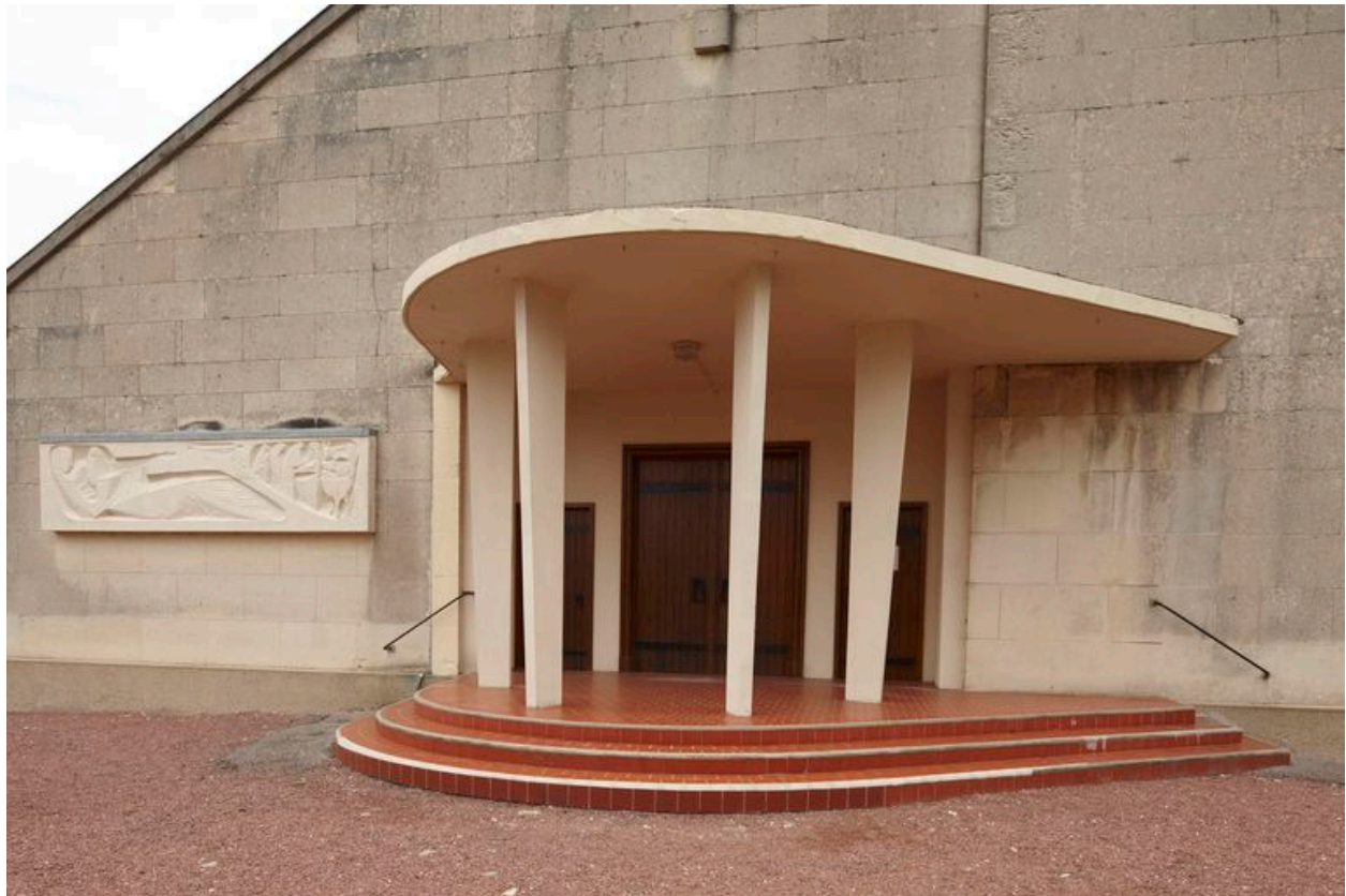
Détail du porche.