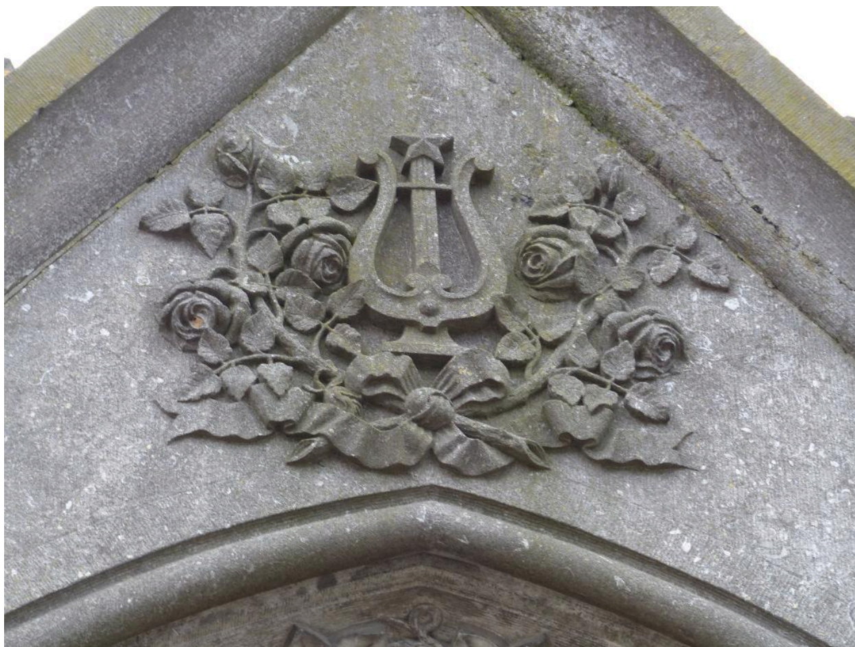
Vue du décor sculpté sur le fronton.