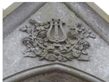
Vue du décor sculpté sur le fronton.