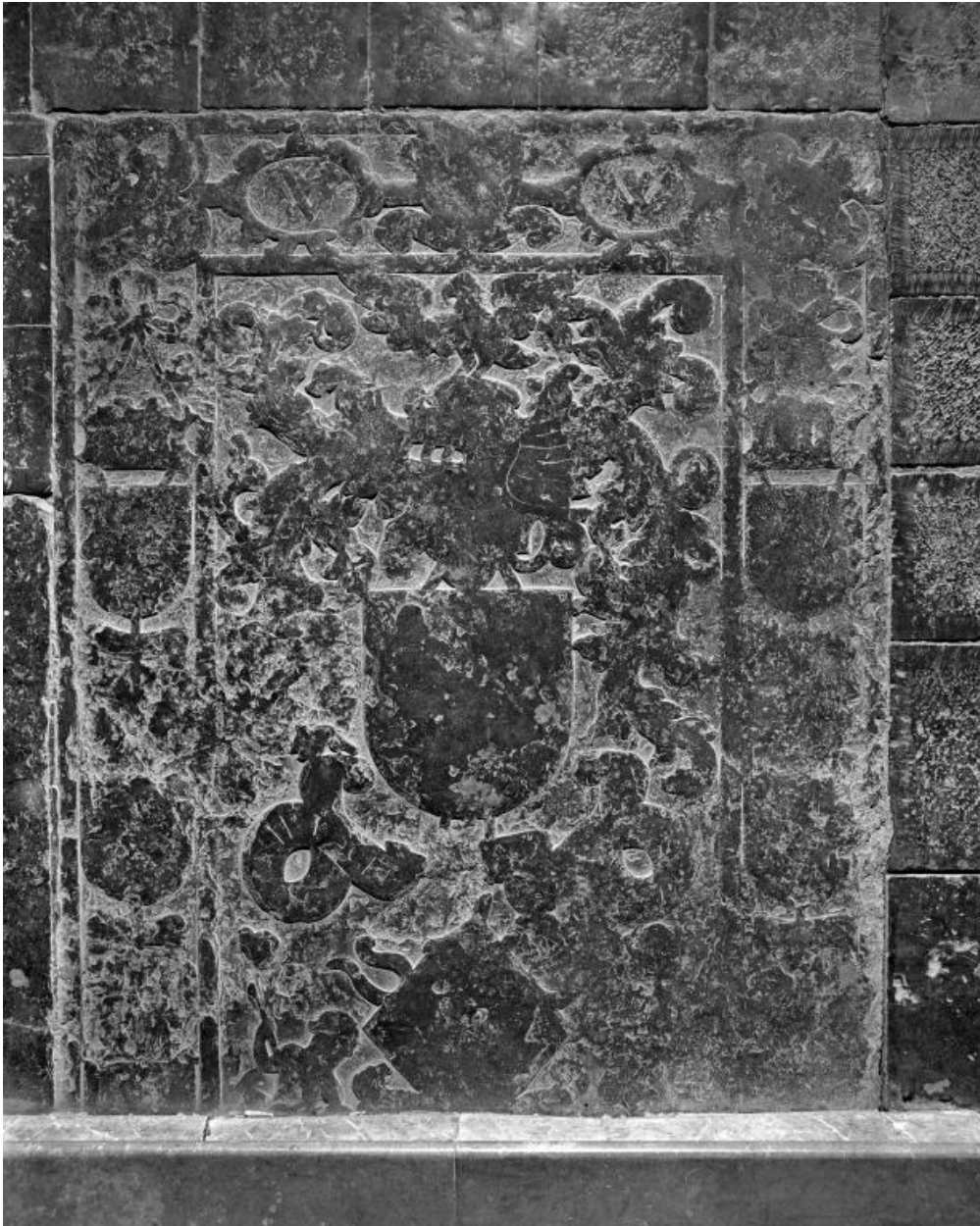
Vue de la partie visible de la dalle.