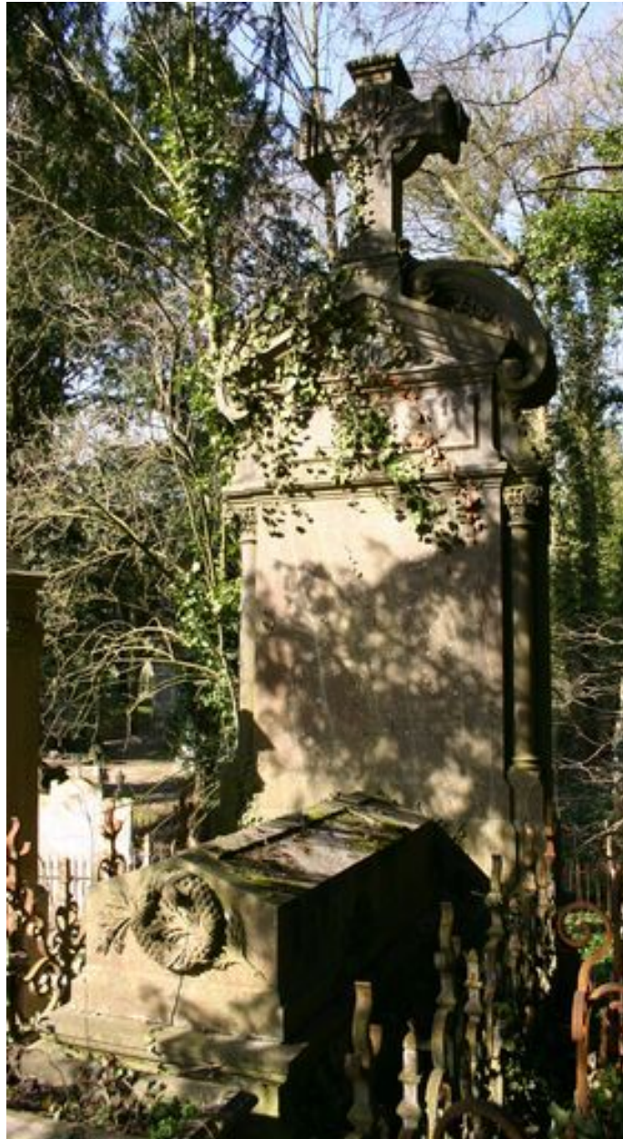
Tombeau-monument, composé d'une stèle architecturée précédée d'un tombeau en forme de sarcophage.