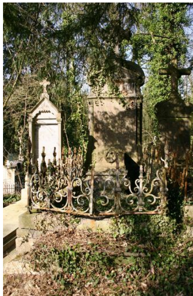
Vue générale. IVR22_20098000890NUCA