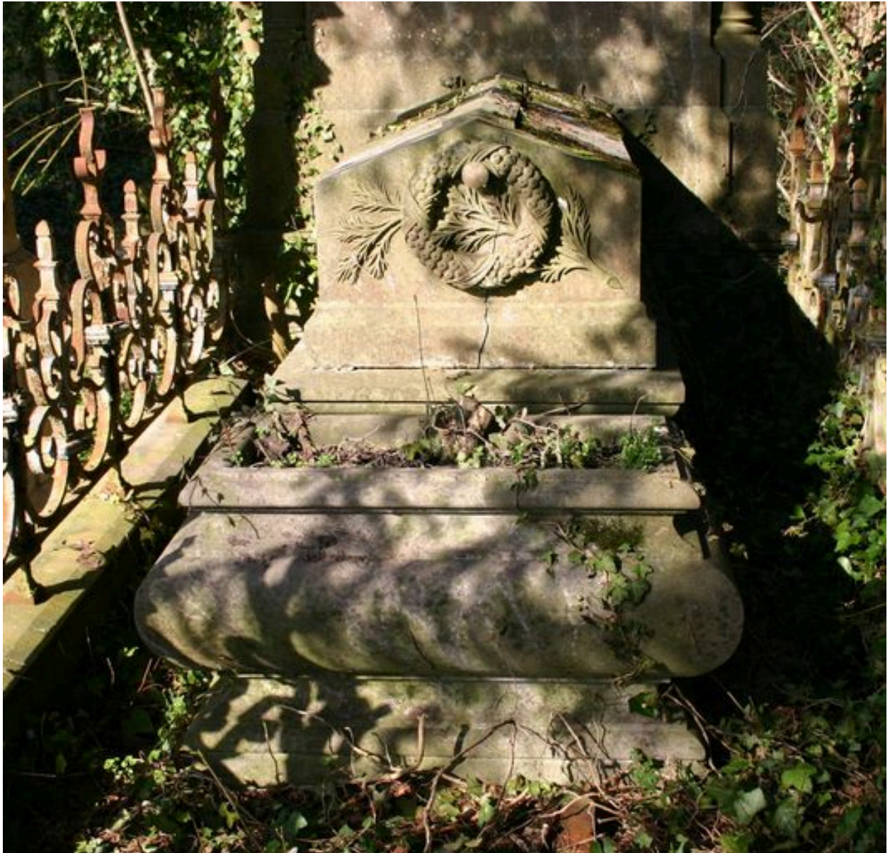
Jardinière à plantes monumentale.