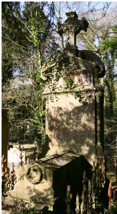
Tombeau-monument, composé d'une stèle architecturée précédée d'un tombeau en forme de sarcophage.