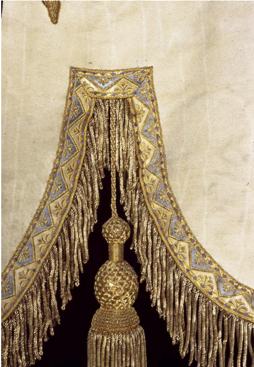
Détail de la bannière : franges et gland en fil d'or.