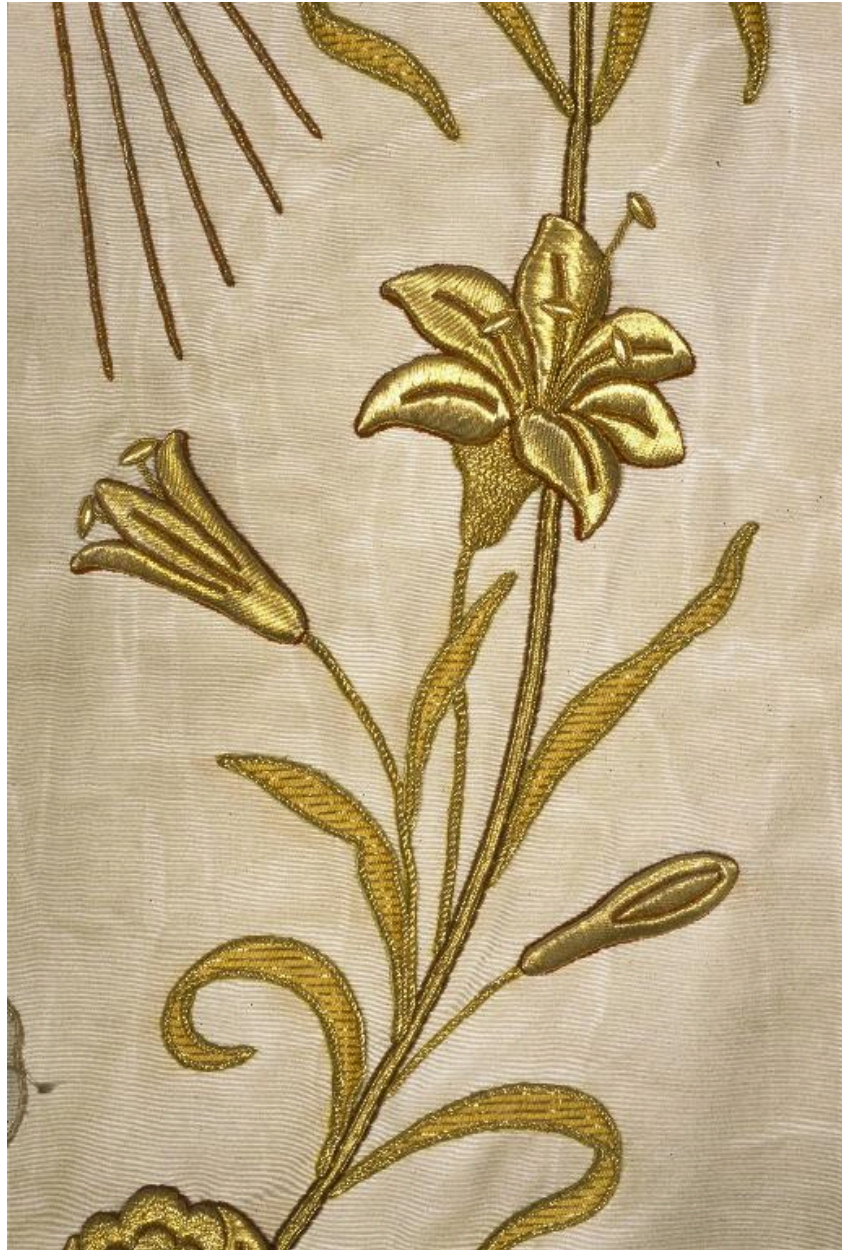
Détail de la bannière : tige de lys en fil d'or.