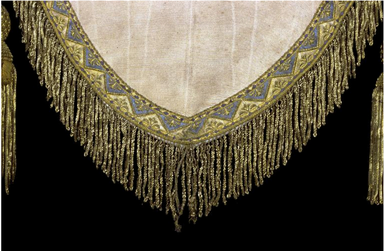
Détail de la bannière : le galon et les franges en fil d'or.