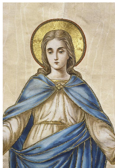
Détail de la bannière : la Vierge, en buste.