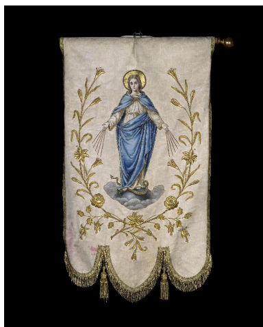
Vue générale de la bannière.