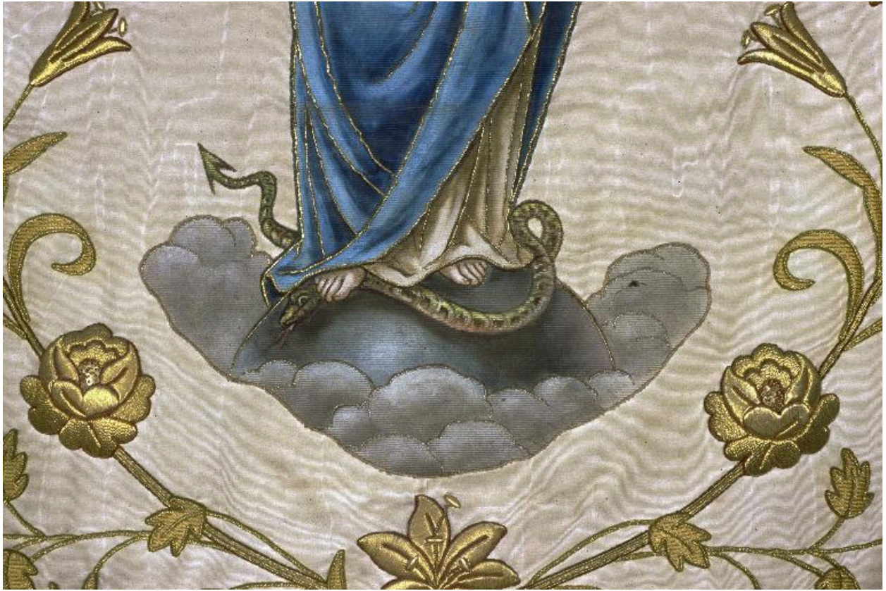
Détail de la bannière : le serpent écrasé par la Vierge.