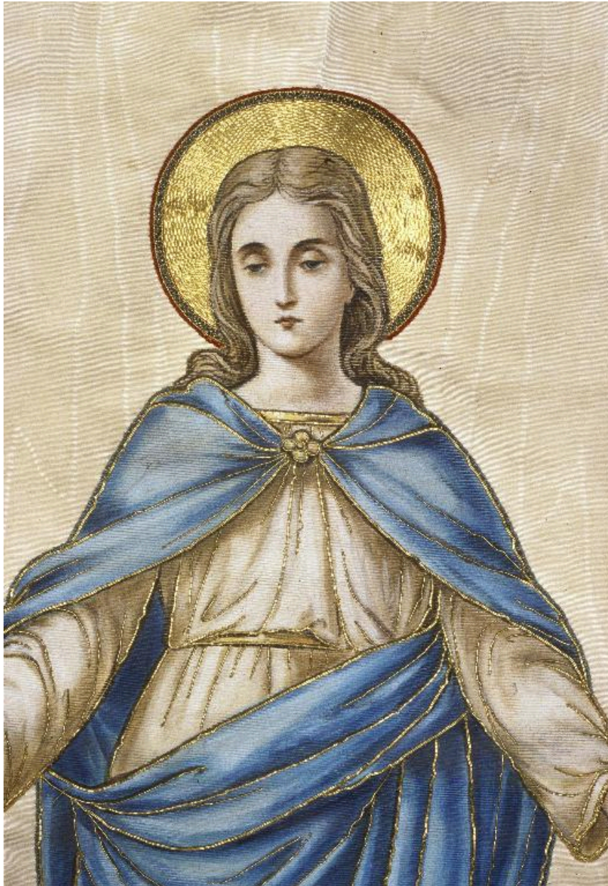
Détail de la bannière : la Vierge, en buste.