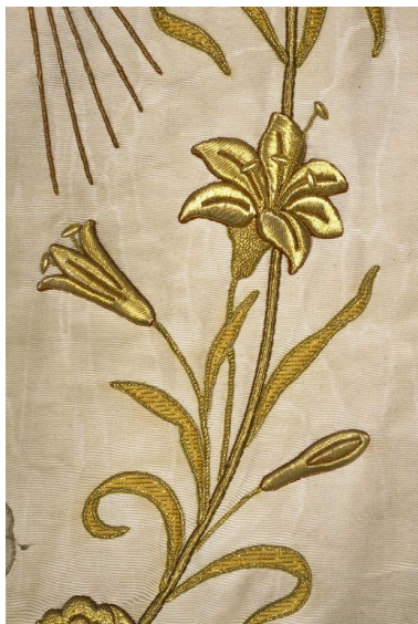
Détail de la bannière : tige de lys en fil d'or.