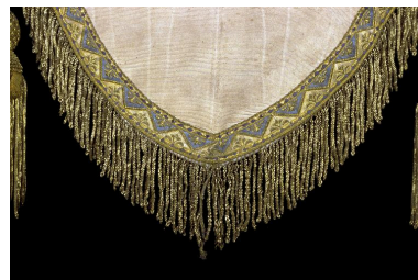
Détail de la bannière : le galon et les franges en fil d'or. IVR22_20020200676ZA