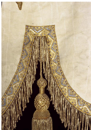
Détail de la bannière : franges et gland en fil d'or.