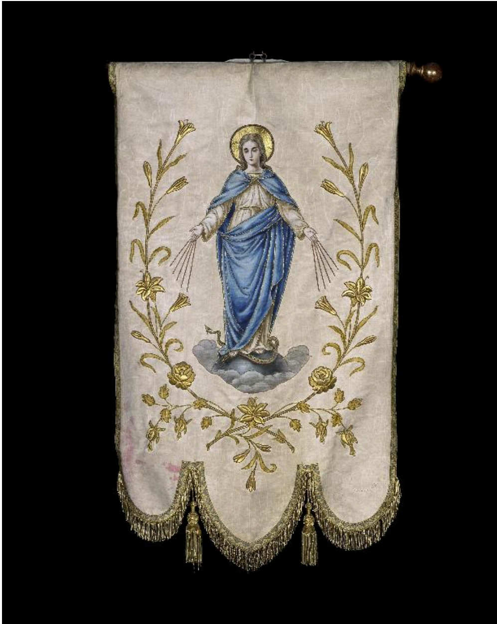
Vue générale de la bannière.