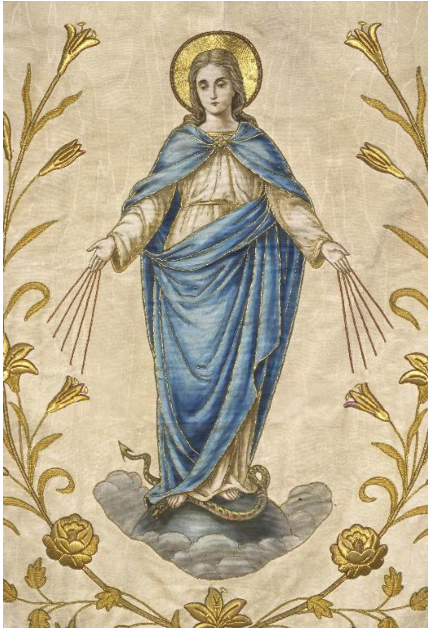
Décor de la partie centrale : l'Immaculée Conception.