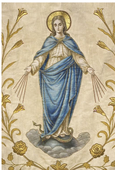
Décor de la partie centrale : l'Immaculée Conception. IVR22_20020200674ZA