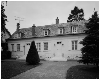
Elévation antérieure. IVR22_19846001113V