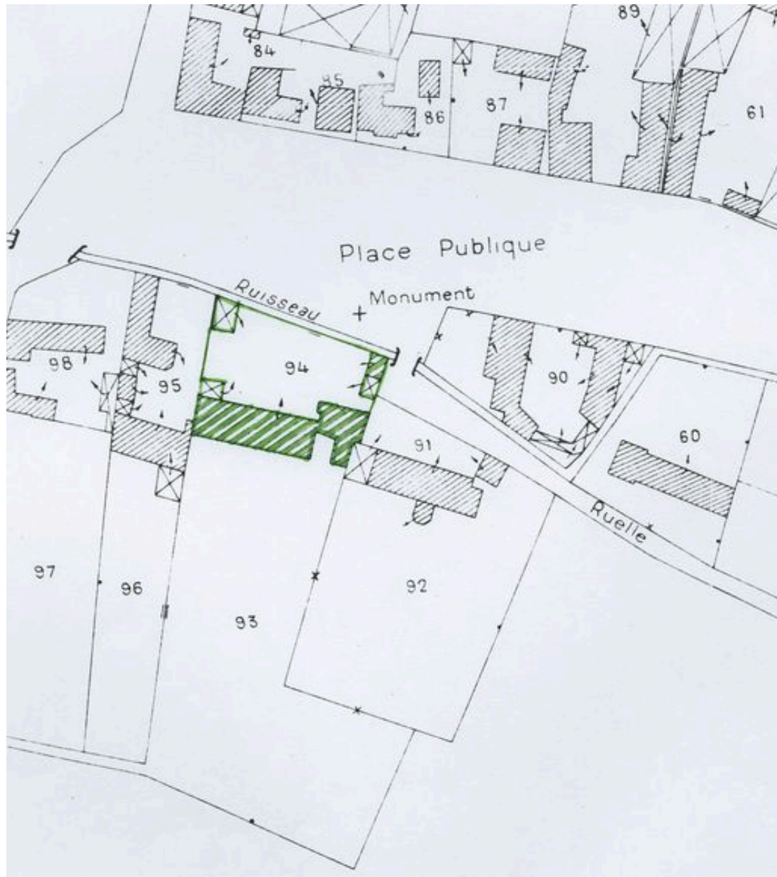
Plan de situation. Extrait du plan cadastral de 1978, section AB 94.