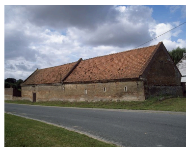
Vue des bâtiments d'exploitation depuis la route.