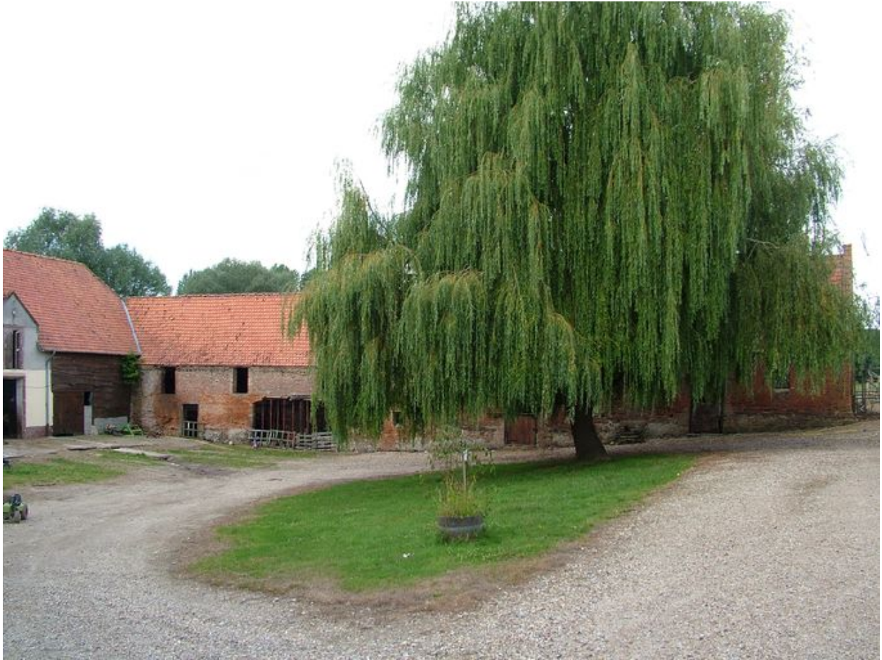
Vue de la cour vers le sud-ouest.