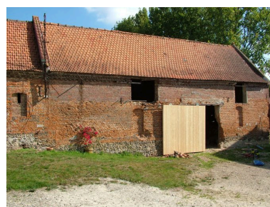
Vue de la remise à l'est.