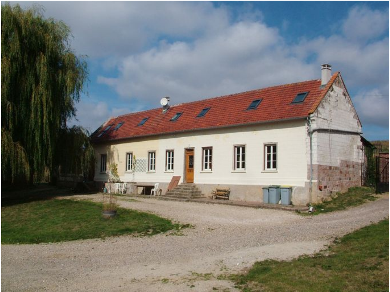
Vue du logis sur la cour.