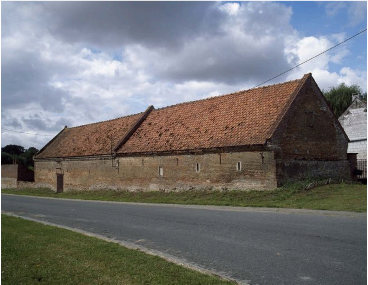
Vue des bâtiments d'exploitation depuis la route.