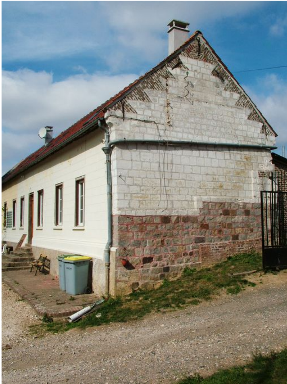
Vue du pignon est du logis.