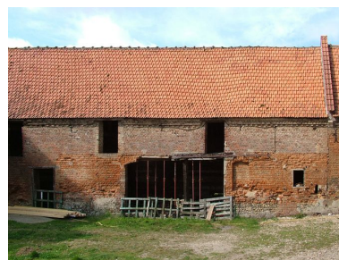
Vue de la grange bordant la cour à l'ouest. IVR22_20098005460NUCA