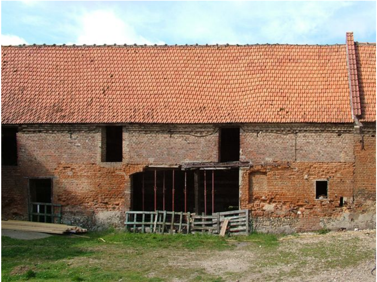
Vue de la grange bordant la cour à l'ouest.