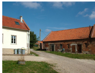
Vue partielle du logis, du portail et de l'ancienne étable à l'est. IVR22_20098005464NUCA