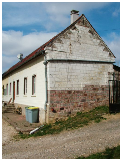
Vue du pignon est du logis.