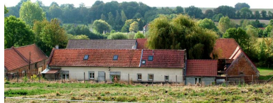
Vue cavalière depuis le nord. IVR22_20098005455NUCA