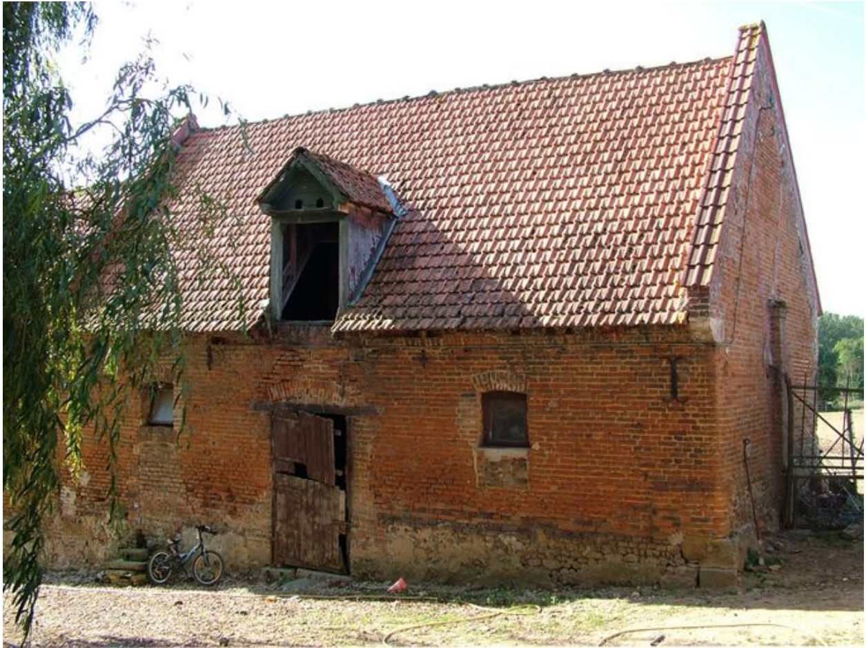
Vue de l'étable à l'ouest.