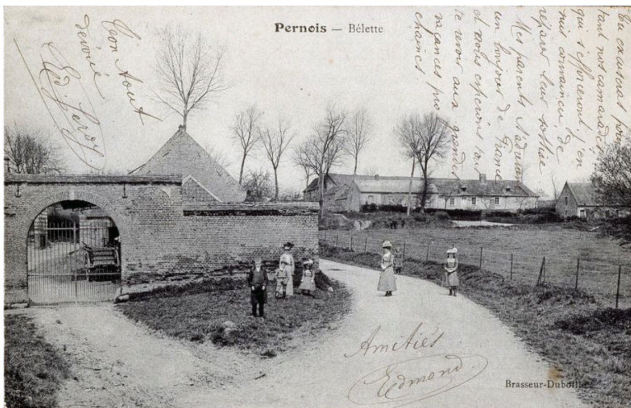
Portail sud de la ferme, avant 1914 (coll. part.).