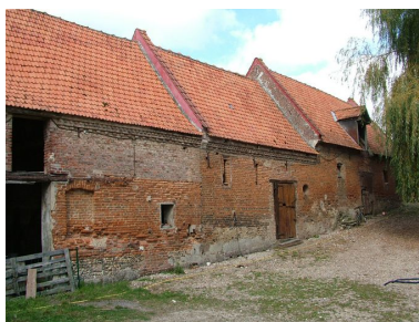
Vue des bâtiments d'exploitation bordant la cour à l'ouest. IVR22_20098005459NUCA