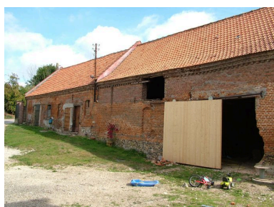
Vue des bâtiments d'exploitation bordant la cour à l'est. IVR22_20098005461NUCA