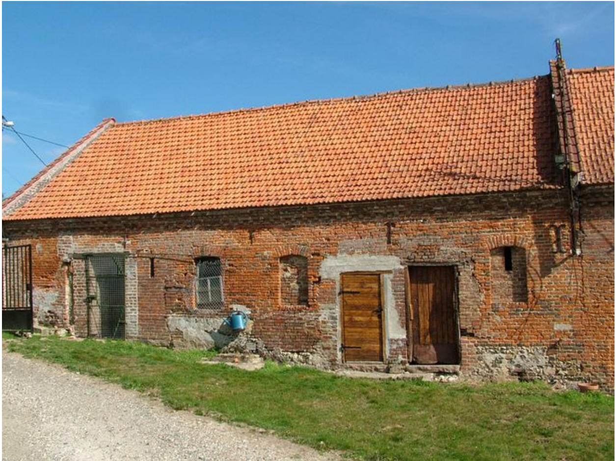
Vue de l'ancienne étable à l'est.