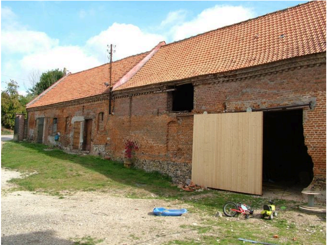
Vue des bâtiments d'exploitation bordant la cour à l'est.