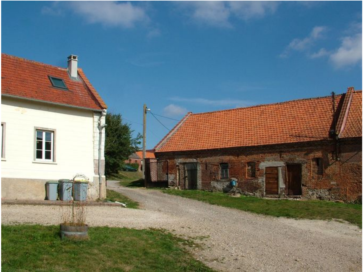
Vue partielle du logis, du portail et de l'ancienne étable à l'est.