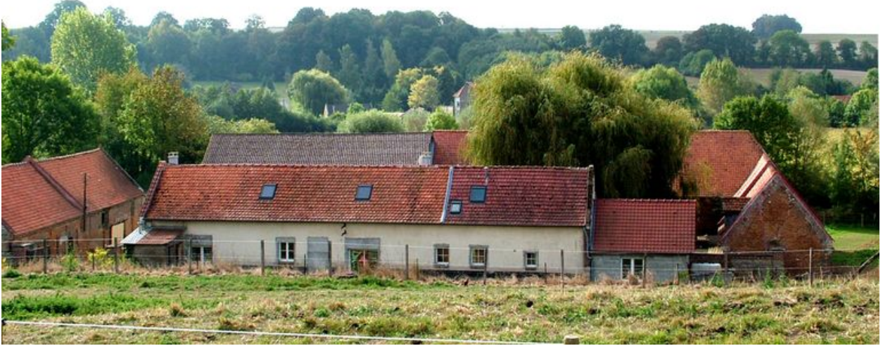
Vue cavalière depuis le nord.