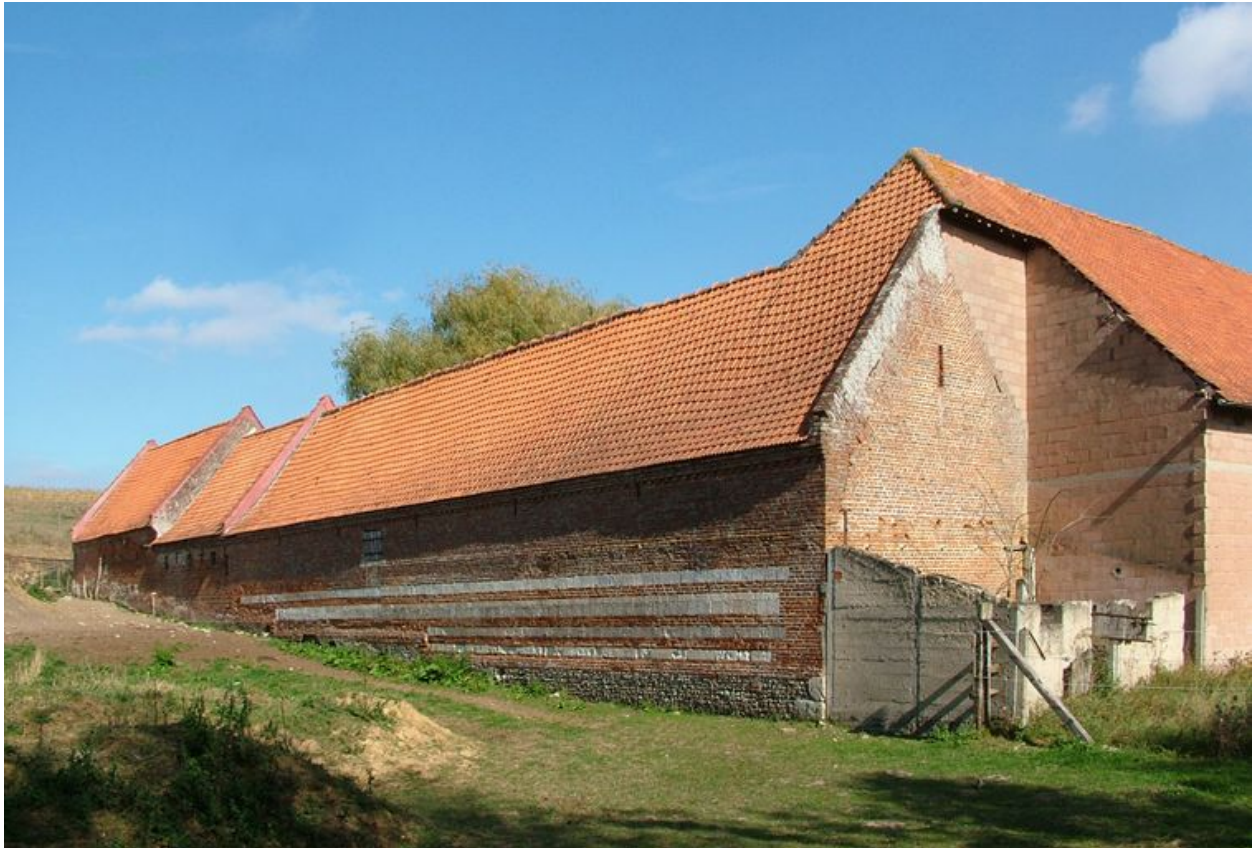
Vue extérieure des bâtiments d'exploitation à l'ouest.