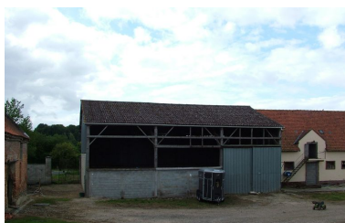
Vue de la grange et de l'écurie modernes sur la cour. IVR22_20098005401NUCA