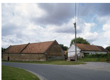
Vue générale depuis la route. IVR22_20098000240XA