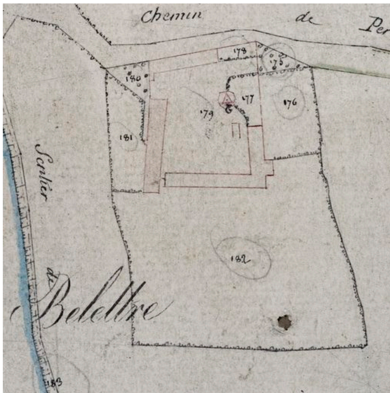
Détail du plan cadastral, section C, par Carette, 1832 (AD Somme ; 3P 1447/5).