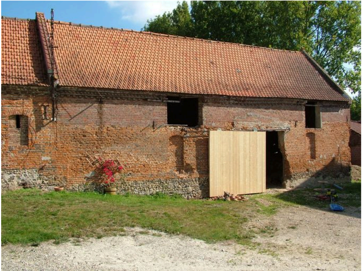
Vue de la remise à l'est.