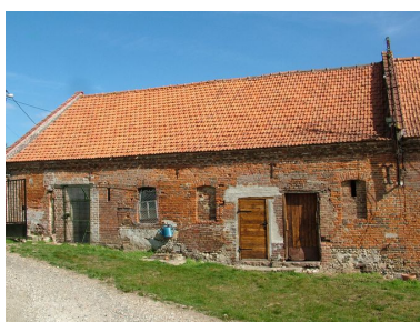
Vue de l'ancienne étable à l'est. IVR22_20098005463NUCA