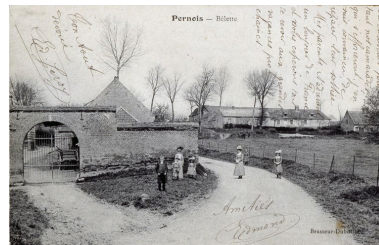
Portail sud de la ferme, avant 1914 (coll. part.). IVR22_20108000071XA