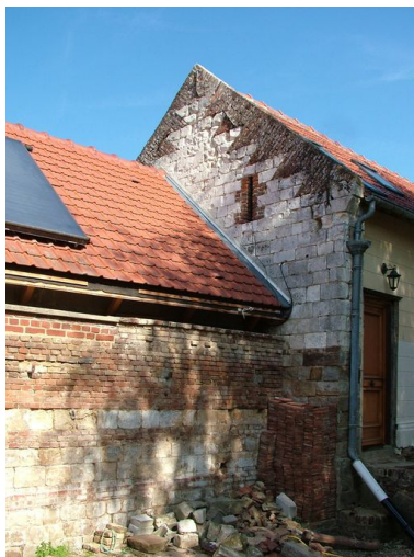
Vue partielle du pignon ouest du logis et du mur d'un bâtiment disparu. IVR22_20098005467NUCA