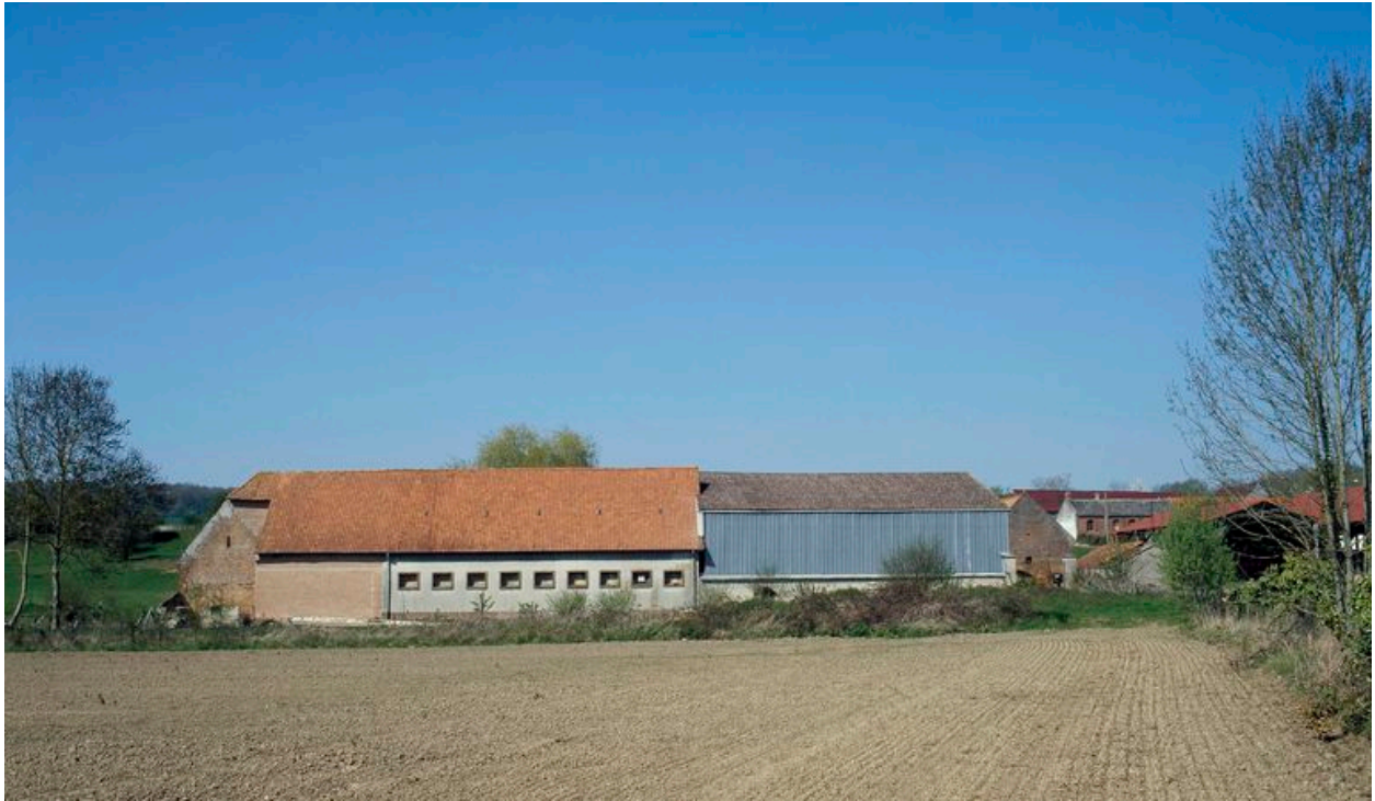
Vue générale depuis le sud.