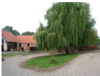
Vue de la cour vers le sud-ouest.