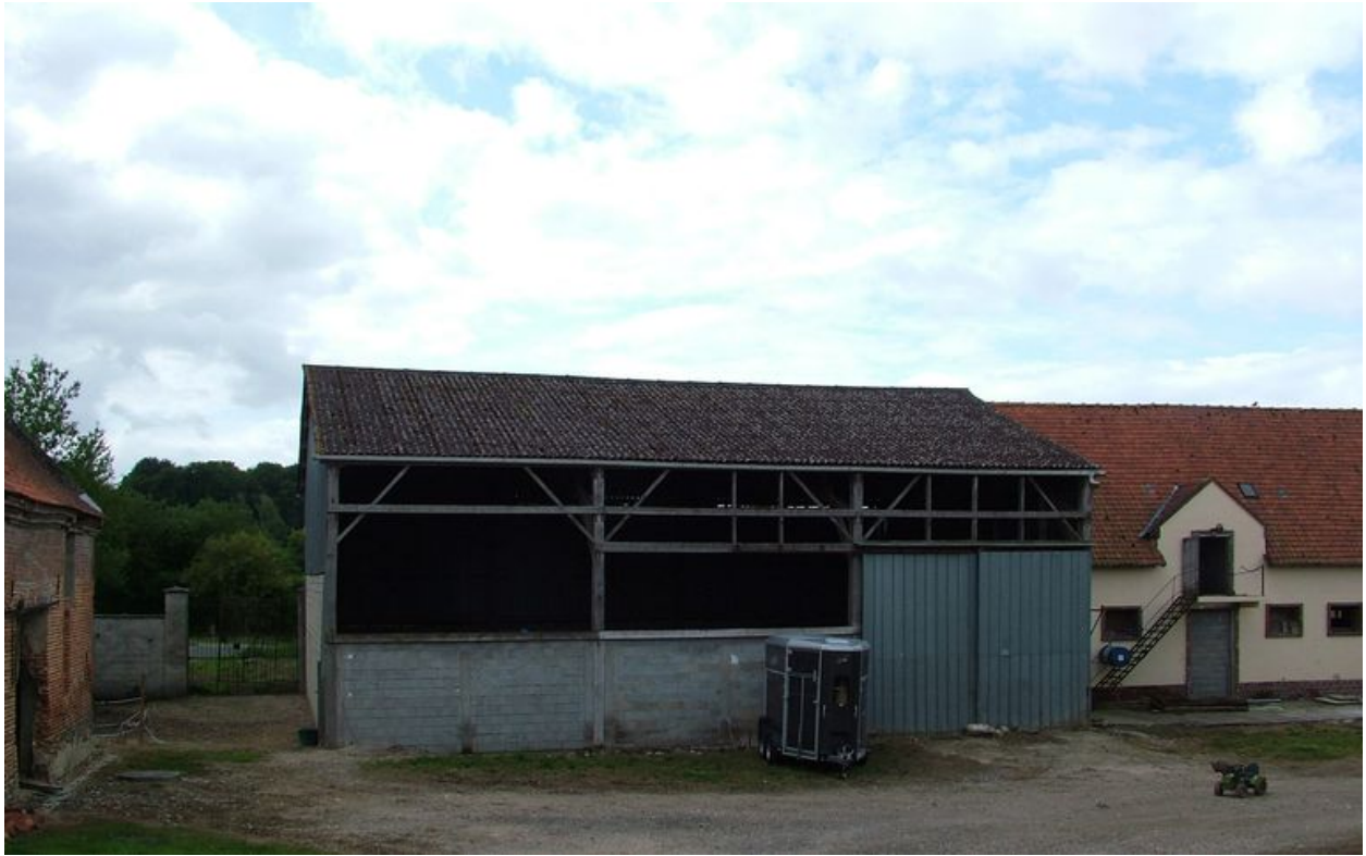
Vue de la grange et de l'écurie modernes sur la cour.