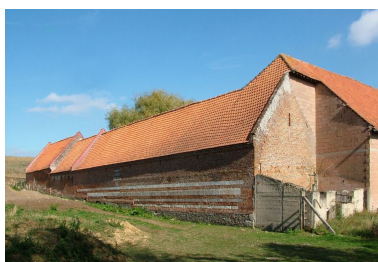
Vue extérieure des bâtiments d'exploitation à l'ouest. IVR22_20098005458NUCA