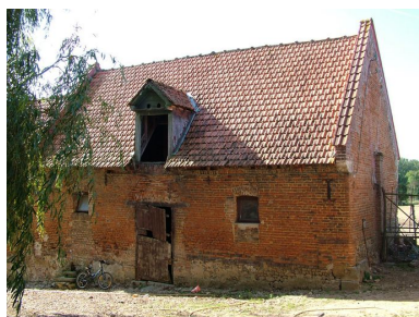
Vue de l'étable à l'ouest. IVR22_20098005465NUCA