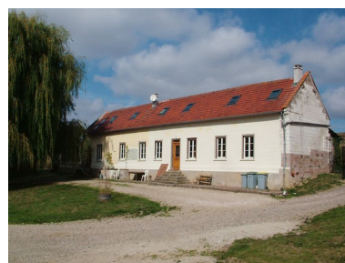
Vue du logis sur la cour.