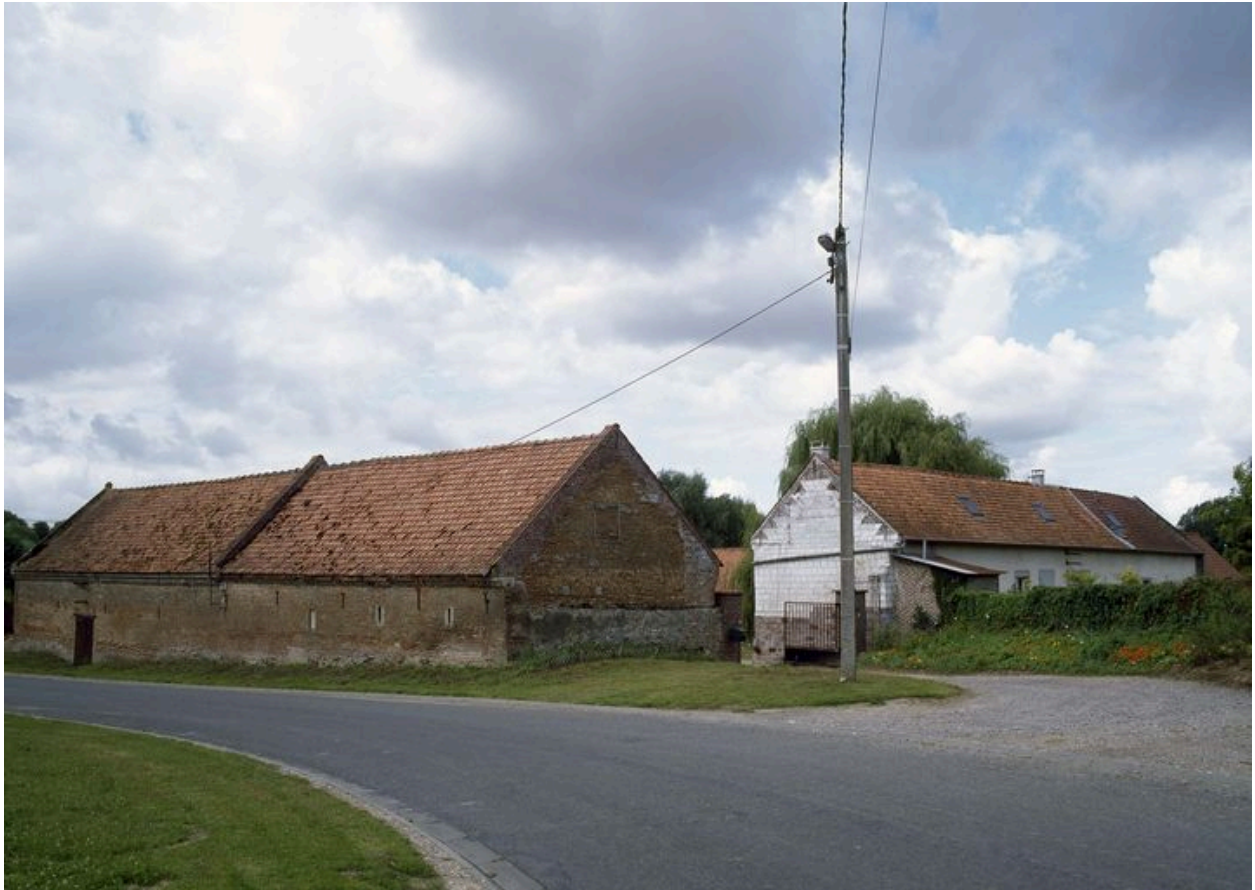
Vue générale depuis la route.