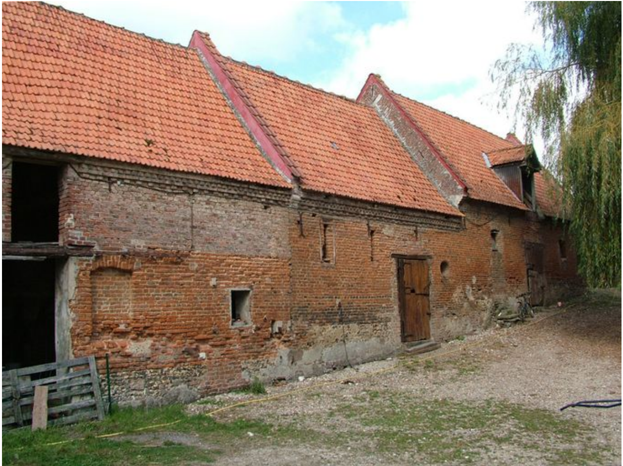
Vue des bâtiments d'exploitation bordant la cour à l'ouest.