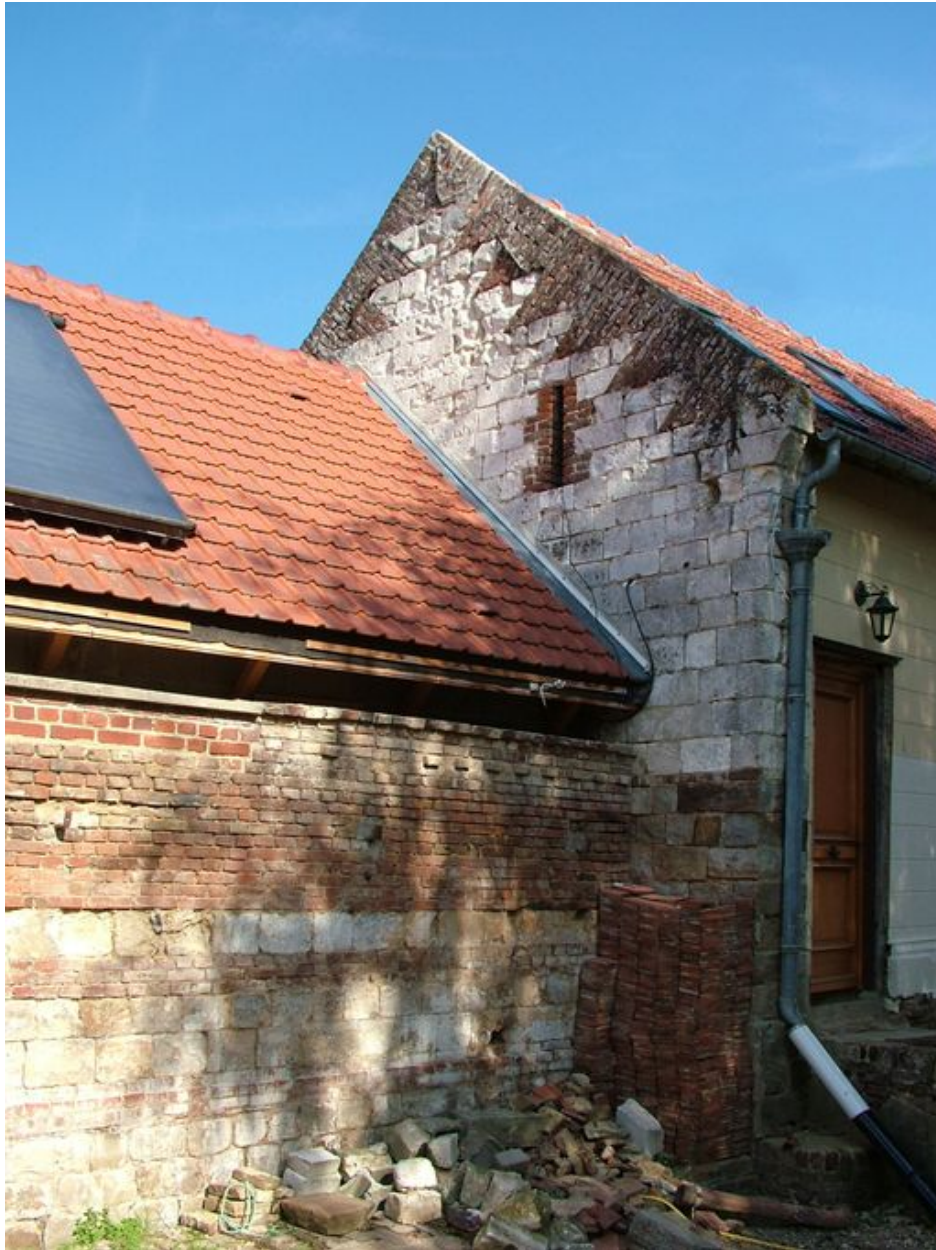
Vue partielle du pignon ouest du logis et du mur d'un bâtiment disparu.