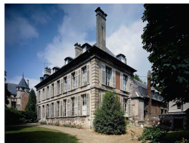
Logis. Vue générale. IVR22_19866000164VA