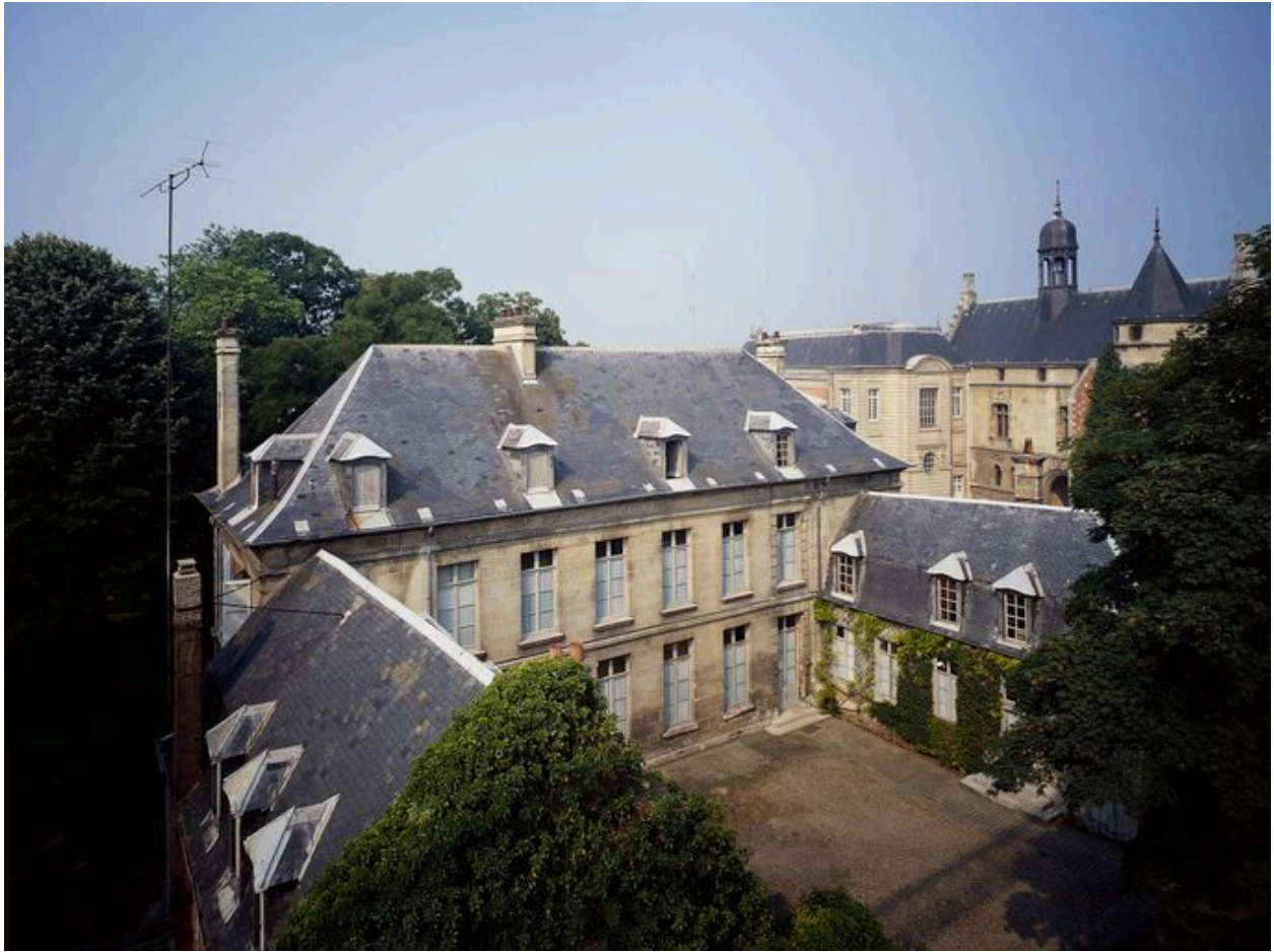
Elévation sur cour.