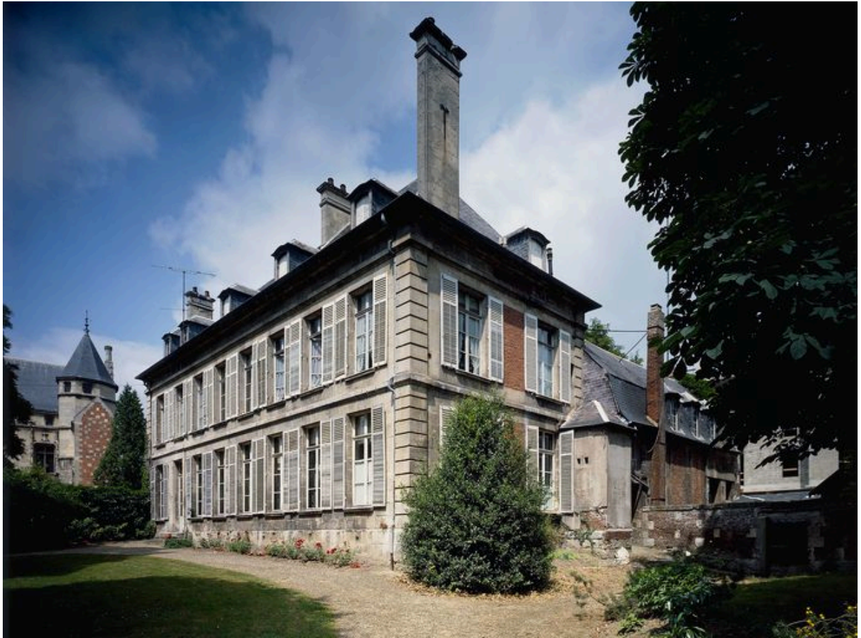
Logis. Vue générale.