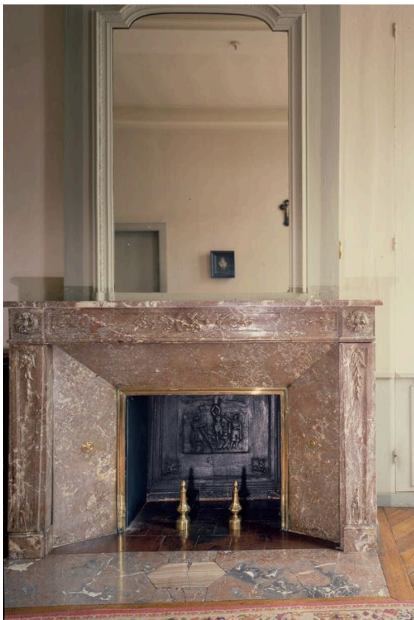
Vue d'une cheminée intérieure.