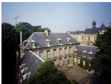
Elévation sur cour.