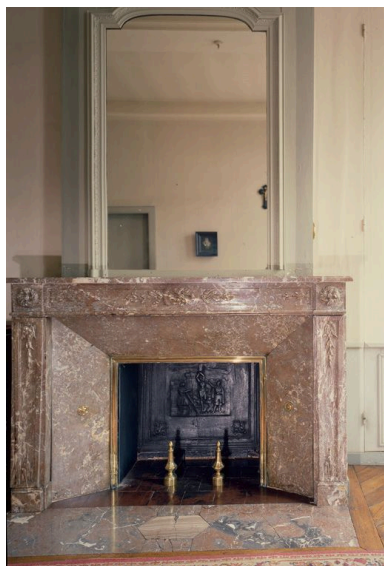
Vue d'une cheminée intérieure. IVR22_19856001553XA